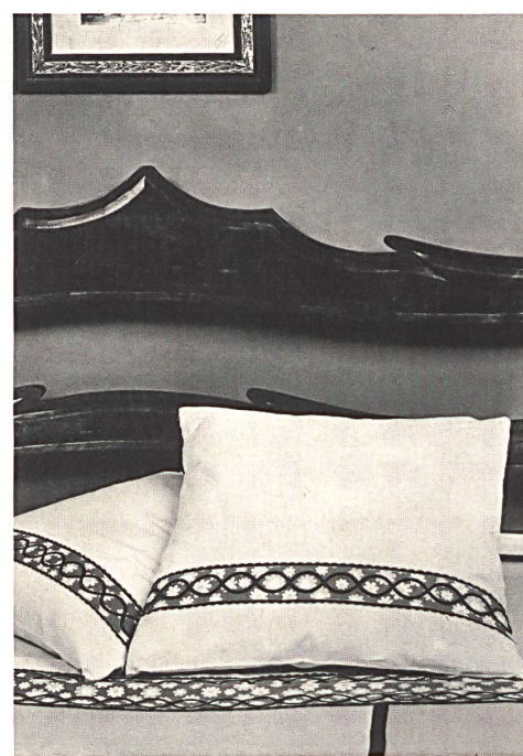
4 Mehrfarbige Stickerei auf weißem Bettwäscheband aus 100 % Baumwollbatist / Broderie multicolore sur bande de batiste blanche, pur coton, pour linge de lit / Multicoloured embroidery on white bedlinen band in pure cotton batiste / Ricamo multicolore su nastro bianco per la biancheria da letto, pura batista di cotone.