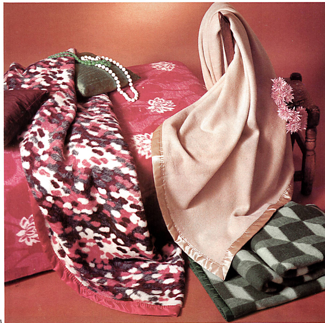
SCHWEIZERISCHE DECKEN- UND TUCHFABRIKEN AG, PFUNGEN

Die dynamische Geschäftsleitung beurteilt die Zukunft optimistisch. Dank der aussergewöhnlichen Qualitäten und dem modisch zeitgerechten Fabrikationsprogramm darf weiterhin mit einer weltweit guten Absatzmöglichkeit gerechnet werden. Der Verkaufsapparat ist nicht nur im Inland sondern auch in allen ausländischen Absatzgebieten ausgebaut worden, und man bemüht sich ständig, die Kontakte zur Kundschaft rege zu halten, um diese möglichst individuell und rasch ab Lager bedienen zu können. Das gross gefächerte Angebot enthält Schlafdecken in feinsten Schurwolle und in Orlon®, uni, double-face und mit Jacquard-Dessins, reine Kamelhaardecken in Sommer- und Winterqualitäten, Kamelhaardecken mit reiner Schurwolle gemischt, Luxus-Qualitätsdecken aus reinem Cashmere und kuschelig mollige Permanent-Veloursdecken in Jacquard und Uni. Weiter sind Couchdecken, Kinderdecken und Bébédecken im Sortiment enthalten. Reiseplaids in modischen Dessins, auch mit Fellmusterung und in leuchtenden Farben, sowie Rheumadecken als Matratzenauflage, mit reiner Schurwolle gefüllt, runden die umfassende Kollektion ab.