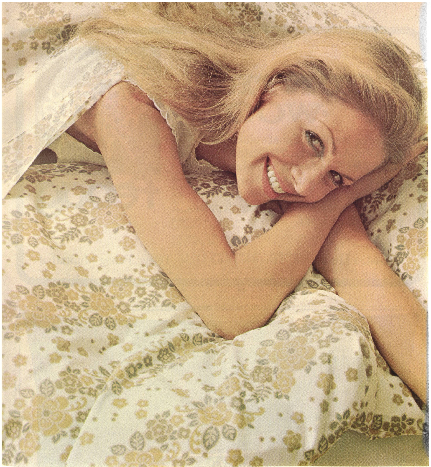
DESSIN 6602