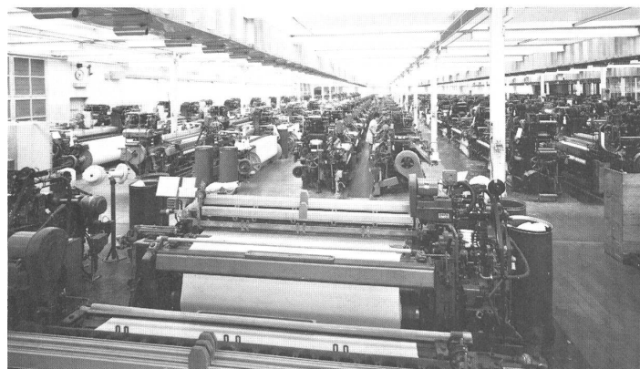
Broad loom for sheets Breite Webmaschinen für Betttücher

fektioniert man auch Bettwäsche mit Stickerei-Besatz. Natürlich wird das umfangreiche Bezugssortiment durch die assortierten Betttücher abgerundet, wobei das Unternehmen auch hier auf seine Spezialitäten nicht verzichtet und zusätzlich manchem Kundenwunsch entgegenkommt, was durch die eigene grosse Konfektionsabteilung — Bettwäsche wie Taschentücher — ermöglicht wird. Wie schon erwähnt, pflegt die Firma eine erfreuliche Zusammenarbeit mit einer andern Heimtextilienfabrik zur beidseitigen Bereicherung des Sortimentangebots, eine Entwicklung, die noch vor wenigen Jahren unter « Konkurrenten » nicht denkbar gewesen wäre. Heute vertieft eine solch weitblickende Geschäftspolitik die Beziehungen zur weltweiten Kundschaft, die das modische Qualitätsprodukt, verbunden mit echter Dienstleistung, zu würdigen weiss.