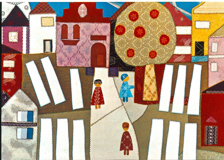
Bildteppich — Bleichestrasse — frühere Rasenbleiche aus Mustern der Firma BURGAUER & Co. AG ST.GALLEN seit 1860 führendes Unternehmen in Vorhangstoffen