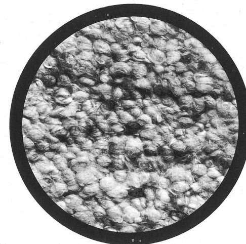
FEBAG AG, MUOTATHAL Country-wool-Senior-Teppich in Weiss mit Kamelhaarnoppen.

Wer das Echte schätzt, wird einem handgearbeiteten Teppich seine Vorliebe nicht versagen. Die neuen Country-wool-Qualitäten sind von ganz besonders luxuriöser Struktur. Reine, unverfälschte Wolle wird nach einem Spezialverfahren von Hand gesponnen und nachher zu dicken, flauschigen Teppichen von Hand gewebt. Sie verleihen eine grosse Wohnbehaglichkeit. Ihre Strapazierfähigkeit ist beachtlich; auch kann man sie doppel-seitig verwenden. Die Naturfarben kommen dem heutigen Wohntrend entgegen. FEBAG arbeitet die Country-wool-Teppiche in allen Spezial-massen bis zu einer Breite von 270 cm.