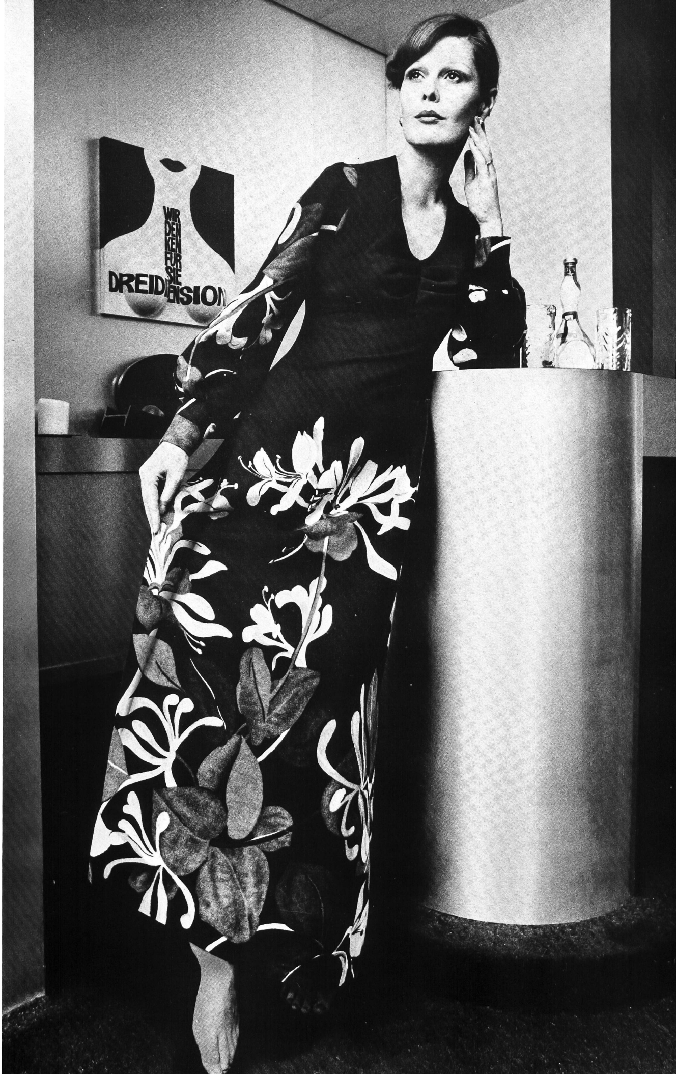
Robe d'intérieur en Acryl® avec riche bordure à la jupe et aux manches.