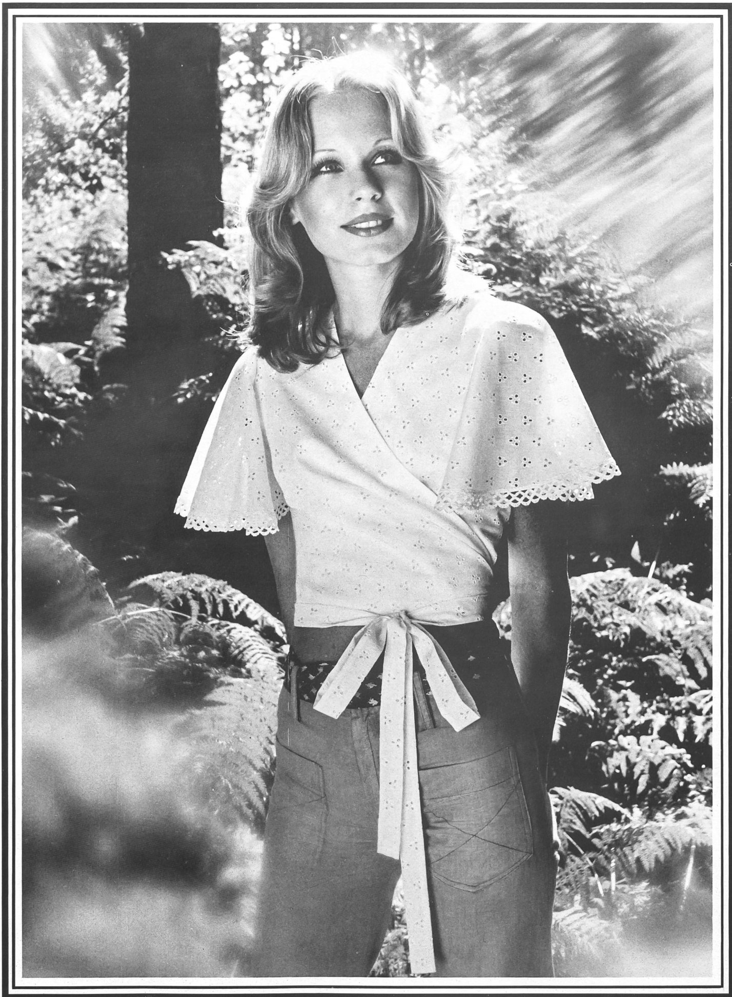
H.W. GIGER AG, FLAWIL Blouse cache-cœur mode en coton brodé.