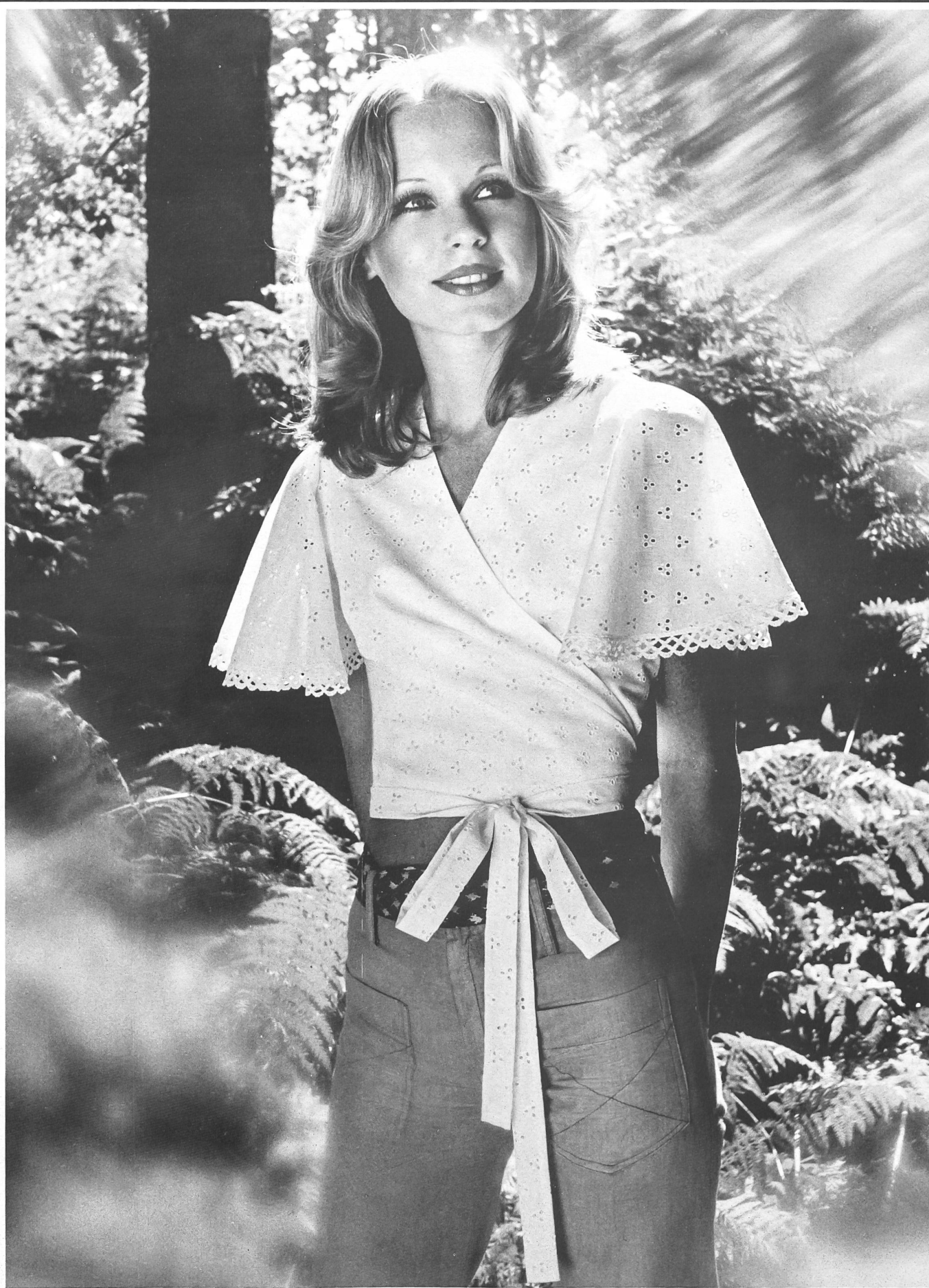
H.W. GIGER AG, FLAWIL Blouse cache-cœur mode en coton brodé.