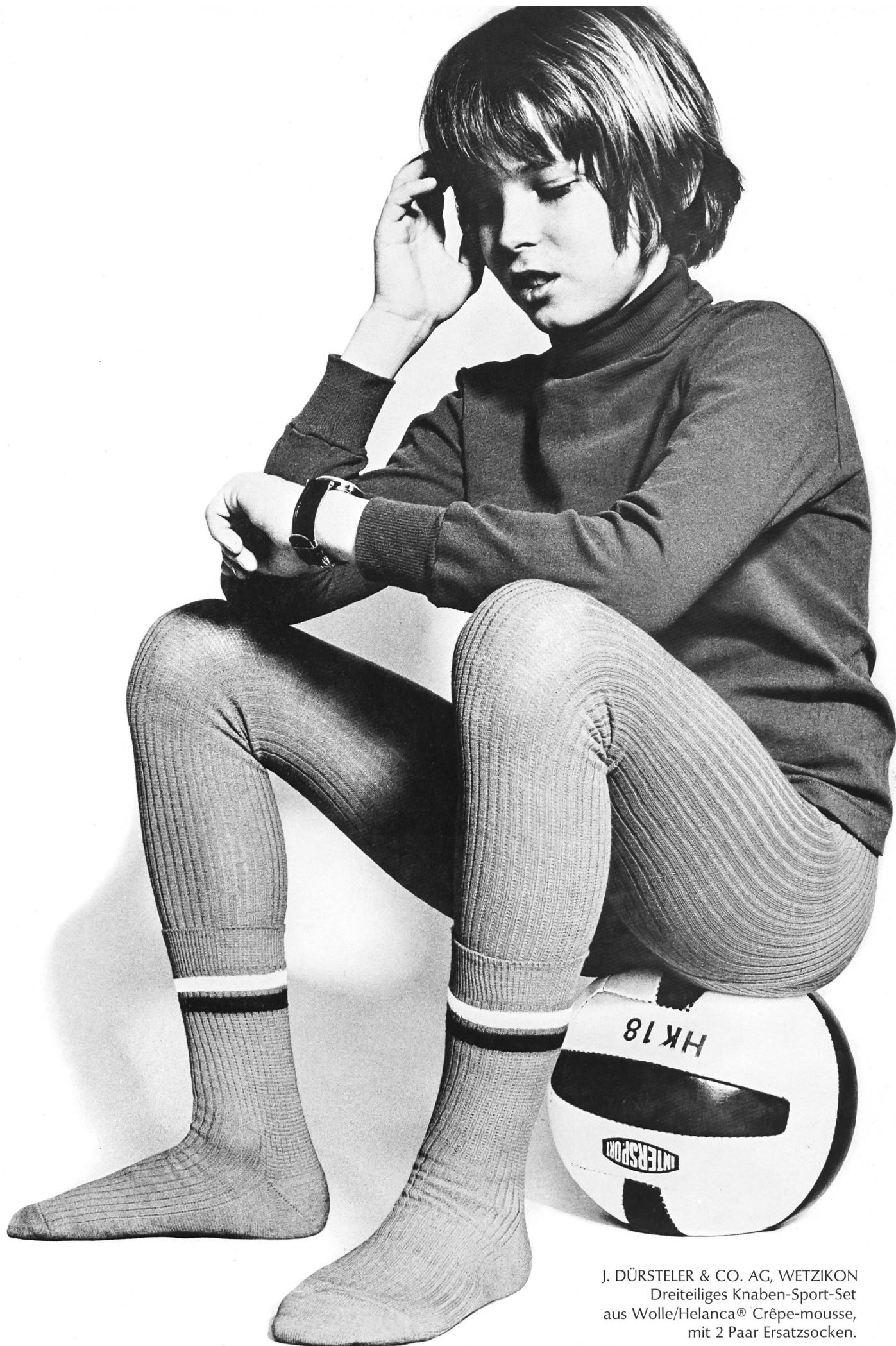
J. DÜRSTELER & CO. AG, WETZIKON Dreiteiliges Knaben-Sport-Set aus Wolle/Helanca® Crêpe-mousse, mit 2 Paar Ersatzsocken.