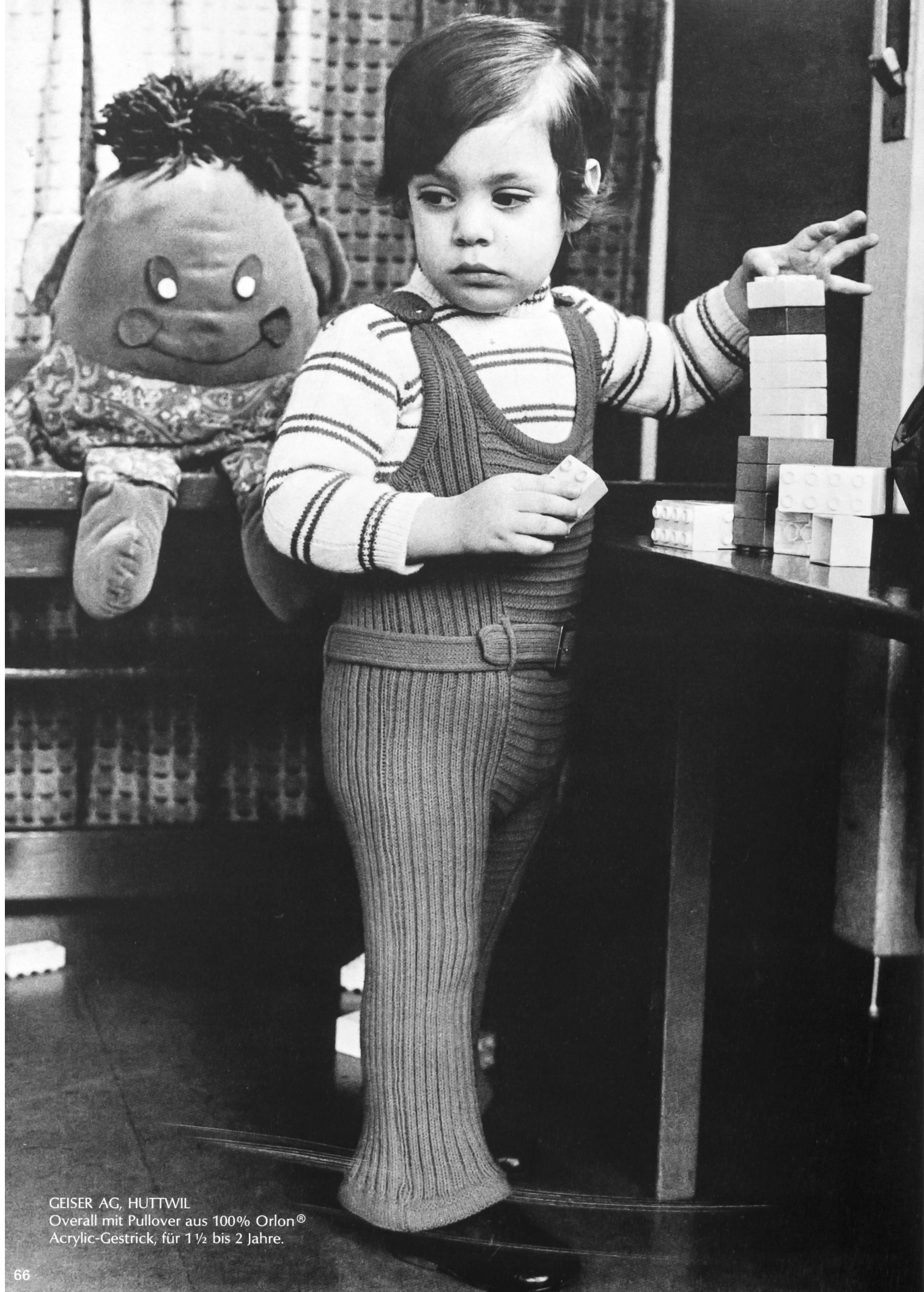
GEISER AG, HUTTWIL Overall mit Pullover aus 100% Orlon® Acrylic-Gestrick, für 1 ½ bis 2 Jahre.