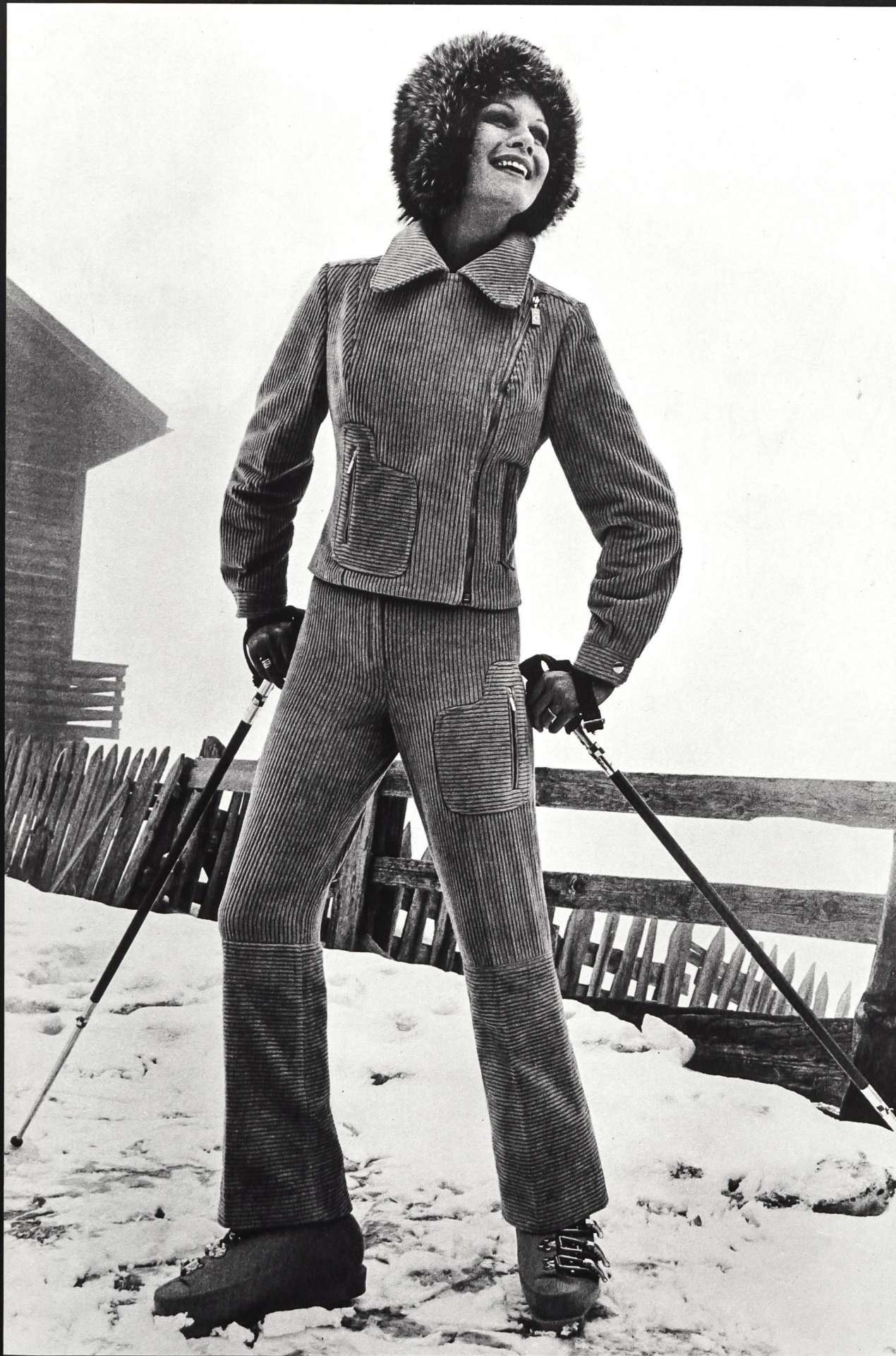
CROYDOR AG, ZÜRICH Eleganter Ski-Anzug aus elastischem Cord.