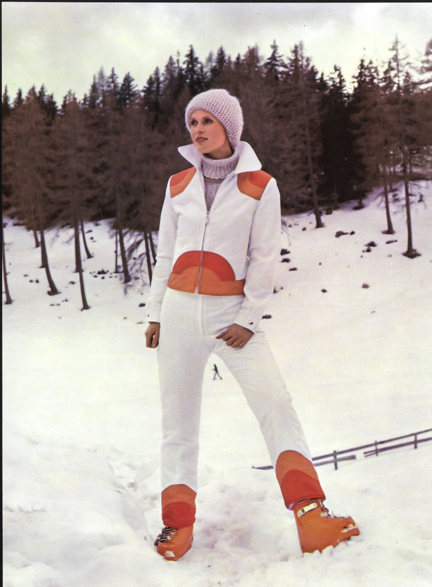
CROYDOR AG, ZÜRICH Zweiteiliger weisser Ski-Anzug aus Nylsuisse® mit raffiniertem zweifarbigem Abschluss.

Stoff: Seidenweberei Filzbach Vertriebs AG, Zürich