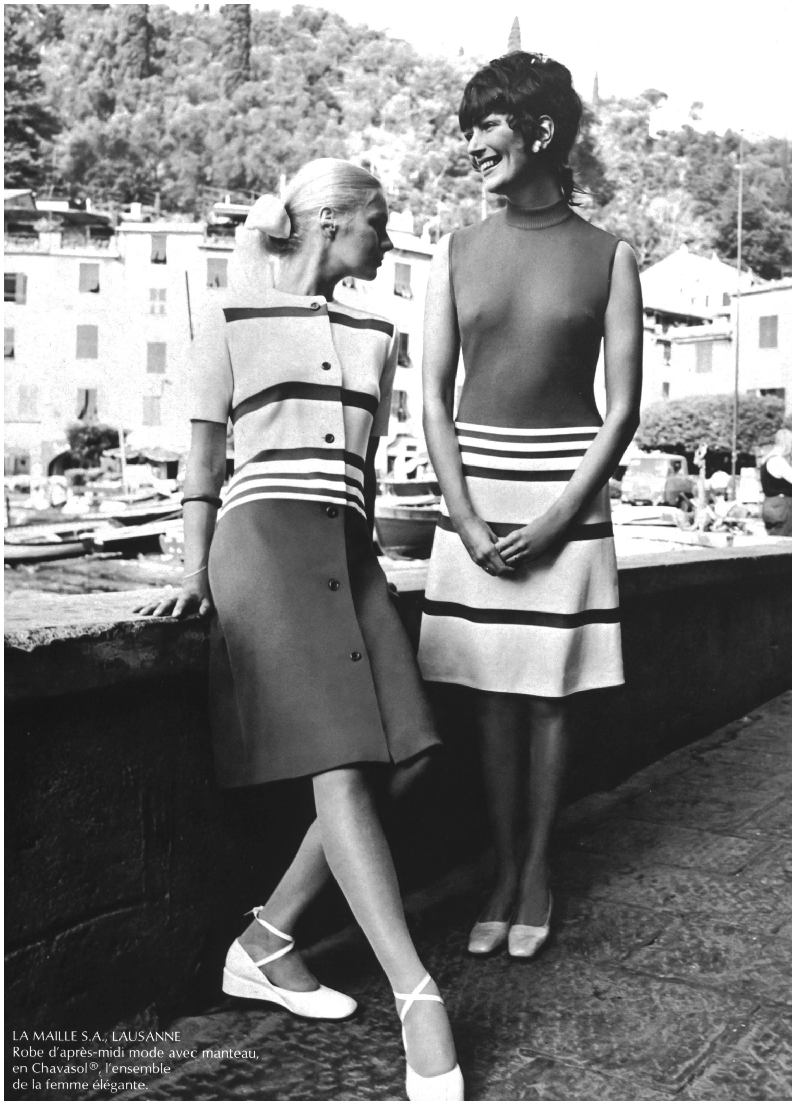
LA MAILLE S.A., LAUSANNE Robe d'après-midi mode avec manteau, en Chavasol®, l'ensemble de la femme élégante.