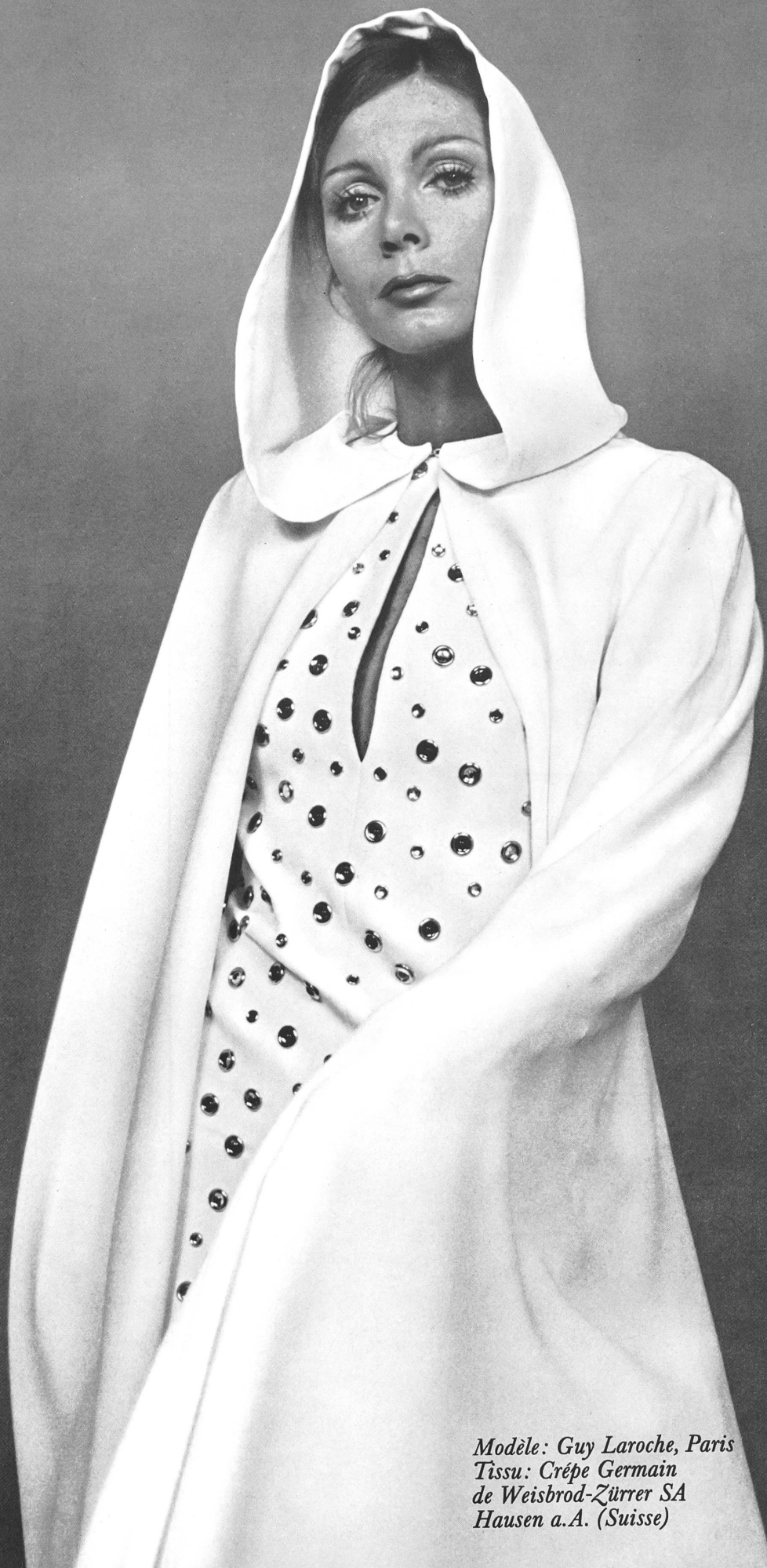
Modèle: Guy Laroche, Paris Tissu: Crêpe Germain de Weisbrod-Zürcher SA Hausen a.A. (Suisse)