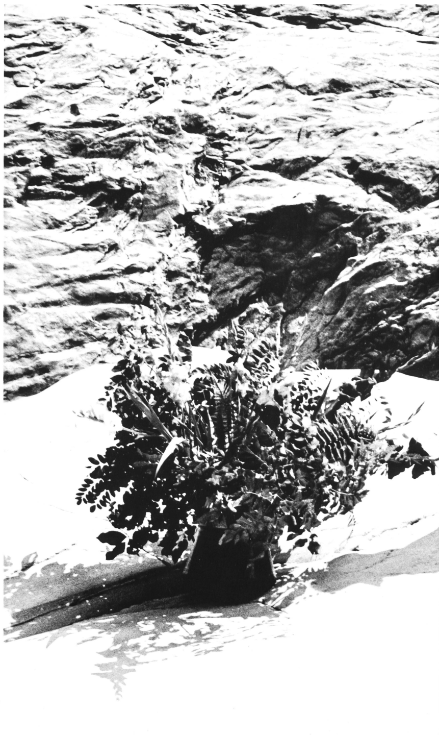
EL-EL AG, ZÜRICH A gauche: Ensemble de gardenparty en satin imprimé Sunion.

(Tissu: Mettler & Cie S.A., 9000 Saint-Gall)