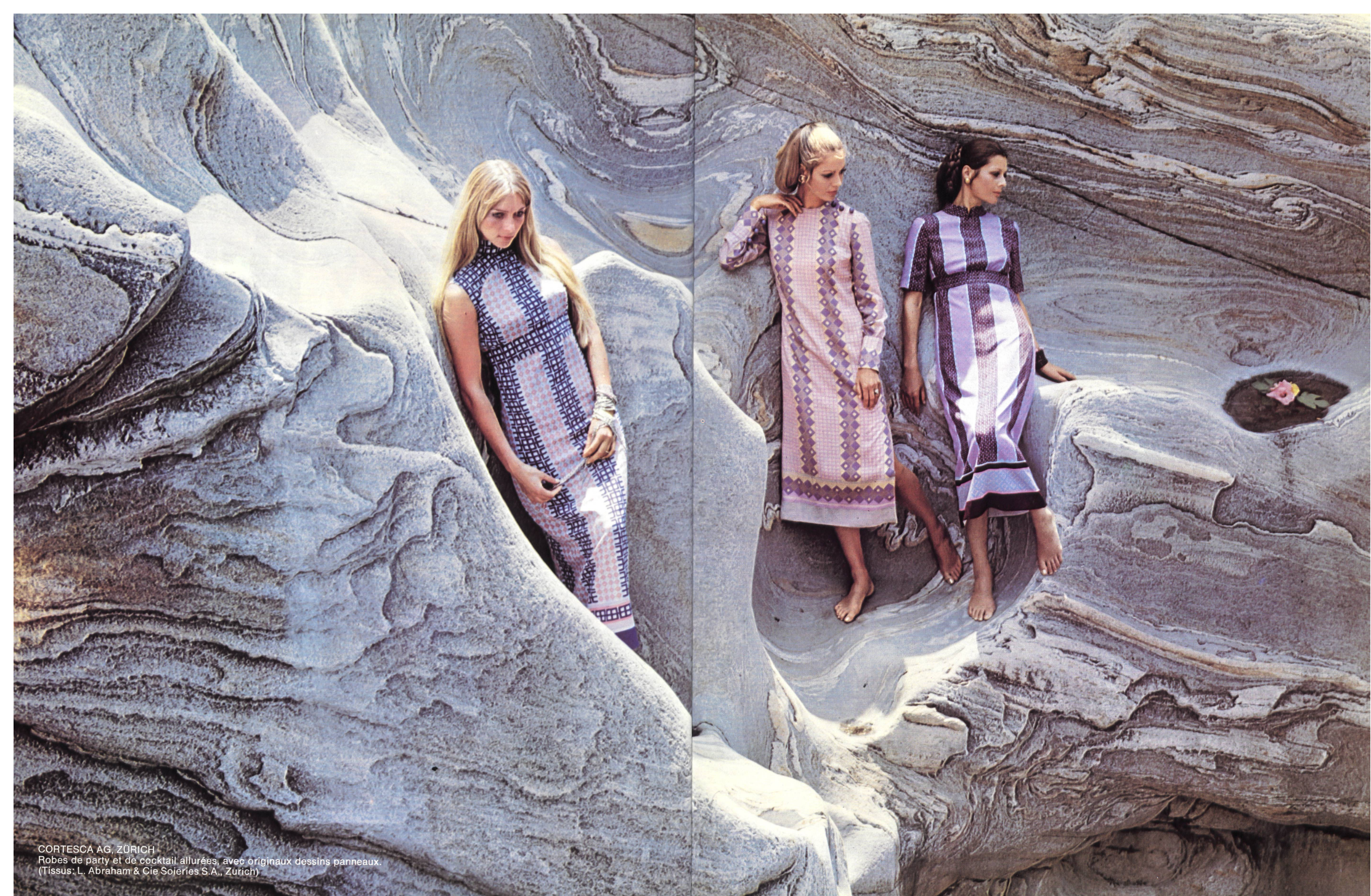
CORTESCA AG, ZÜRICH Robes de party et de cocktail allurées, avec originaux dessins panneaux. (Tissus: L. Abraham & Cie Soieries S.A., Zürich)