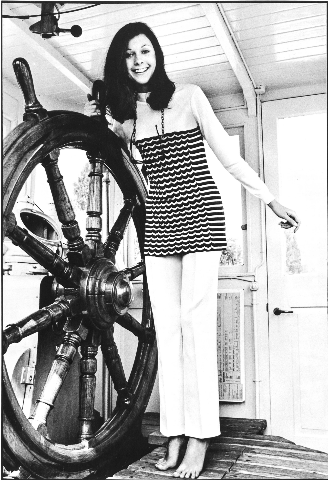
TRICOTERNA AG, ZÜRICH Weisses Hosenensemble aus Dylene® mit aparter blauer und roter Streifengarnitur.