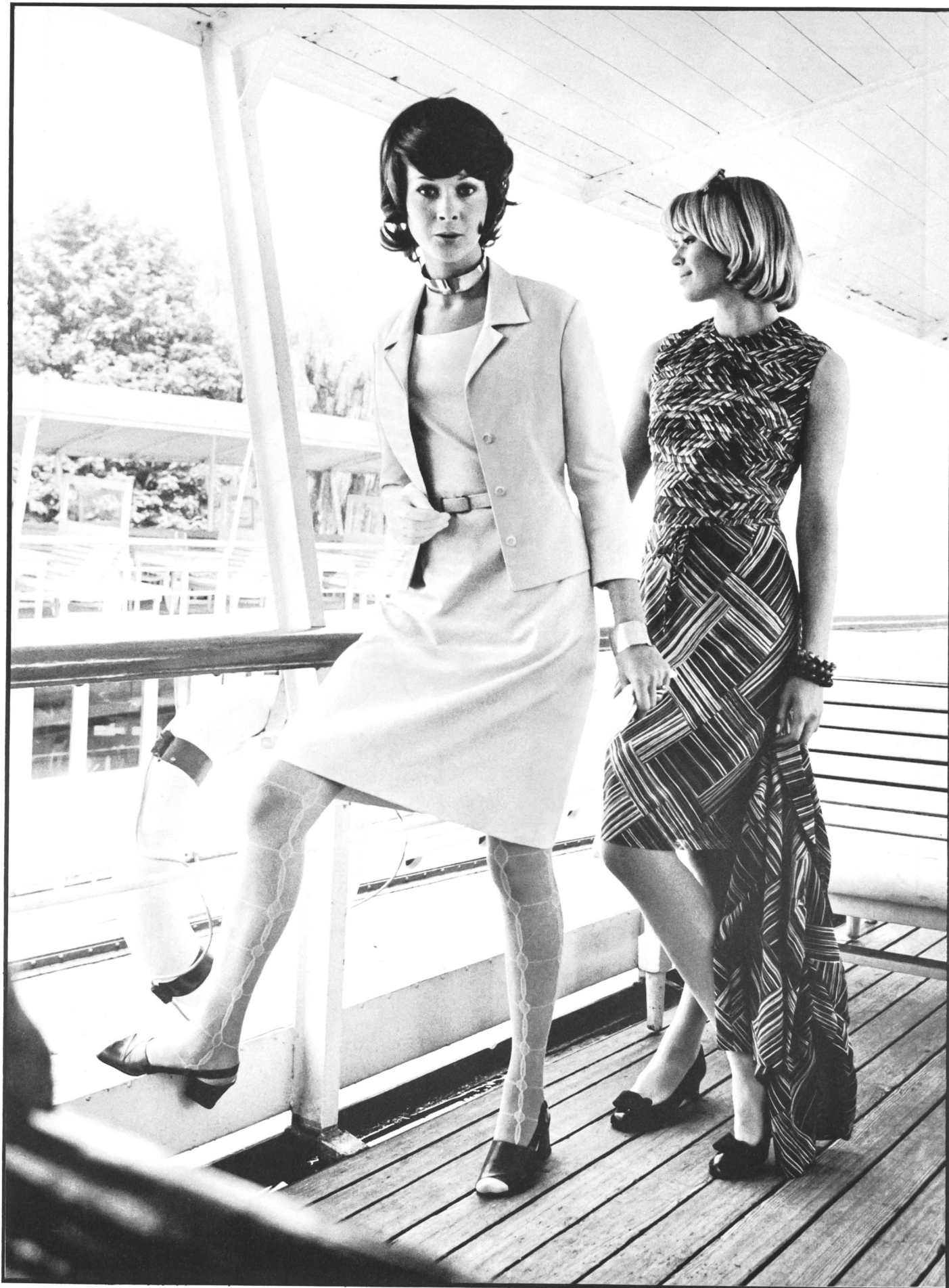
48 WALTER STARK AG, ST. GALLEN Links: Leichtes, elegantes Sommerkleid aus seidenähnlicher Baumwolle. Rechts: Nachmittagskleid mit Jacke, durchgearbeitetes Oberteil, aus dezent bedrucktem, leichtem Baumwoll-Voile.