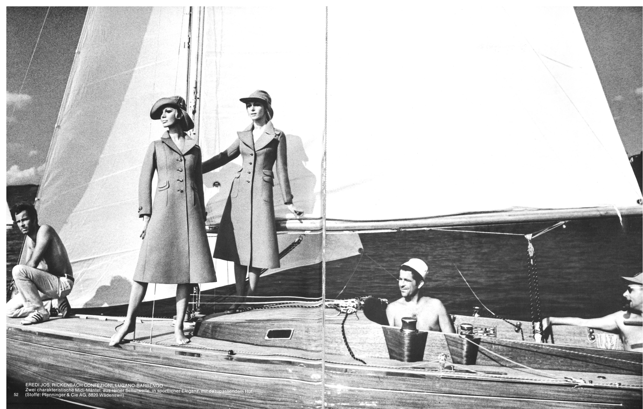
EREDI JOS. RICKENBACH CONFEZIONI, LUGANO-BARBENGO Zwei charakteristische Midi-Mäntel, aus reiner Schurwolle, in sportlicher Eleganz, mit dazupassendem Hut. (Stoffe: Pfenninger & Cie AG, 8820 Wädenswil)