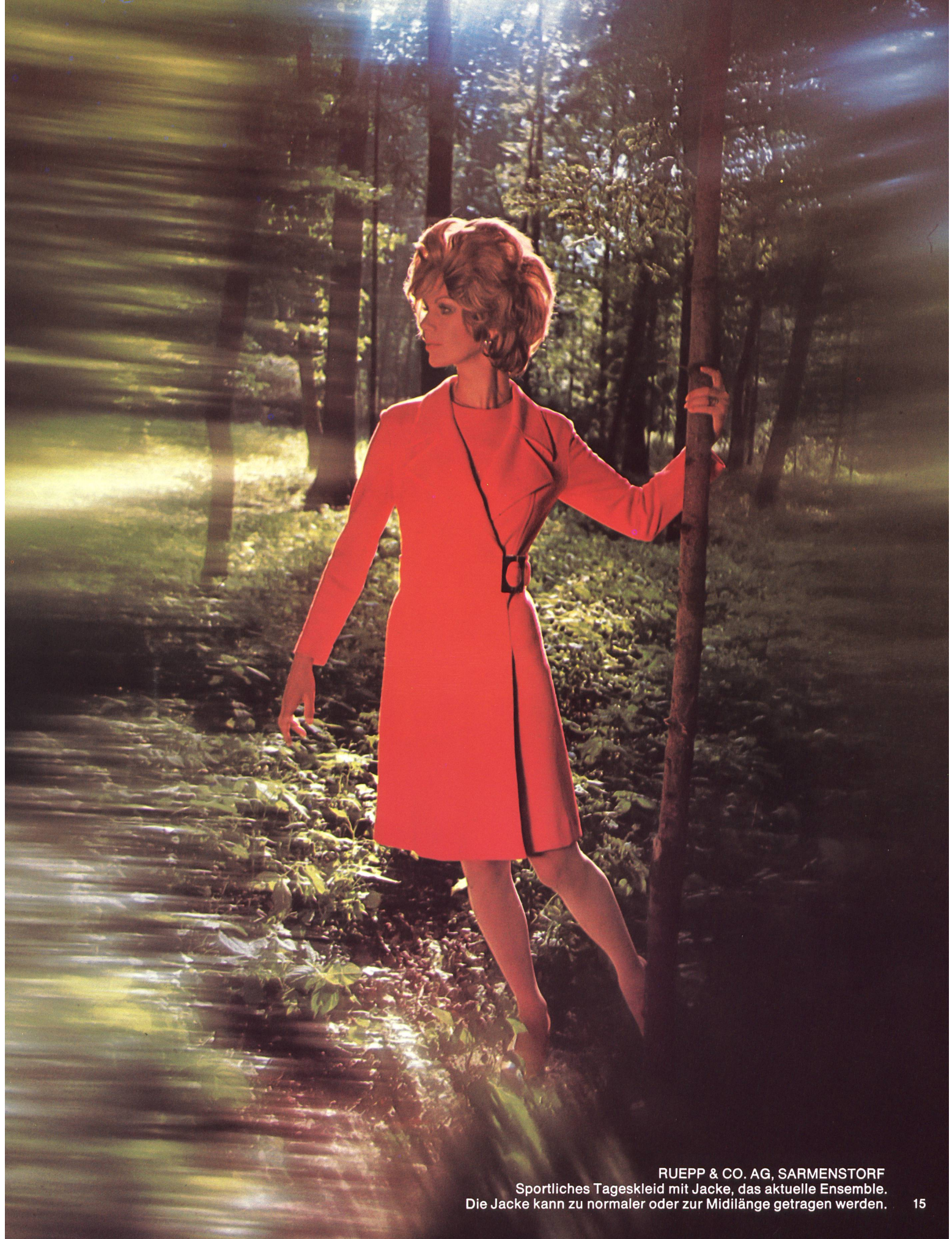
RUEPP & CO. AG, SARMENSTORF Sportliches Tageskleid mit Jacke, das aktuelle Ensemble. Die Jacke kann zu normaler oder zur Midilänge getragen werden.