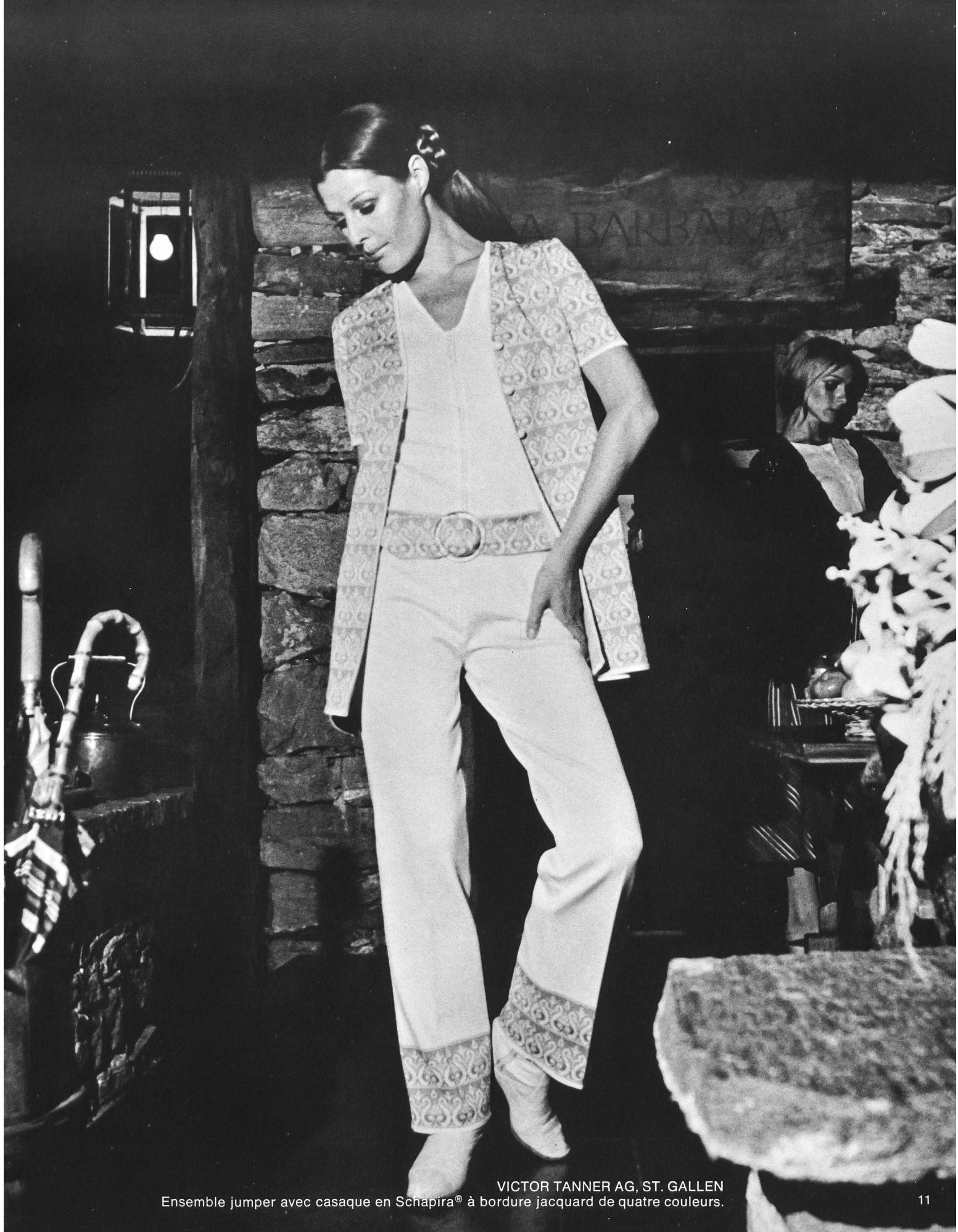
VICTOR TANNER AG, ST. GALLEN Ensemble jumper avec casaque en Schapira® à bordure jacquard de quatre couleurs.