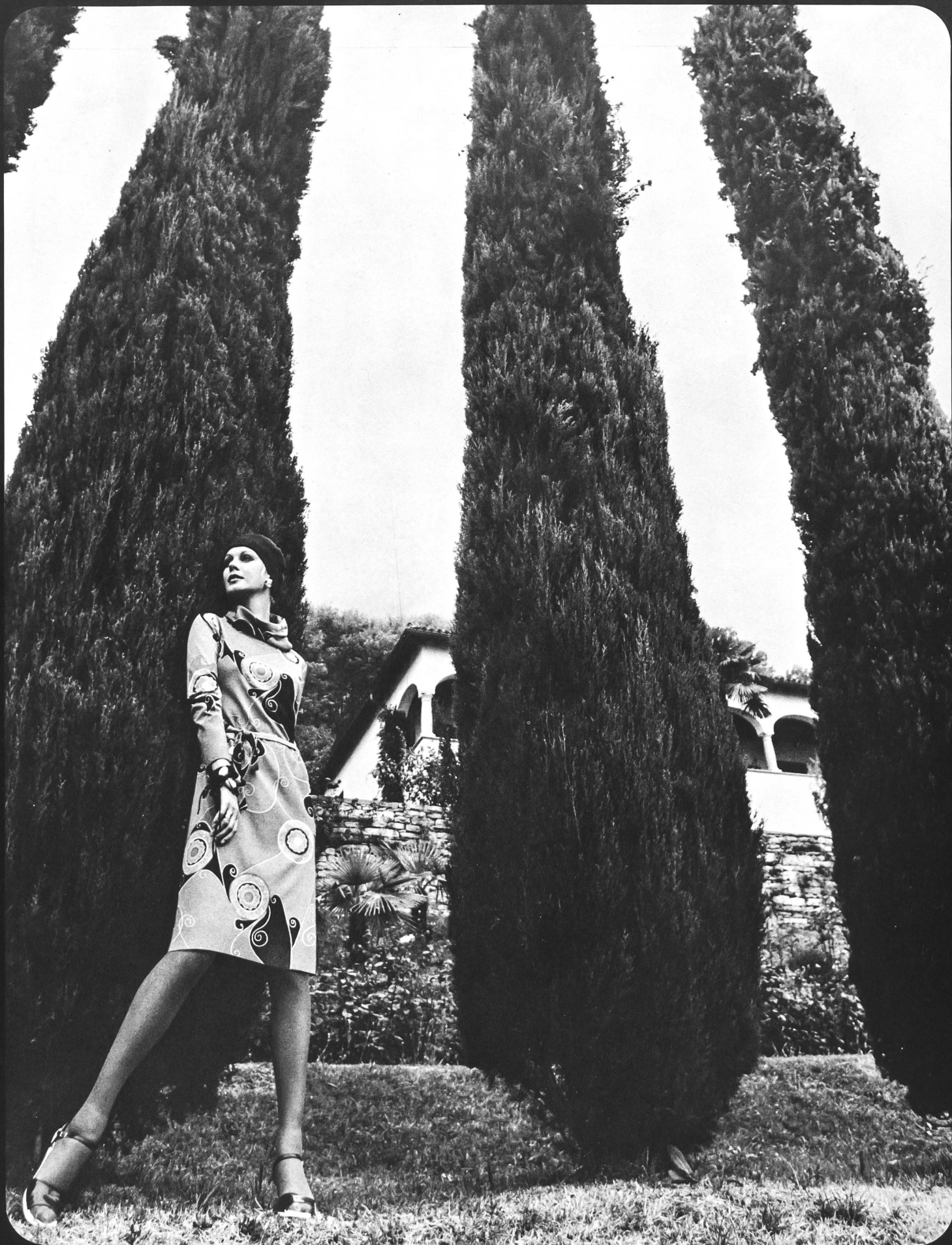
LA MAILLE S.A., LAUSANNE Élégante robe d'après-midi en jersey de polyester imprimé.