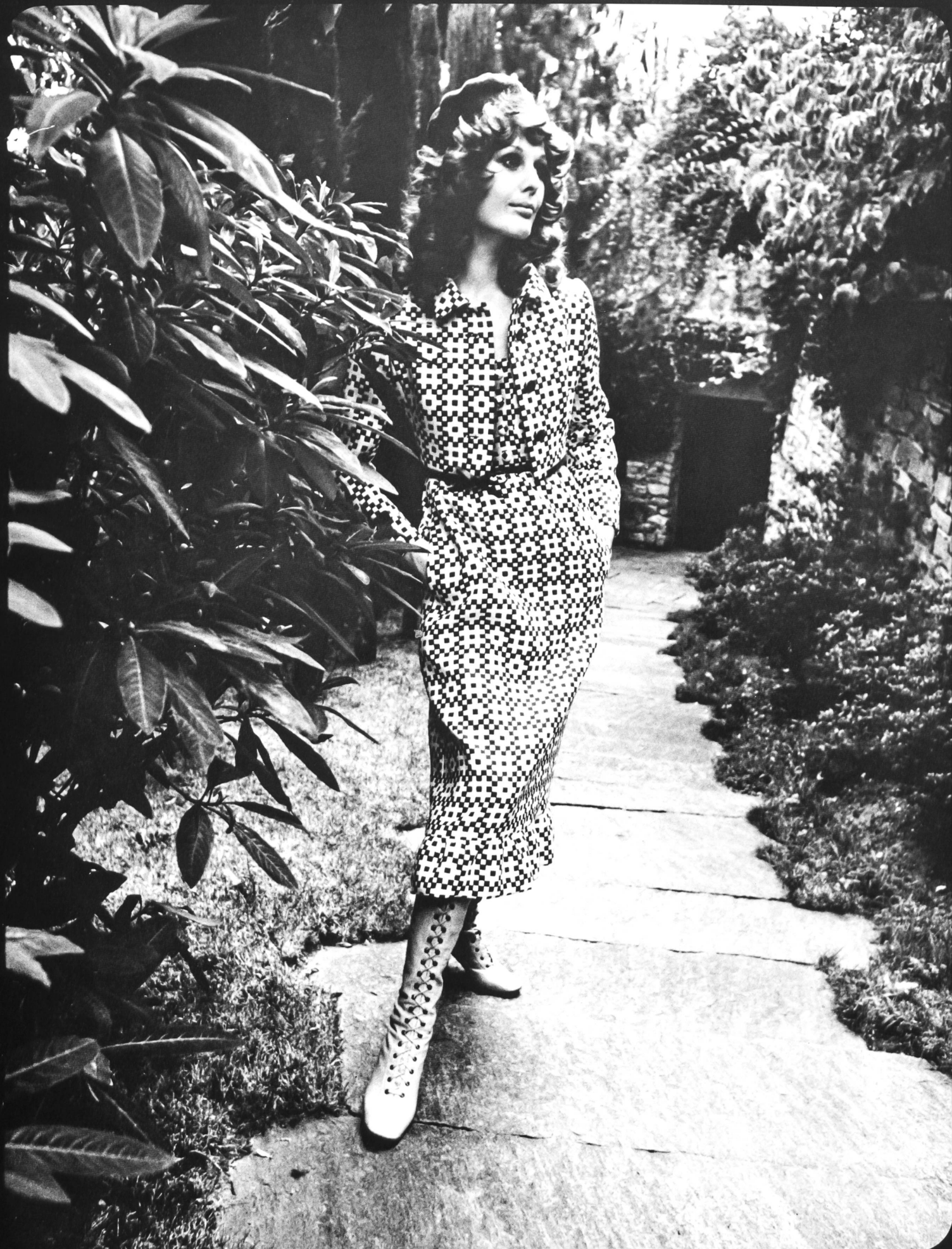
4 R. CAFADER & CO., ZÜRICH Élégant ensemble jeune: robe midi avec jaquette, en pur coton imprimé. (Tissu: L. Abraham & Cie Soieries S.A., Zurich)