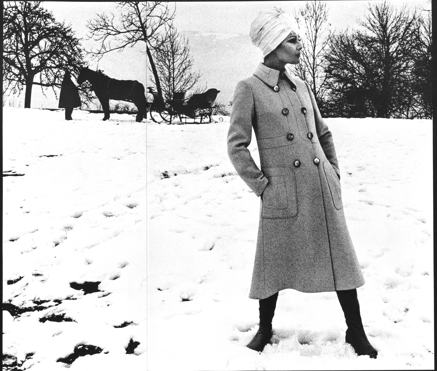
ARTHUR SCHIBLI S.A., GENÈVE Attractive, sporty looking midi-coat, in pure new wool.