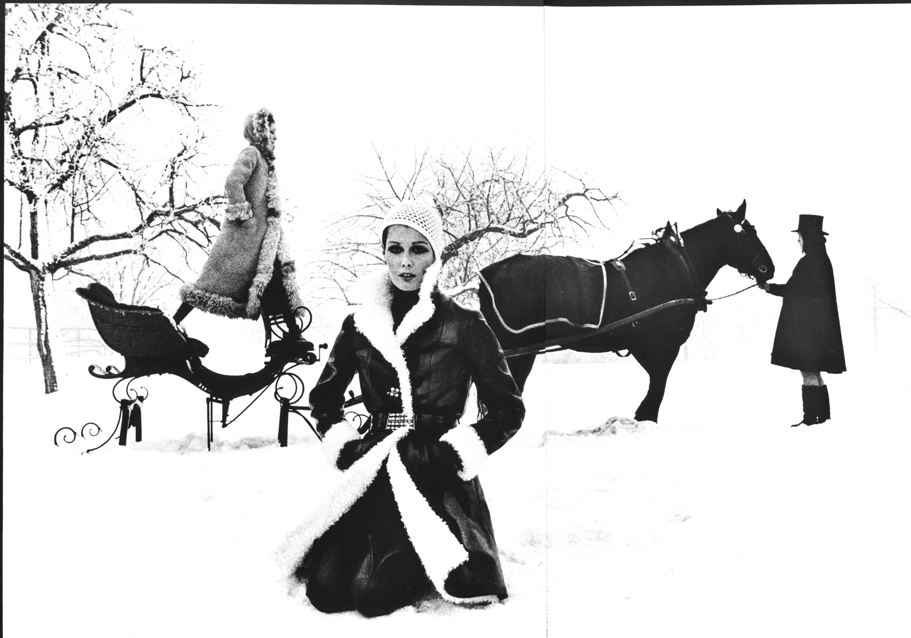
HEINZ KARASEK AG, ZÜRICH Left: Beige «bumpy» maxi-coat, in long curly-haired sheepskin, with hood. Right: Fashionable waisted sporty coat, in black wrinkled patent leather.