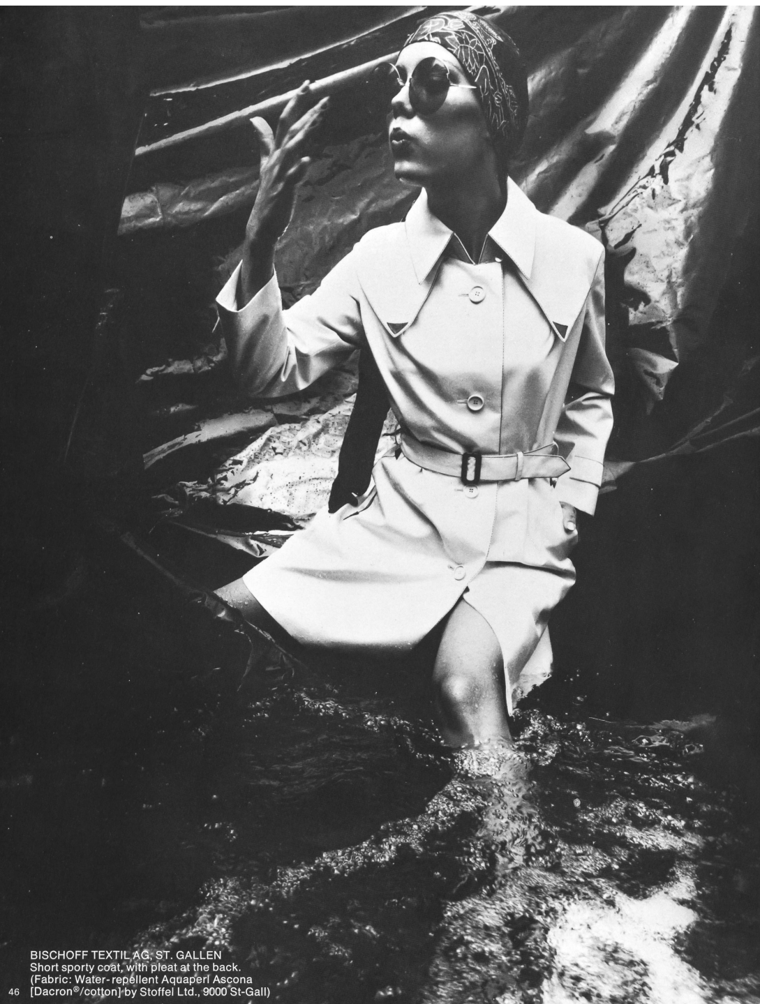
BISCHOFF TEXTIL AG, ST. GALLEN Short sporty coat, with pleat at the back. (Fabric: Water-repellent Aquaperl Ascona [Dacron®/cotton] by Stoffel Ltd., 9000 St-Gall)