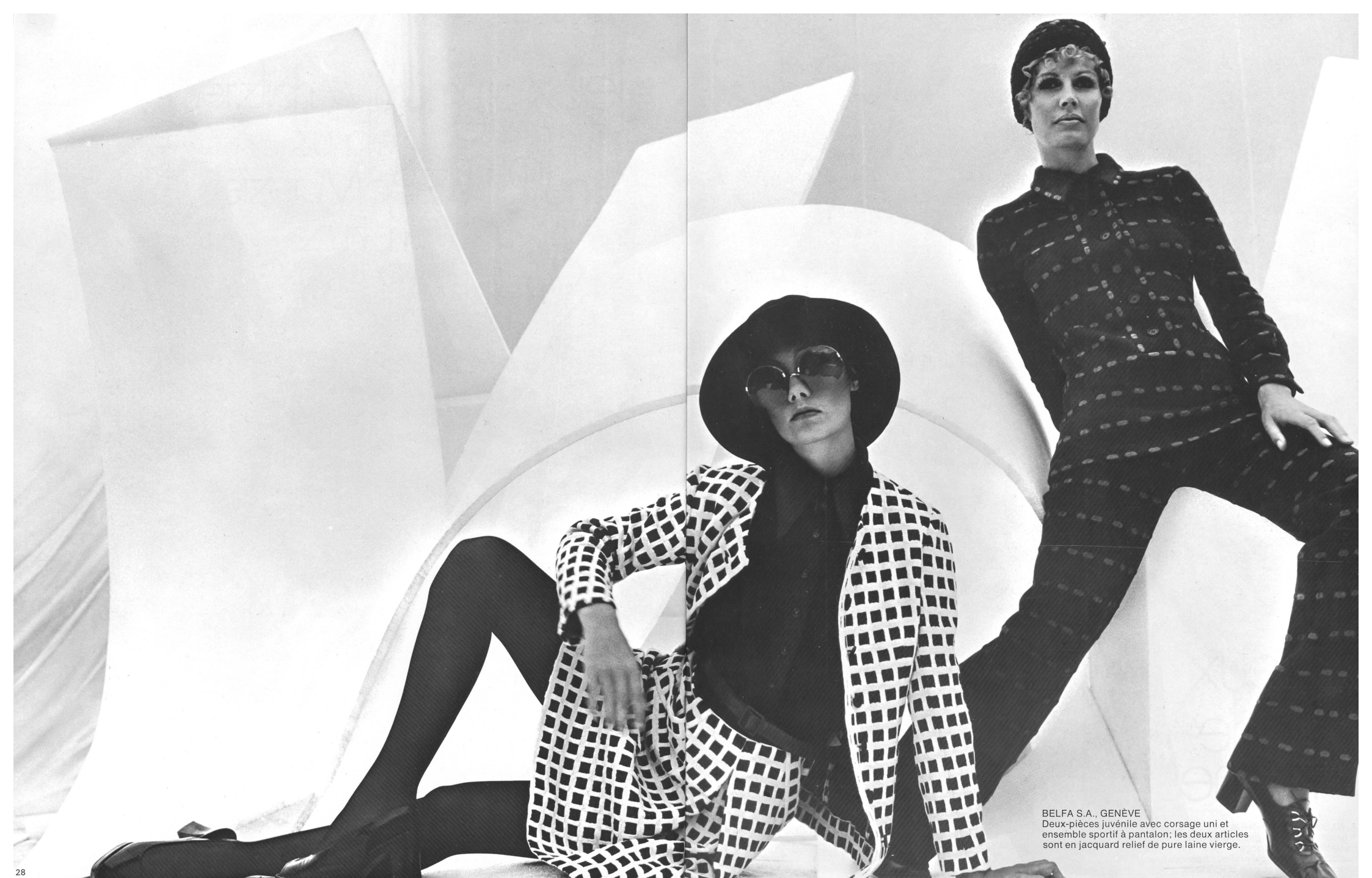
BELFA S.A., GENÈVE Deux-pièces juvénile avec corsage uni et ensemble sportif à pantalon; les deux articles sont en jacquard relief de pure laine vierge.