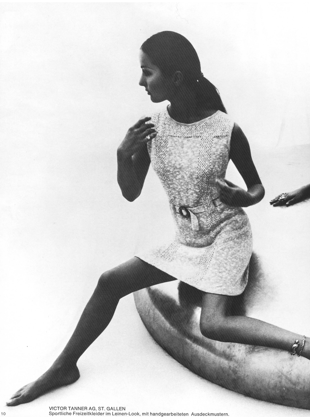
VICTOR TANNER AG, ST. GALLEN Sportliche Freizeitkleider im Leinen-Look, mit handgearbeiteten Ausdeckmustern.