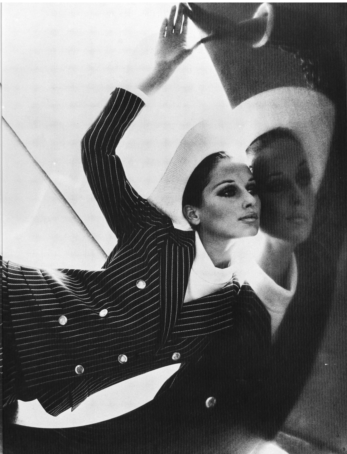
WIRKWARENFABRIK VOLLMOELLER AG, USTER Blazer-Kostüm in feinem Nadelstreifen, aus pflegeleichtem Conit-Baumwoll-Jersey; antaillierte Jacke mit hochgezogenem Revers und Vierfalten-Jupe.