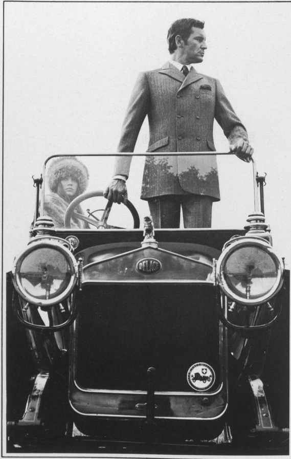
RITEX AG Zweireihiger Anzug mit schräggestellten Pattentaschen, modisch hochgestellter Knopfrönt und langgezogener Silhouette.