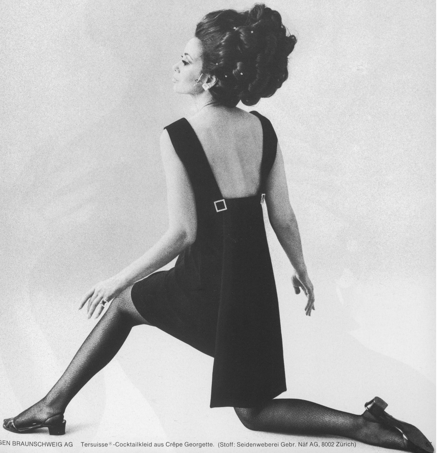
EUGEN BRAUNSCHWEIG AG Tersuisse®-Cocktailkleid aus Crêpe Georgette. (Stoff: Seidenweberei Gebr. Näf AG, 8002 Zürich)