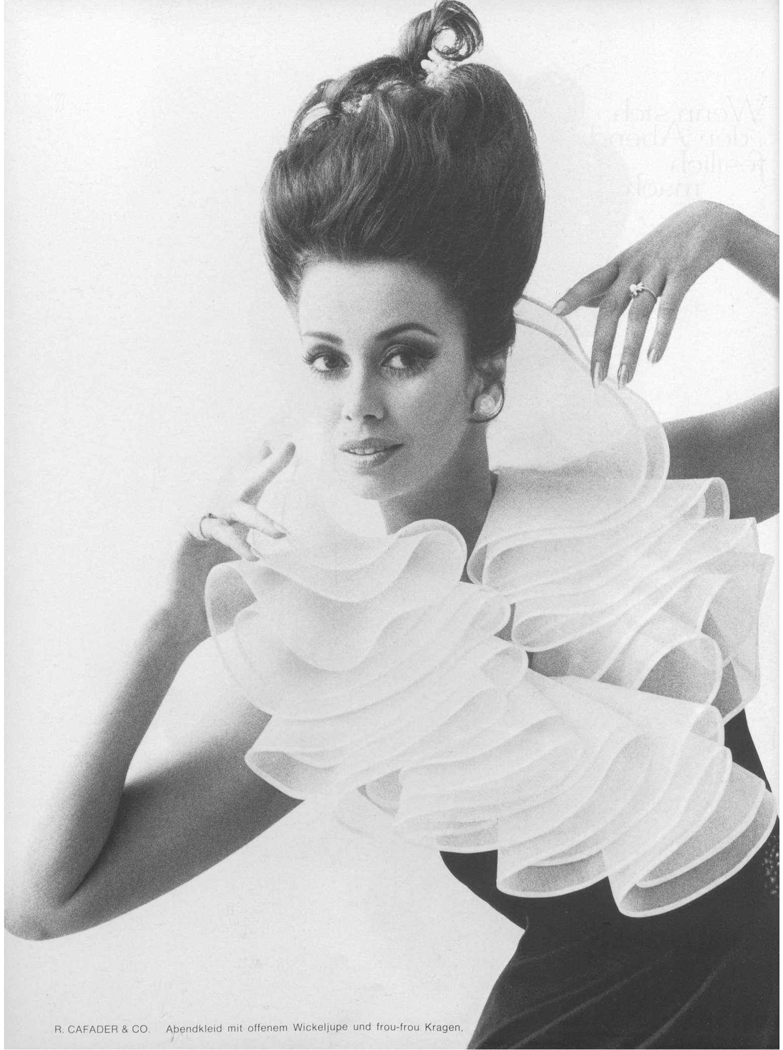
R. CAFADER & CO. Abendkleid mit offenem Wickeljupe und frou-frou Kragen.