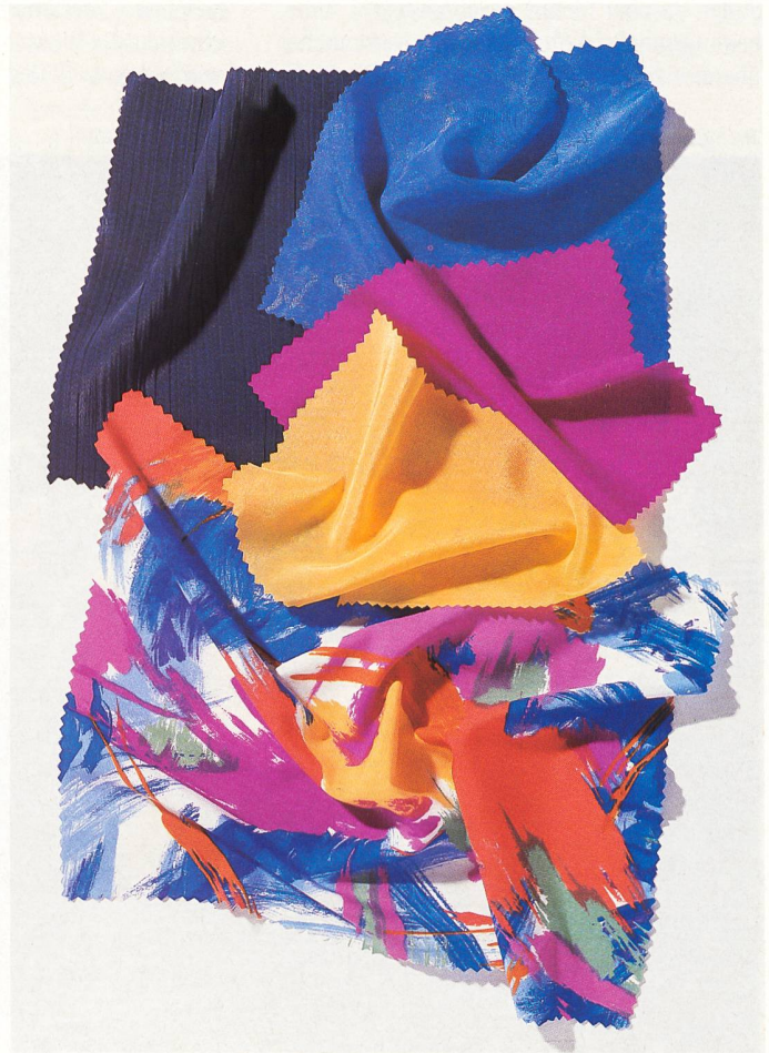
Setila-Microfaserqualitäten von Viscosuisse/Rhône-Poulenc.