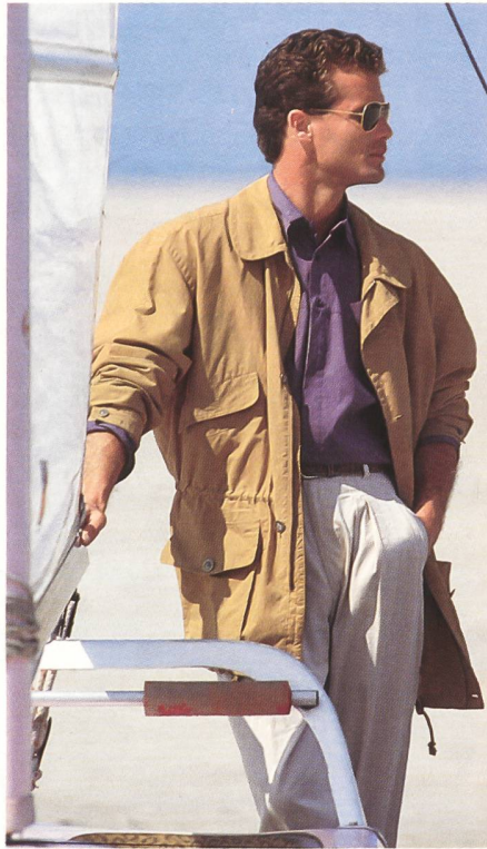
Microfaser Herren-Sportswear: Jacke aus Tactel-Gewebe. (Modell Brinkmann)

An der Wiege der Microfasern hat die Funktion gestanden: Sie waren spezielle Faserentwicklungen für Aktivsport- und Wetterbekleidung. Microfaserstoffe begaben sich damit in den Wettbewerb mit beschichteten klassischen Stofftypen oder mit Bekleidung, die zusätzlich mit Membranen ausgerüstet war. In diesem Feld hat die Microfaser ihren Markt längst gemacht. Die Fachleute streiten nur darüber, ob sie in diesem Marktsegment ihren Kulminationspunkt schon erreicht haben oder nicht. Mit dem Ausbruch der Microfaser aus der relativ kleinen Marktnische der Aktivsportbekleidung hinaus, hinein ins weite Feld der Street- und Fashion-Wear, beginnt jetzt ihr eigentlicher Siegeszug. Denn jetzt können die Microfasern neben ihren funktionellen auch ihre ästhetischen Vorzüge voll ausspielen: Leichtigkeit, seidige Optik, farbliche Brillanz, weicher Griff. Und dazu noch ihre Anpassungsfähigkeit in Partnerschaft mit anderen Faser-Provenienzen. Damit bieten Microfasern nicht nur verblüffend perfekte Nachahmungen selten und teuer gewordener Naturfasern wie etwa Seide oder Ersatz für womöglich reklamationsanfällige Viscose. Ihre Herkunft aus der Retorte gewährleistet den Herstellerstufen darüber hinaus gleichmässige Verarbeitungsmöglichkeiten, dem Endverbraucher überdies zusätzliche wichtige Produktvorteile,