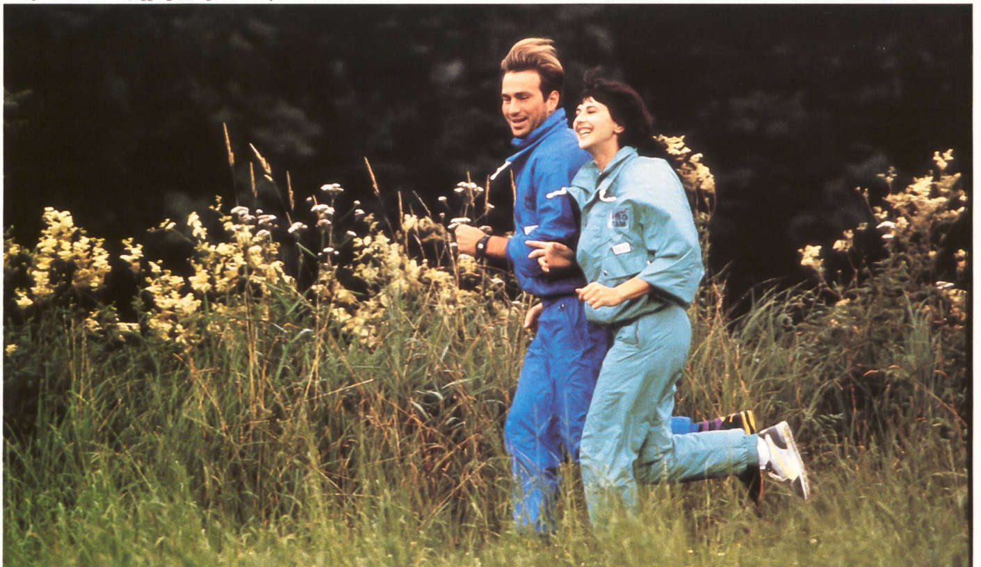
Microfaser Funktion: Jogging-Anzüge aus Meryl-Gewebe. (Modelle Redstar)

Symptomatisch für die Lage ist, wie wenig (ausser eher werblichen Aussagen) Informationsmaterial über Microfasern derzeit am Markt ist und dass erst jetzt viele Hersteller ihre Marken- und Markennamen-Politik neu überdenken, damit unterschiedliche Microfaser-Produkte durch klarere Definition und Namensgebung schärfere Kontur – innerhalb