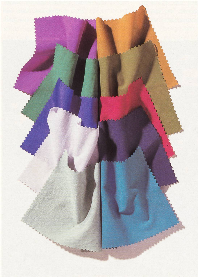
Entwicklungen der Rotofil, Zürich, aus Tactel-Microfasern der ICI.