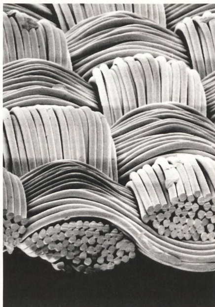
Meryl in Kette und Schuss. Grossvergrößerung.

S eit knapp drei Jahren beginnt die dritte Chemiefaser-Generation den Markt zu revolutionieren: die Microfasern. Für den breiten Konsum bringen sie neue funktionelle und ästhetische Dimensionen: Leichtigkeit, Feinheit, funktionelle Vorzüge, wie sie bislang nicht oder nur bei sehr teuren Stoffen möglich waren. Luxus plus Pflegeleichtigkeit. Microfasern stecken derzeit in der Phase beginnender Marktdurchdringung. Und schon boomt die Nachfrage derart, dass allenthalben Lieferengpässe auftreten. Aber Microfasern sind weit mehr als eine vorübergehende Moderscheinung. Fachleute sehen in ihnen die Faser der 90er Jahre, die jetzt schon auf der hochalpinen Skipiste genauso zu Hause ist wie demnächst auch auf der Strasse oder im Ballsaal. Schweizer Faserhersteller, Texturierer und Weber mischen bei der Entwicklung kräftig mit.