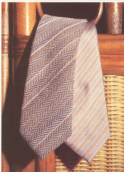
Hochwertige, reinseidene Qualität aus der Kollektion Weisbrod-Zürrer AG, Hausen a. A.