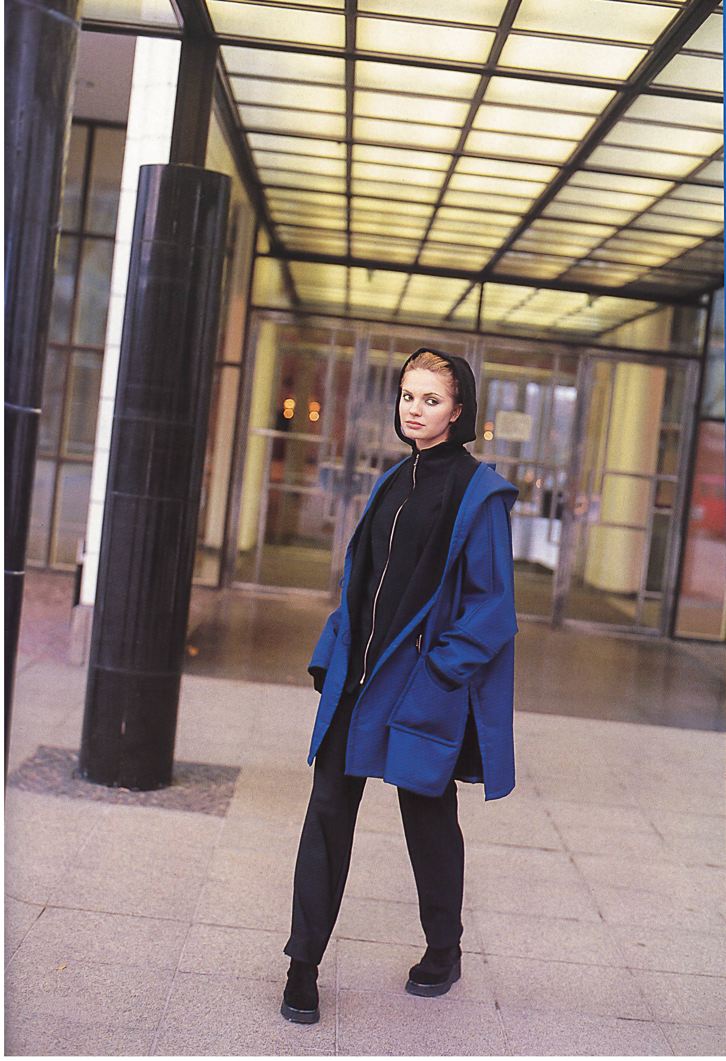
IRIS AALTO Kurzmantel aus Polyester/Polyamid mit flauschiger Abseite über Jacke und Hose aus Stretchjersey, beide Stoffe von ESCHLER