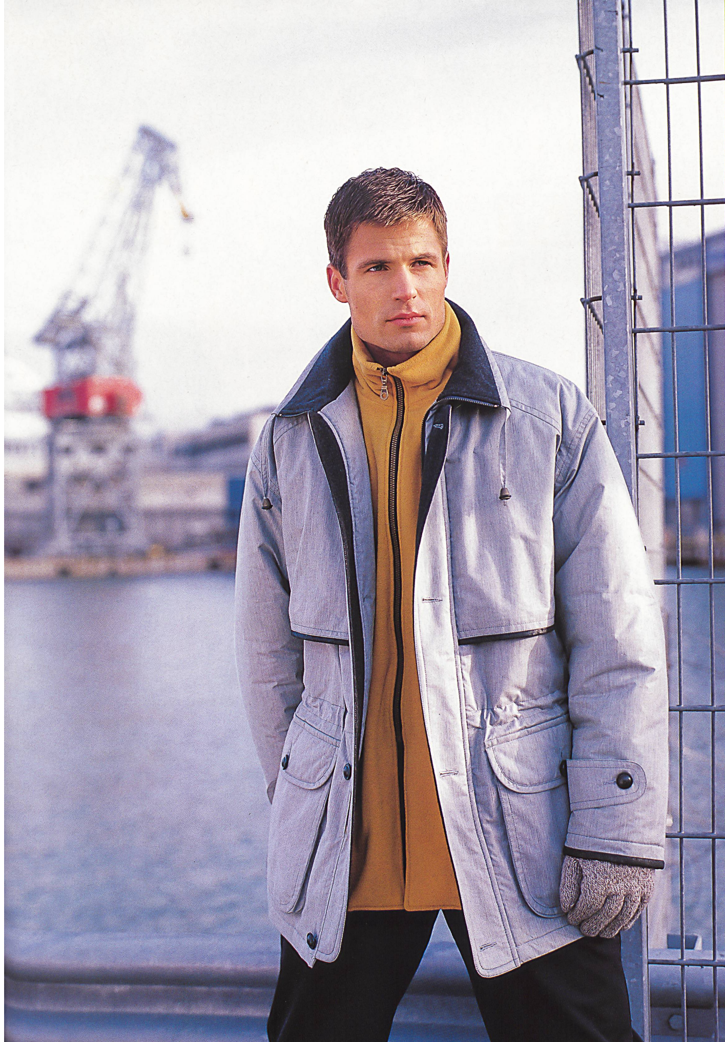
JUHA ARHI für ORATOP Sportliche Jacke mit funktionellen Details aus Fil-à-fil in Baumwolle/Polyamid von HAUSAMMANN+MOOS, wärmende Unterjacke aus Husky Velours von ESCHLER