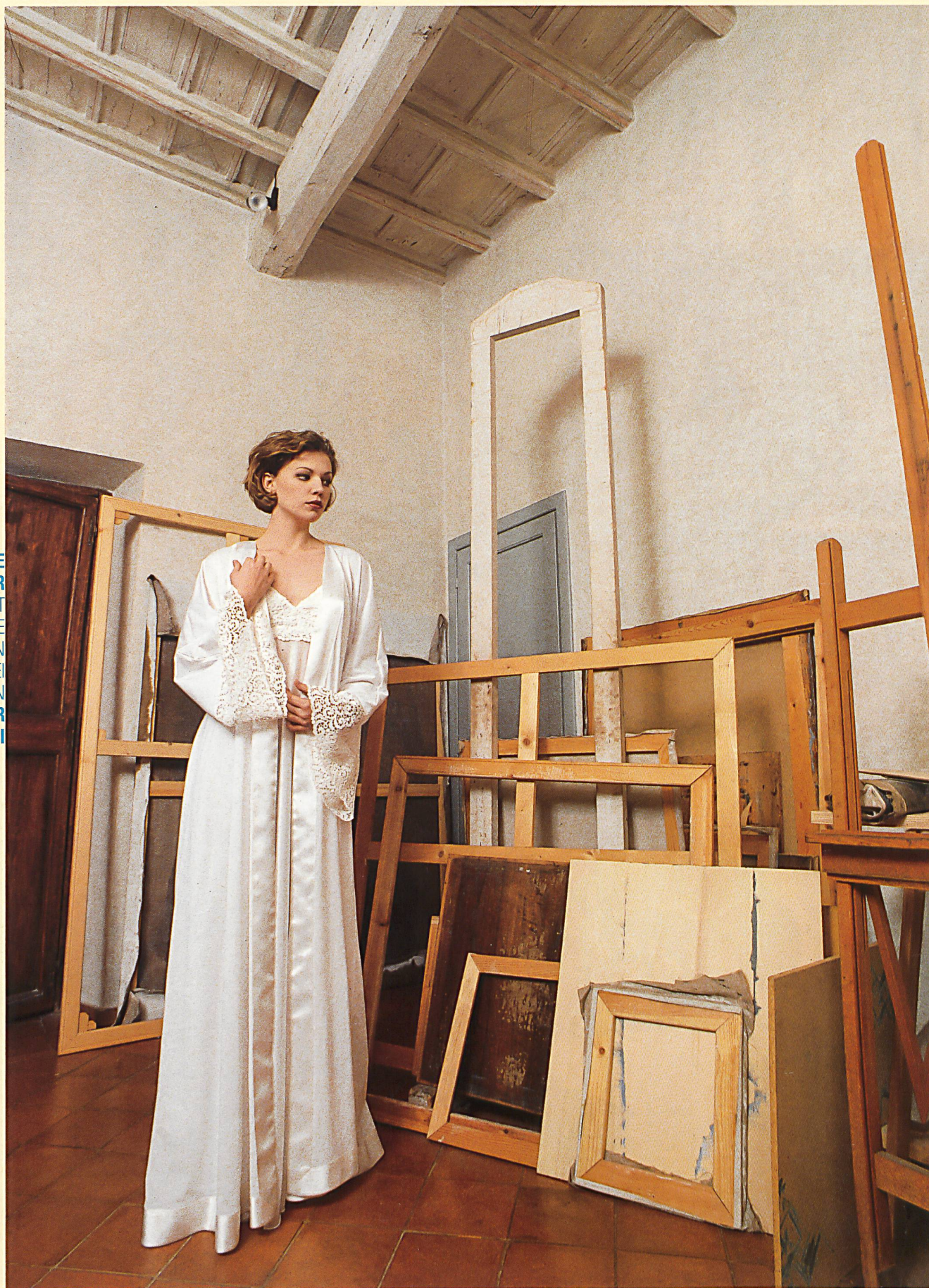
GRACE PEAR MIT BORDÜRE IN ÄTZSTICKEREI VON FORSTER WILLI