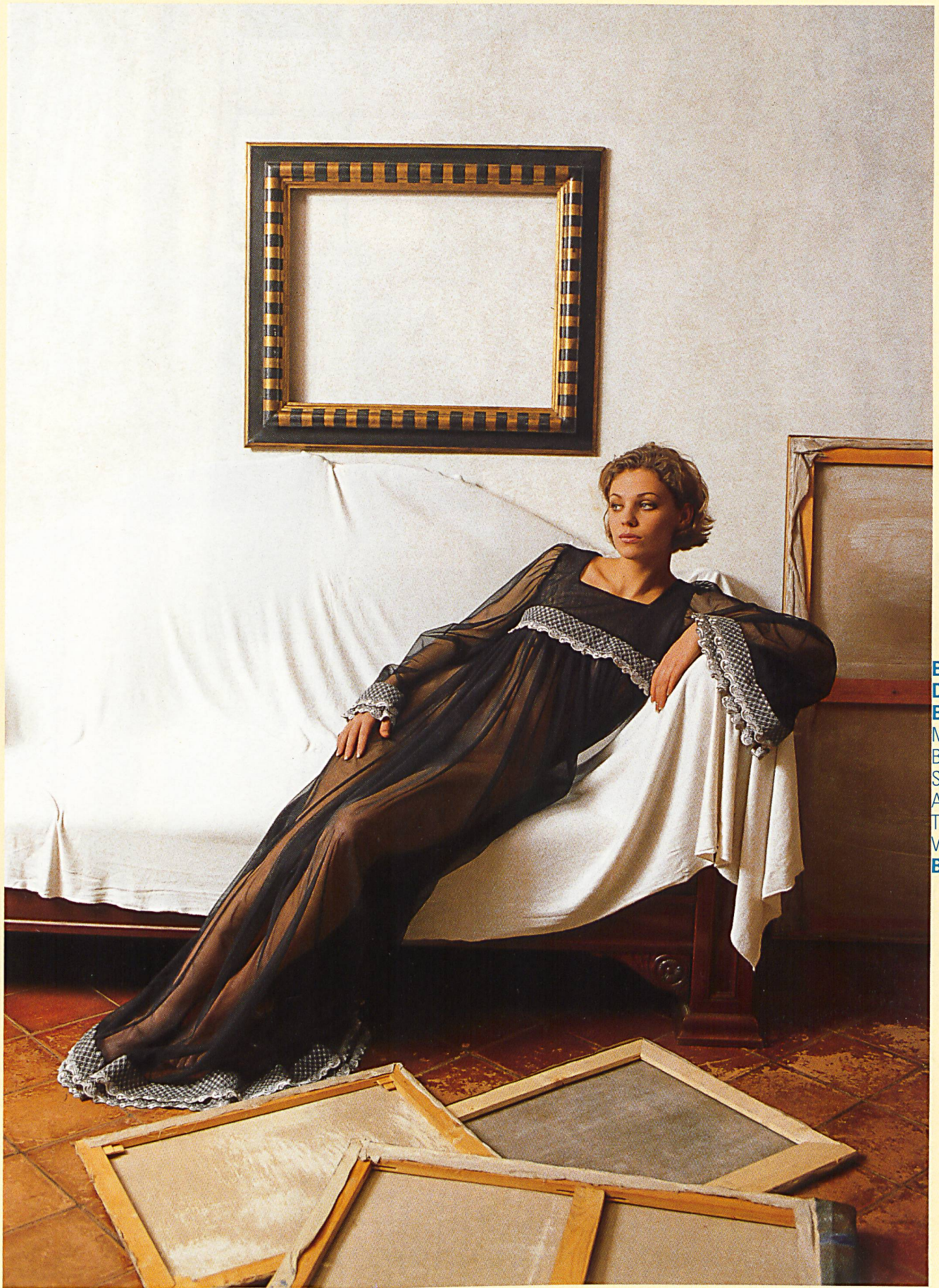
BAIANO DI BELFIORE MIT BORDÜREN- STICKEREI AUF TÜLL VON BISCHOFF