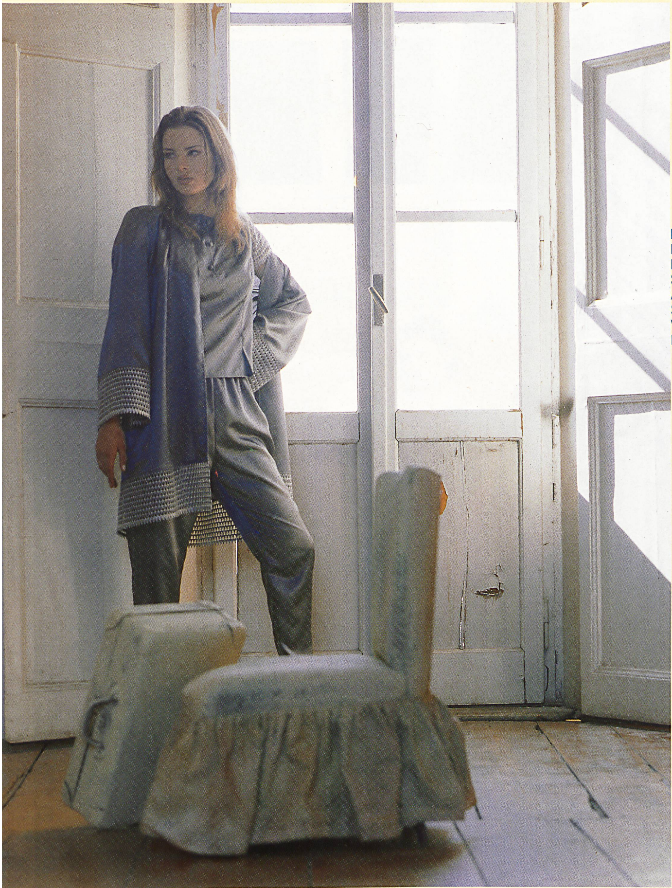
BANDINI MIT BORDÜREN- STICKEREI AUF SATIN VON BISCHOFF