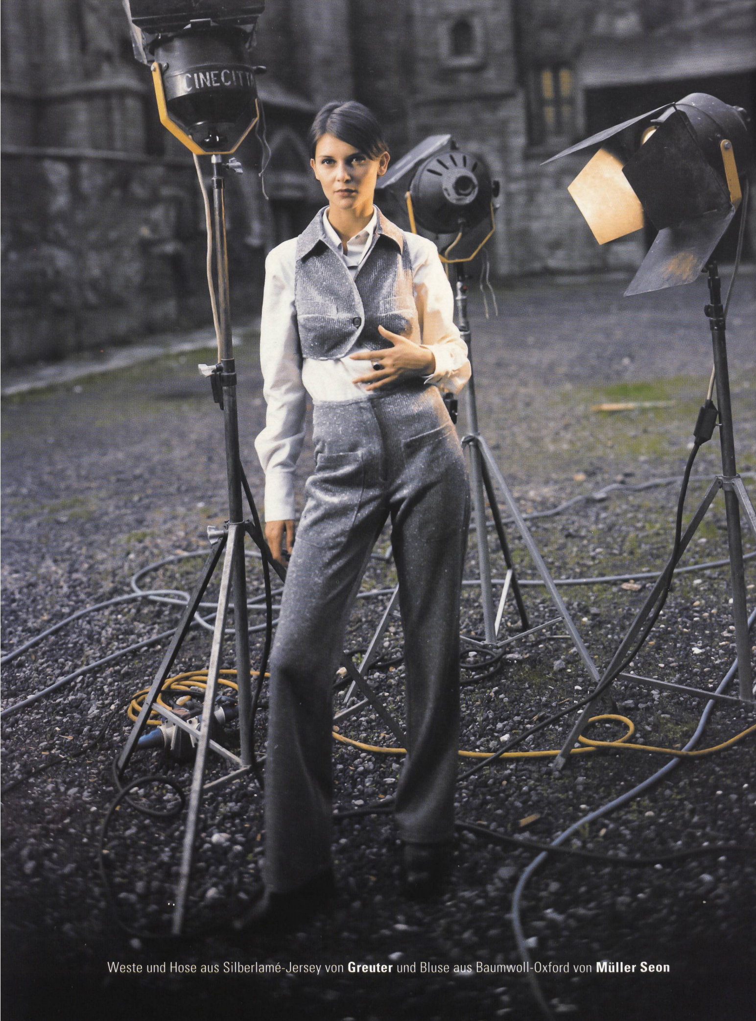
Weste und Hose aus Silberlamé-Jersey von Greuter und Bluse aus Baumwoll-Oxford von Müller Seon