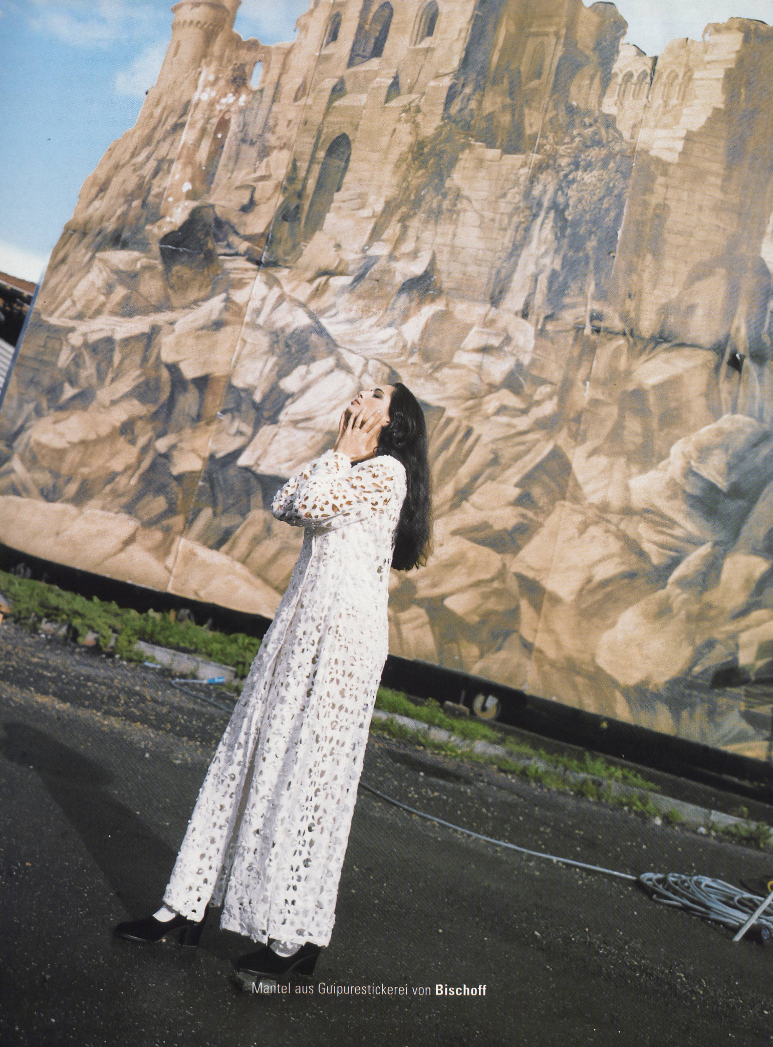
Mantel aus Guipurestickerei von Bischoff