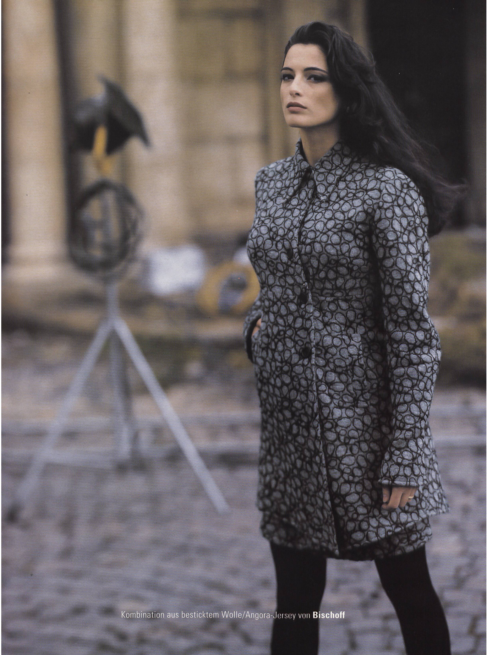
Kombination aus besticktem Wolle/Angora-Jersey von Bischoff