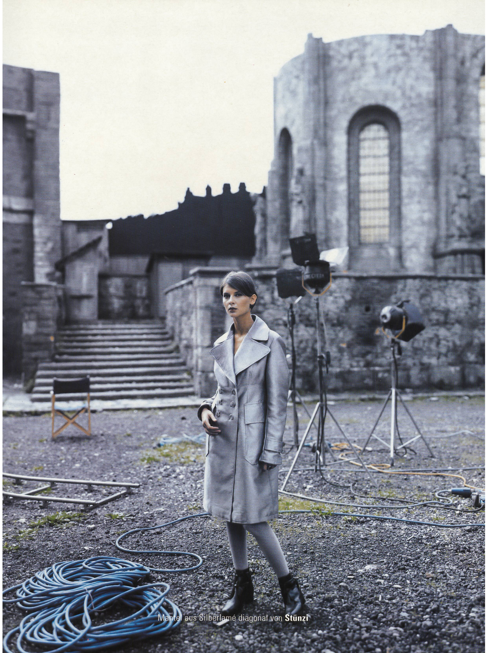
Mantel aus Silberlamé diagonal von Stünzi