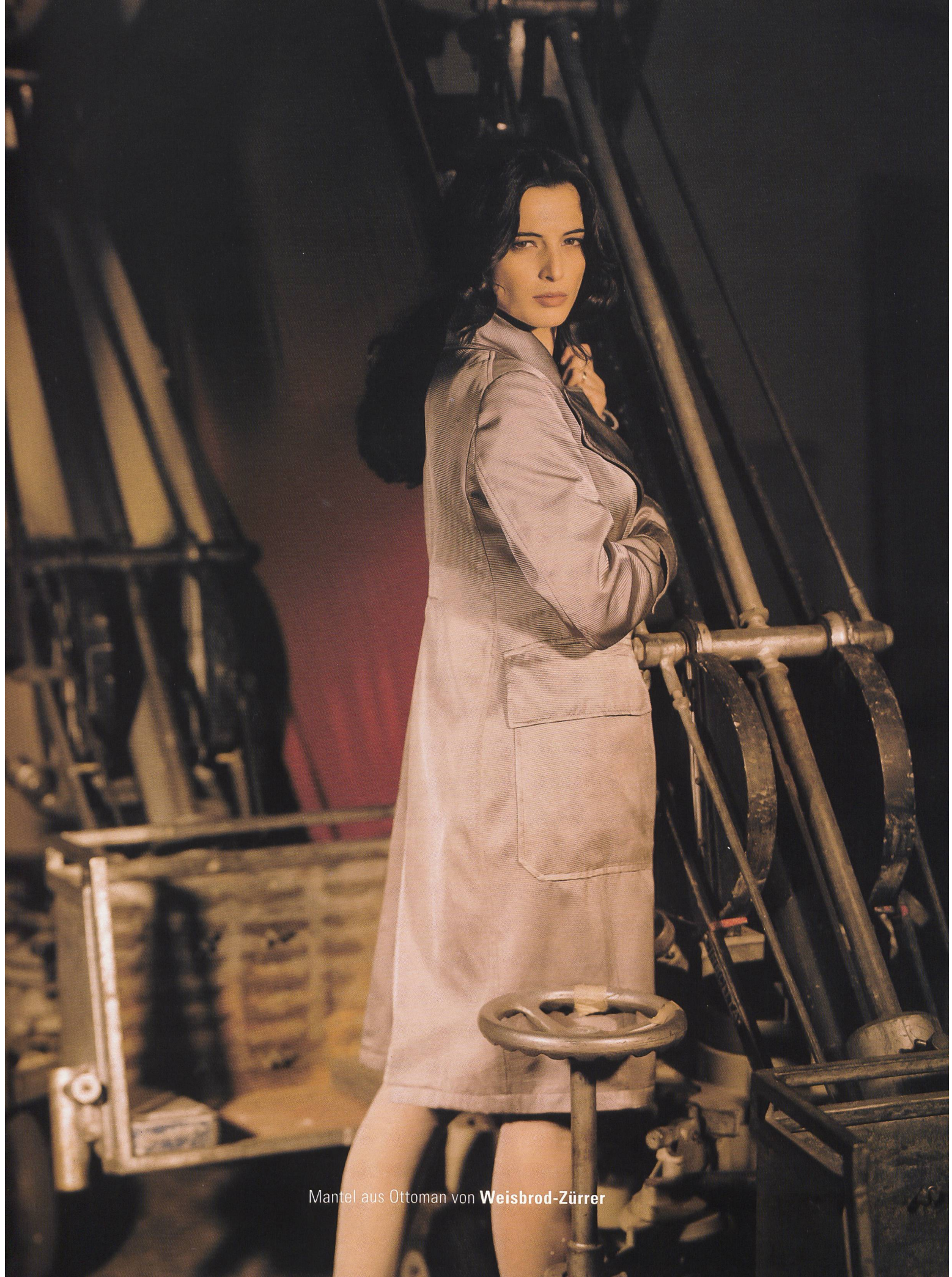
Mantel aus Ottoman von Weisbrod-Zürer