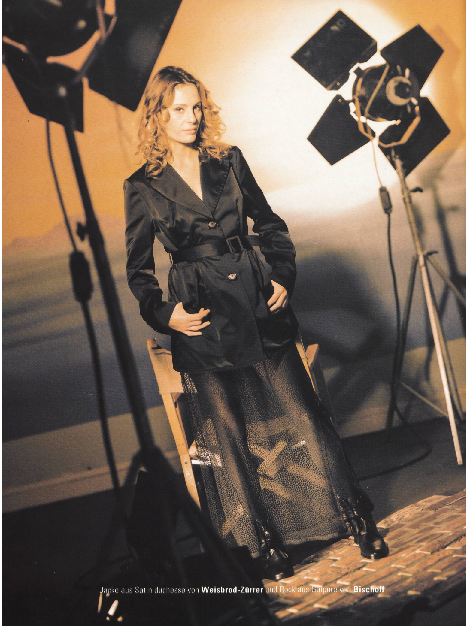
Jacke aus Satin duchesse von Weisbrod-Zürer und Rock aus Guipure von Bischoff