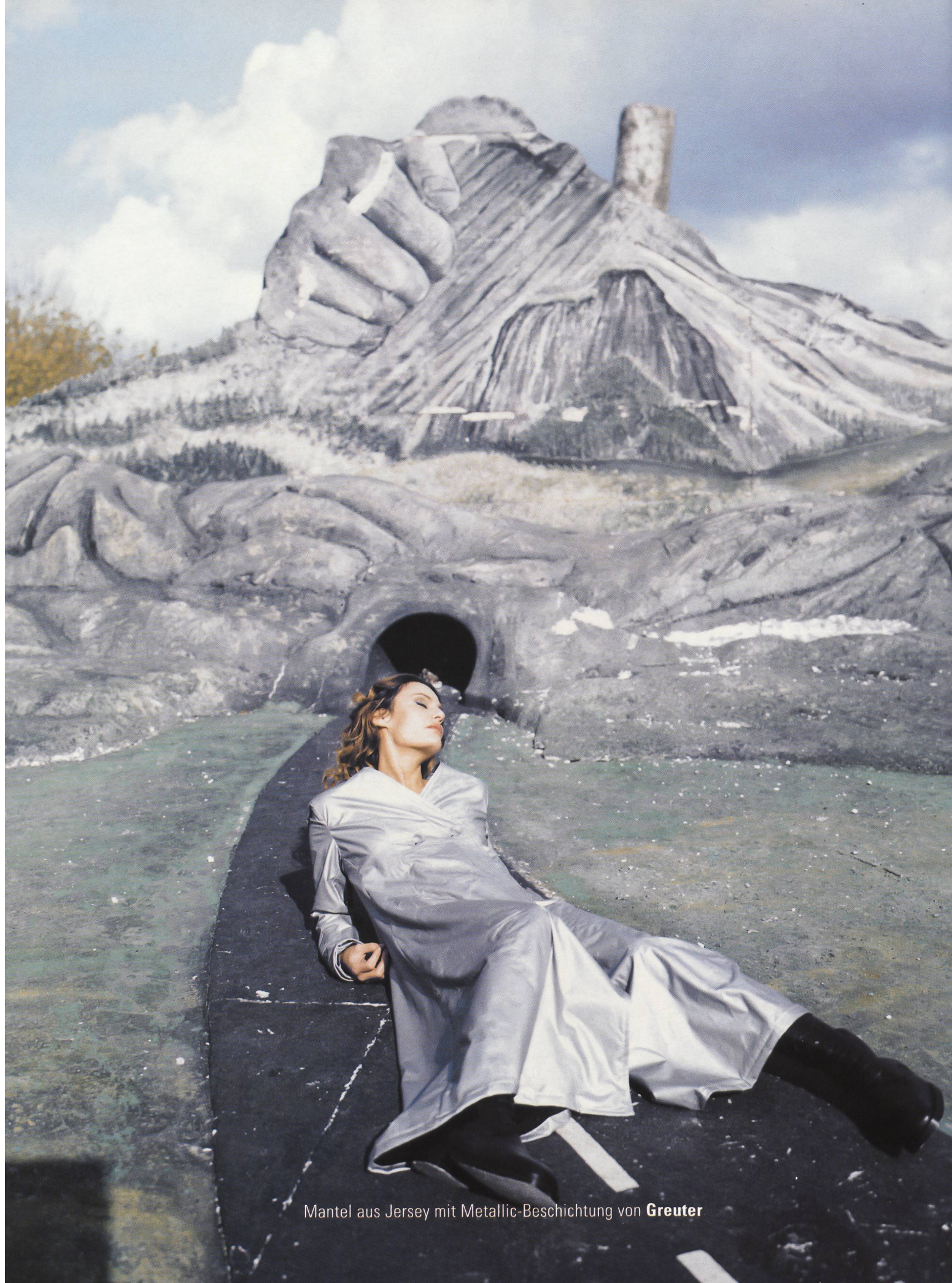
Mantel aus Jersey mit Metallic-Beschichtung von Greuter