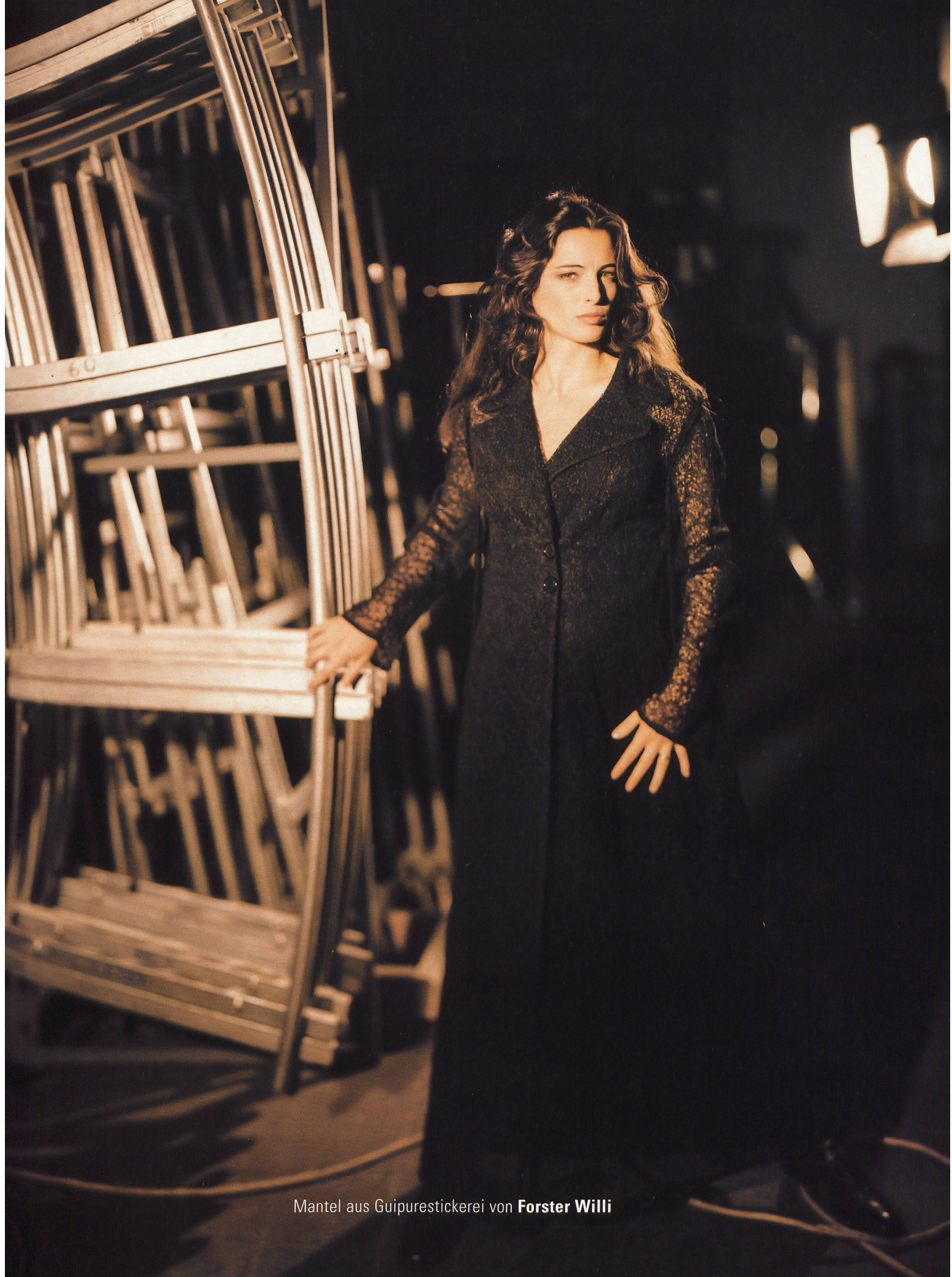
Mantel aus Guipurestickerei von Forster Willi