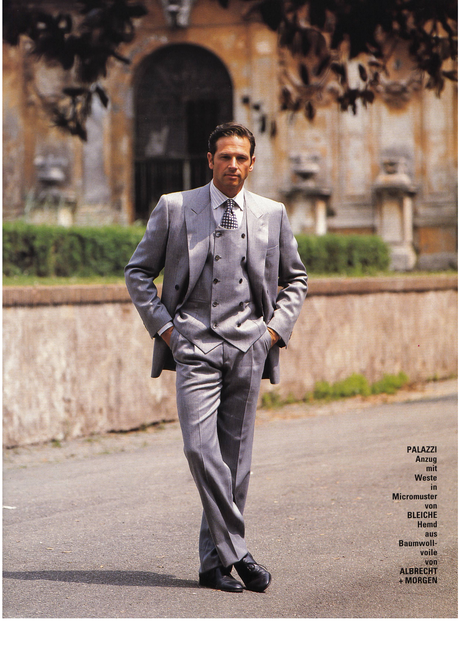
PALAZZI Anzug mit Weste in Micromuster von BLEICHE Hemd aus Baumwoll- voile von ALBRECHT + MORGEN