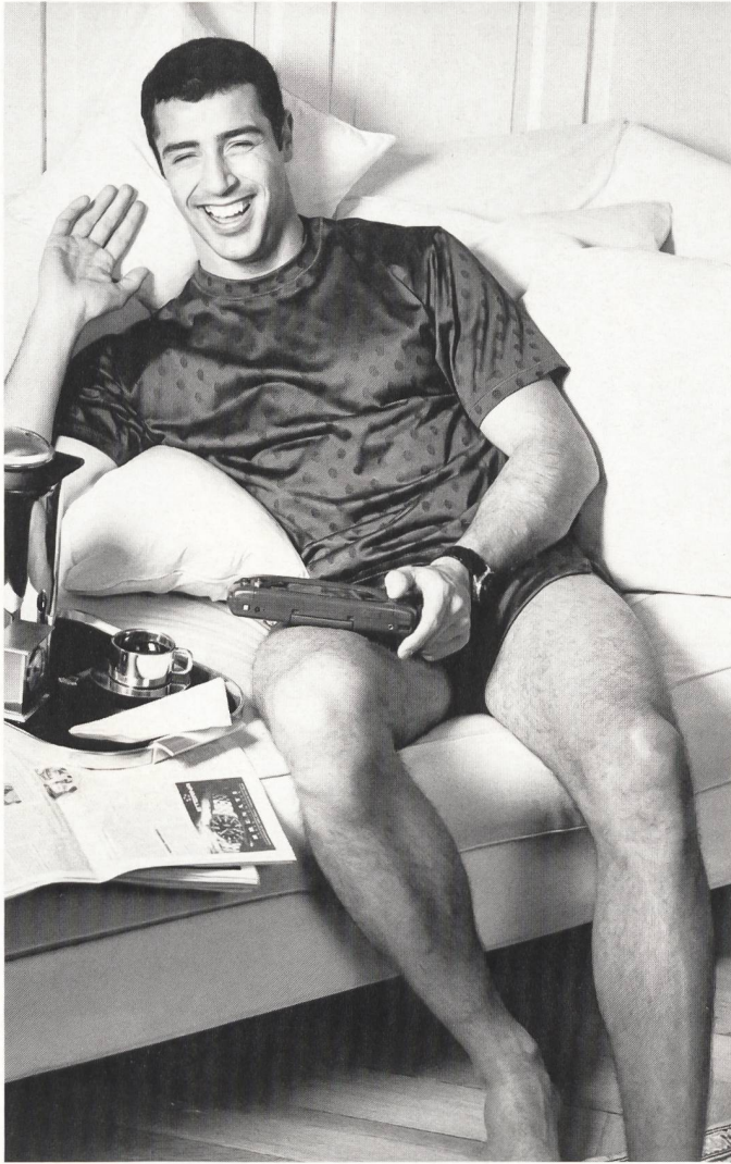
Greuter-Jersey AG, Sulgen Top und Shorts aus feinem Jacquardjersey in reiner Baumwolle von Hanro.