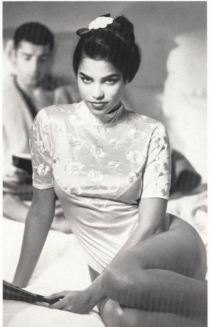
Naef Nüesch AG, Heerbrugg Glanzgarn-Plattstich-Stickerei auf seidig schimmerndem Jersey am Body von Ripcosa.