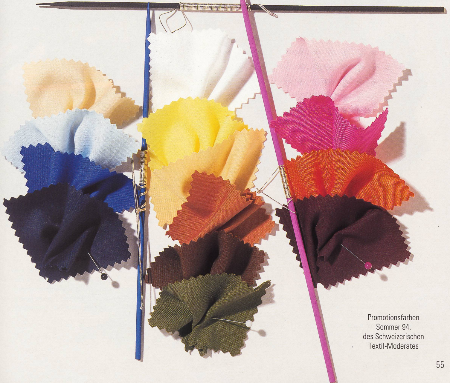
Promotionsfarben Sommer 94, des Schweizerischen Textil-Moderates

„Paradise Lost“ macht sich auf die Suche nach den verlorenen Paradiesen dieser Erde... und begegnet fremden Kulturen in Indien, Ägypten und exotischen Gefilden, hüllt sich in Seide und Transparenz in Violett - Rosé - Orange - Grün und einem Hauch von Gold.