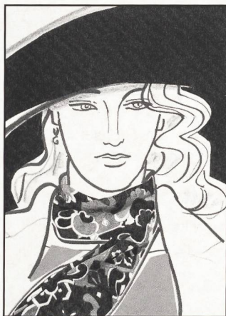
Titelbildgestaltung von Mouchy mit Stoffen von Hausamann + Moos

Avenue de l'Avant-Poste 4 Case postale 1128 CH-1001 Lausanne Tel. 021 23 18 24 Redaktion, Werbung, Abonnements