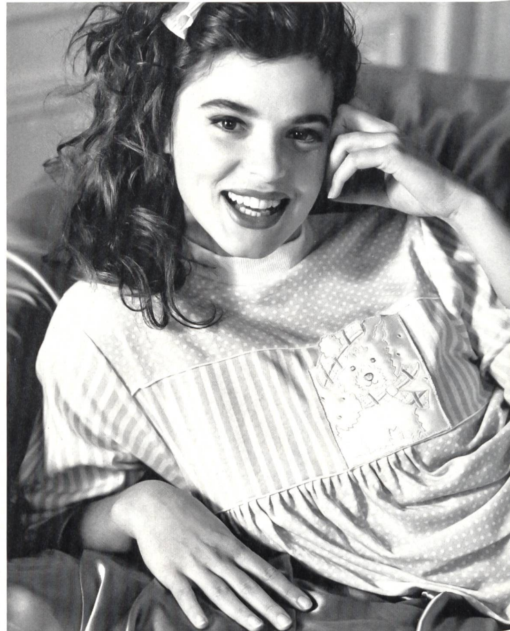
Jacob Rohner AG, Rebstein Big Shirt aus Jersey zum Schlafen und Faulenzen, mit appliziertem Stickereimotiv. Modell Calida