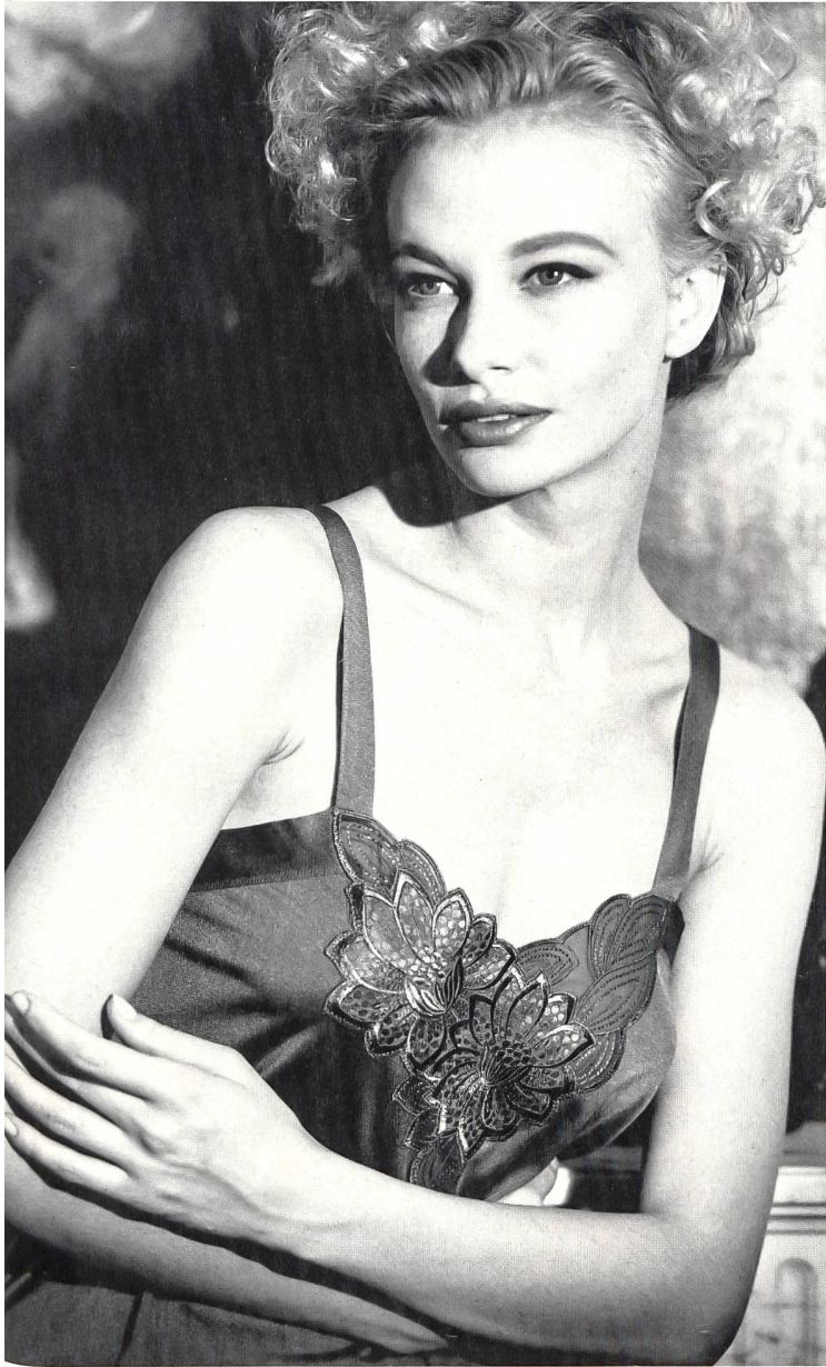
Naef Nüesch AG, Flawil Gesticktes Motiv auf Polyester-Georgette mit Jacquard-Applikation für das Hemdchen-Top. Modell Mey