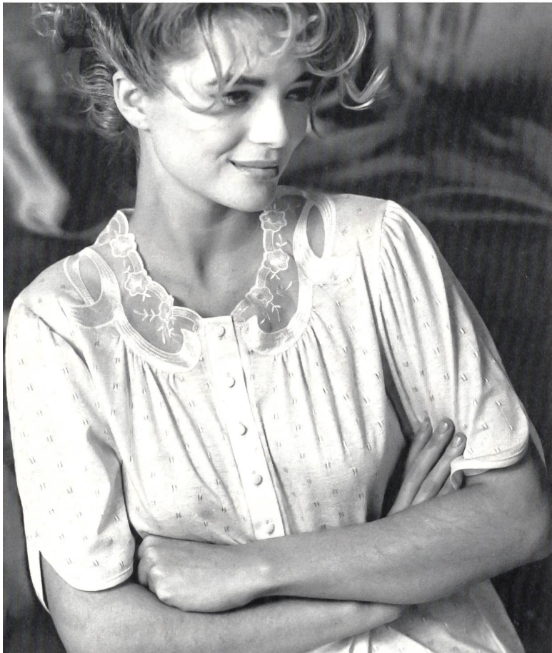
Greuter Jersey AG, Sulgen Nacht Kleid im Romantik-Look aus feingemustertem mercerisiertem Baumwolljersey. Modell Triumph