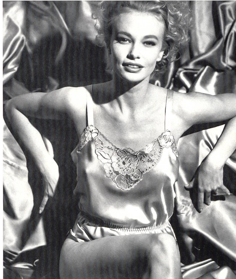
Forster Willi + Co. AG, St. Gallen Aufwendiger Stickerei-Einsatz mit Satinapplikationen auf Tüll für ein Seiden-Top. Modell Sawaco