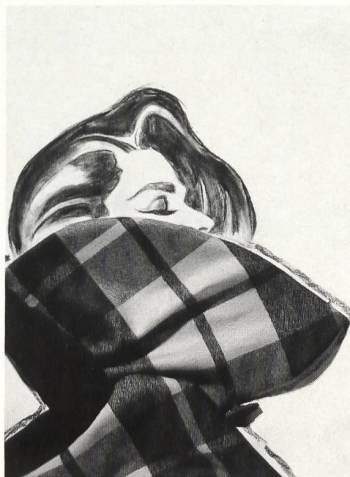
Titelbildgestaltung von Ursula Rodel mit Stoffen von Bleiche AG, Zofingen