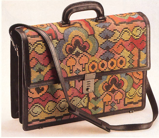
Aktenmappe mit Schulterriemen