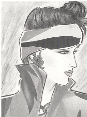
Titelbildgestaltung von Ursula Rodel mit Stoffen von Christian Fischbacher Co. AG St. Gallen