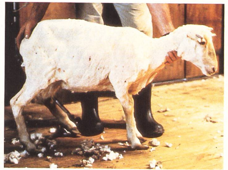
Ein frisch geschorenes Schaf.

Tonnen pro Jahr (Halbjahresschur) ist diese Produktion zwar relativ gering und macht nur einen Bruchteil der vom Schweizer Wollhandel bewegten Kapazitäten aus. Die Zusammenarbeit garantiert den Schweizer Schafzüchtern indes eine gesicherte Abnahme (zu Weltmarktpreisen); andererseits hat der Schweizer Wollhandel keine Probleme, Schweizer Wolle in den Markt zu bringen; die meist weisse und körnige Qualität wird für Handstrickgarne, Füllung von Steppdecken, zu Streichgarnqualitäten, unter Beimischung anderer Wollen aber auch zu Kammzügen verarbeitet.