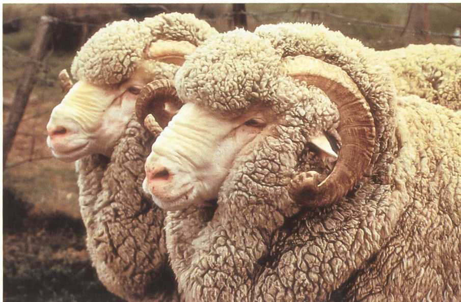
Drei Viertel der in Australien lebenden Schafe sind Merinos.

Mit Textil hat die Geschichte der modernen Industrialisierung begonnen; Textilien, speziell Wolltextilien, machten auch den Vorreiter für die Spezialisierung, das arbeitsteilige Produzieren in der Wirtschaft. Erst über viele Stufen Arbeit – Wollwäscherei und Kämmerei, Kammgarn- und Streichgarn-Spinnerei, Weberei sowie Ausrüstung und Färberei – entsteht der Stoff, aus dem ein Kleid oder ein Anzug ist. Weit weg vom Endverbraucher, sehr nah am Schaf arbeitet dabei eine Textilsparte, über die selbst Brancheninsider nur wenig Konkretes wissen: Der Wollhandel. Die Schweizer Wollhändler sind wichtige Partner für ihre einheimische Textilindustrie und darüber hinaus Lieferanten für viele Spinnereien weltweit. Wenn ihr Arbeitsfeld auch auf den ersten Blick begrenzt erscheint, so setzt Erfolg im Wollgeschäft globale Information, Gespür für politische und wirtschaftliche Entwicklungen, viel Erfahrung und letztlich auch das Glück des Tüchtigen voraus – Know how, das womöglich umfassender sein muss als in anderen Stufen der textilen Pipeline.