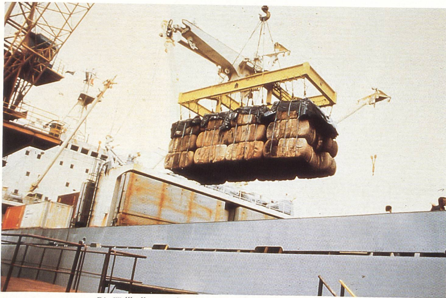
Die Wollballen werden per Kran auf das Frachtschiff befördert.

Aber exakt diese Vielfalt von Risiken, die jenseits von Charts und Computerprogrammen über die umfassende Information hinaus Erfahrung und Gespür für mögliche Marktentwicklungen verlangen, sind letztlich die Überlebenschance der Schweizer Wollhändler; sonst würde das Geschäft allein vom Big Money bestimmt. Natürlich wissen sie: die Konzentration wird fortschreiten – vor allem zugunsten flächendeckend operierender grosser Finanzgruppen im Rohstoffhandel; womöglich werden auch die grossen Naturfasererzeuger den Weg der Chemiefaserhersteller gehen und ihre Produkte zunehmend selbst vermarkten; vielleicht besteht auch ein Trend zu mehr vertikaler Organisation des Geschäfts.