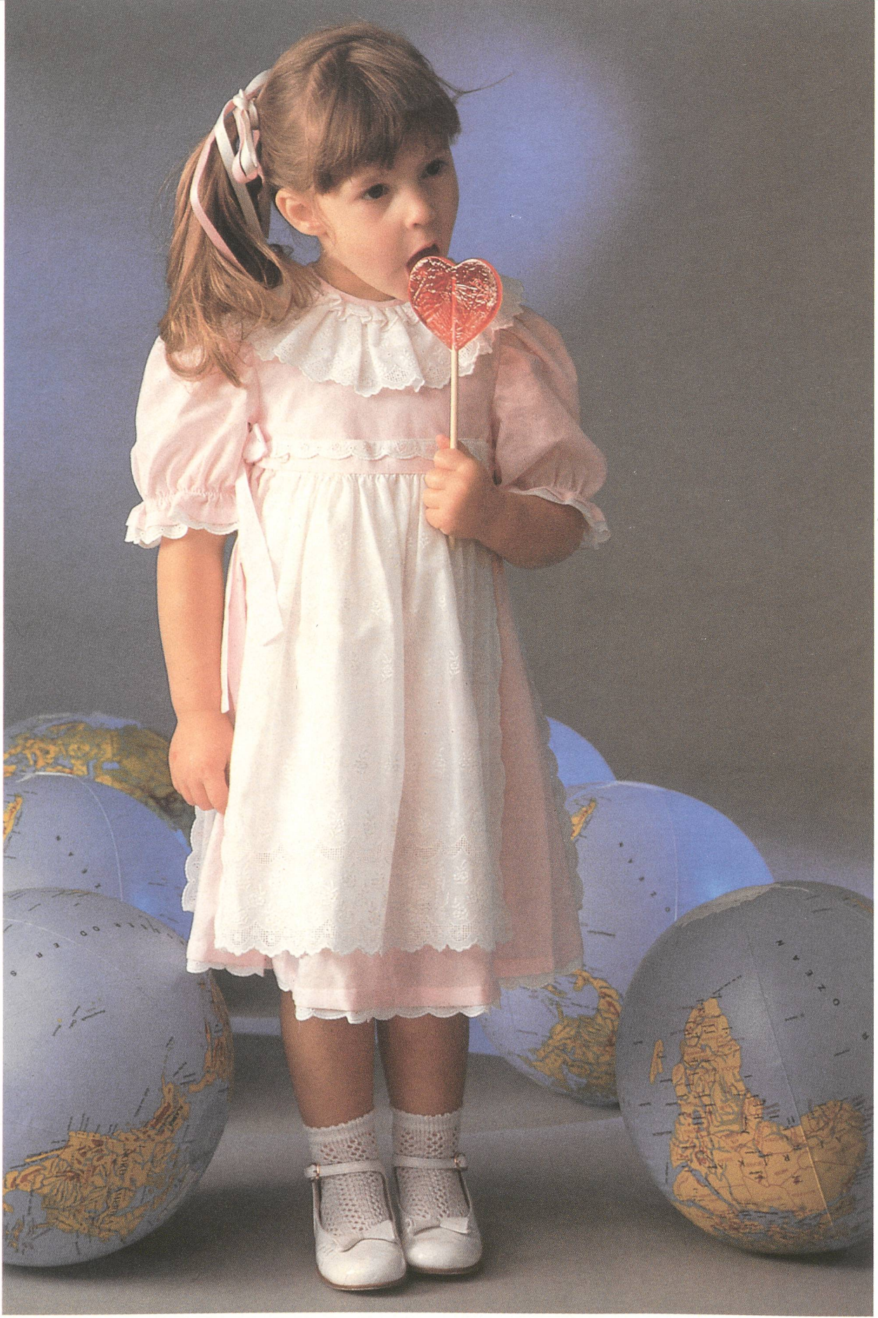
Willy Jenny AG, St. Gallen · Kleid aus Baumwollbatist mit reichbesticktem Kragen und Stickereischürze. Modell Carina.