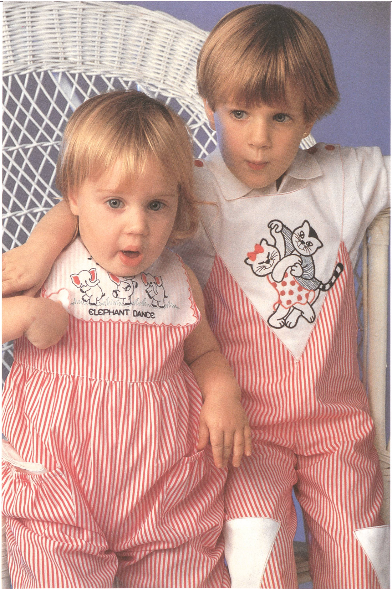
Bischoff Textil AG, St. Gallen · Farmerhose und Jumpsuit mit Piquémotiv und Kunstseidenstickerei. Modelle Sting.