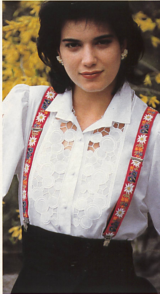
▷ ALTOCO AG, ST. GALLEN Stark durchbro- chene Guipure auf Baumwoll-Voile ist blickfangend in- krustiert auf Front und Ärmeln / Le regard est attiré sur le devant et les manches par une généreuse guipure incrustée en voile de coton / Elabo- rate open-work guipure on cotton voile as eyecatch- ing inserts on front and sleeves. Mod. Rustica of Switzerland