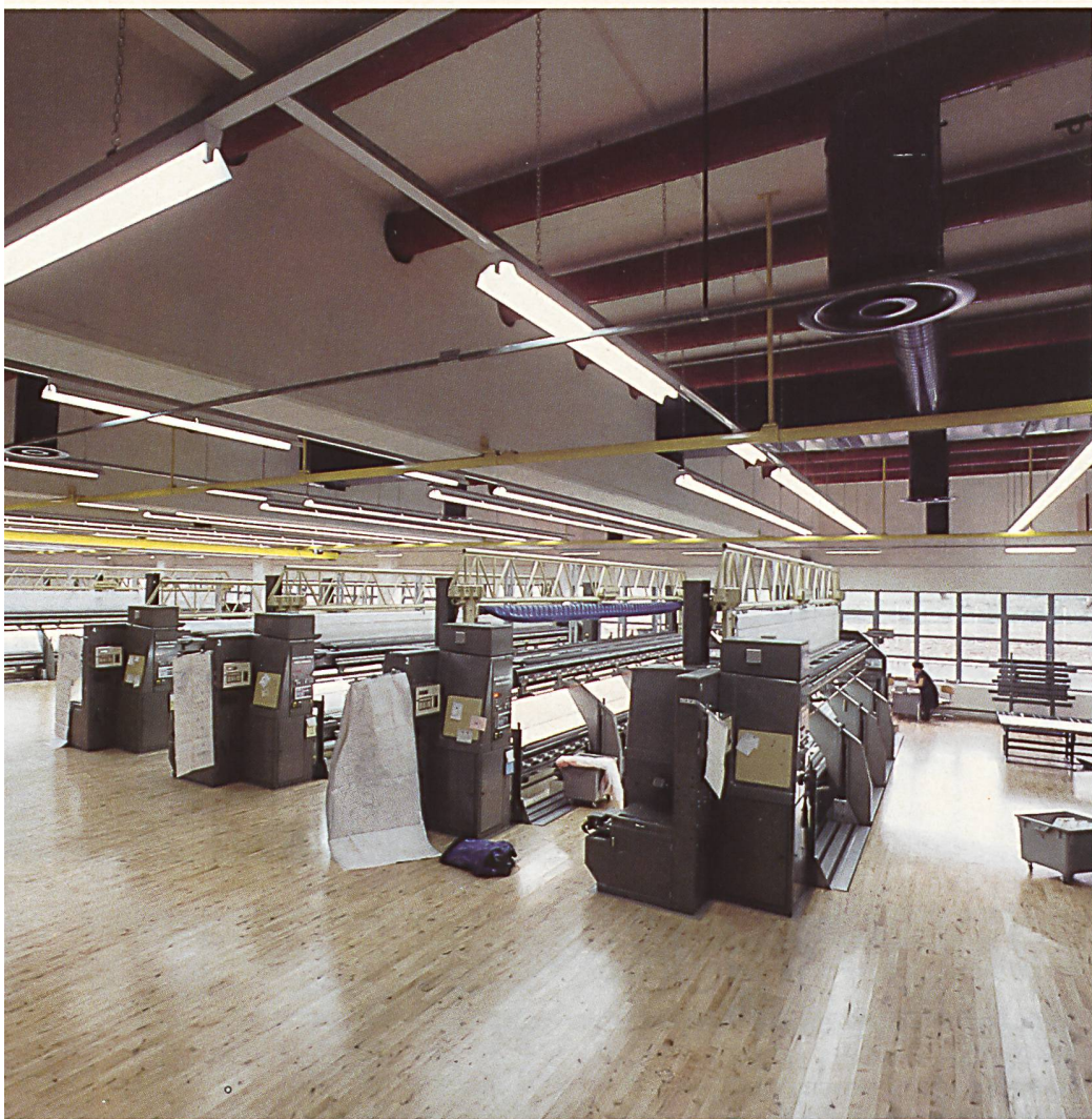
ELEKTRONISCHE MUSTERERFASSUNG (BIFOMAT)