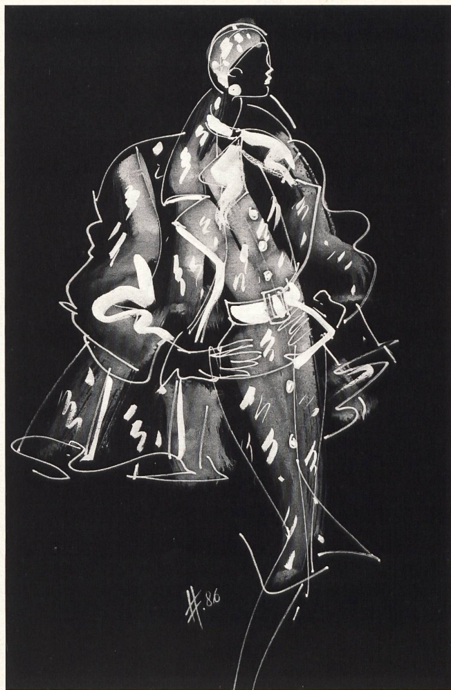
B A L M A I N

Givenchy est un classique lui aussi. Son principe? Harmonie, perfection dans la coupe, noblesse des matières. Sa collection est basée sur les lignes fluides, près du corps. Les tailleurs sont épurés, souvent ceinturés à la taille, avec des basques froncées féminines et des jupes étroites. Les imprimés peau-de-serpent et chat sauvage deviennent des étuis moulants en jersey et des redingotes immensément amples avec des capes font échec au froid. Un thème intéressant de la collection: la fourrure et jusqu'à la fourrure brodée. Le soir également, élégance subtile et raffinement discret. Lignes Empire, princesse, bustiers accentués à la taille sur des jupes bouffantes, tops à bretelles mettant en valeur le dos nu et accompagnant la jupe droite, fourreaux presque «sages» que rehaussent des cardigans aux broderies généreuses, tout cela est une preuve irréfutable de la créativité et du sens de l'élégance équilibrée de ce grand couturier.