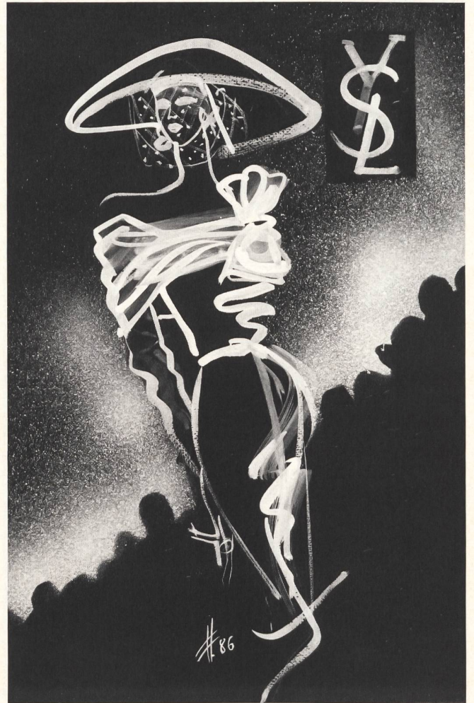
S A I N T L A U R E N T

Christian Lacroix s'affirme davantage chaque saison. Ses idées aux facettes multiples jaillissent, son approche de la Couture inconventionnelle, inédite, s'impose. Les points essentiels: ligne trapèze, taille Empire, robette baby-doll et petticoats, fourrures en couleurs. Robes-manteaux ultra-courtes, «trapèze» ou «parapluie», robes en patchwork style Western, un fourreau en vison mauve qui recouvre à peine les hanches, avec des franges de fourrure, de généreuses garnitures de plumes et – comme toujours chez Lacroix – des chapeaux extraordinaires, redonnent à la mode dynamisme et fascination. Le soir, le couturier revêt sa «femme-enfant» de mini-robottes rococo en taffetas changeant, de baby-dolls en lourde soie avec d'insolents petticoats de dentelle, s'il ne l'enveloppe pas dans une importante robe de taffetas à bustier léopard, ou dans un fourreau coloré à souhait avec d'immenses manches bouffantes et une tournure.