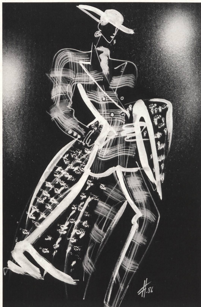
C H A N E L

Ungaro est un sculpteur parmi les couturiers. Fidèle à son maître, Cristobal Balenciaga, à qui la collection d'hiver est dédiée, il modèle et façonne ses créations de rêve. Il réalise, avec une parfaite maîtrise de la technique et un raffinement extrême les manteaux carrés, les épaules élargies par de souples plis qui accompagnent l'ensemble pantalon, les vestes longues et ceinturées sur la jupe plissée soleil, les burnous enveloppants faits de souples lainages et les bruisantes pèlerines de soie. Le soir, la «diva» d'Ungaro apparaît dans des robes fin de siècle, moulantes, froncées et bouffantes avec d'immenses manches gigot boutonnées sur le poignet, il l'enveloppe dans des capes flottantes en gazar, dans du taffetas plissé et changeant à l'infini avec des nœuds amidonnés et des cascades de volants. L'essentiel demeure la silhouette fine et moulée, qu'entourent les éléments décoratifs de leurs effets vibrants.