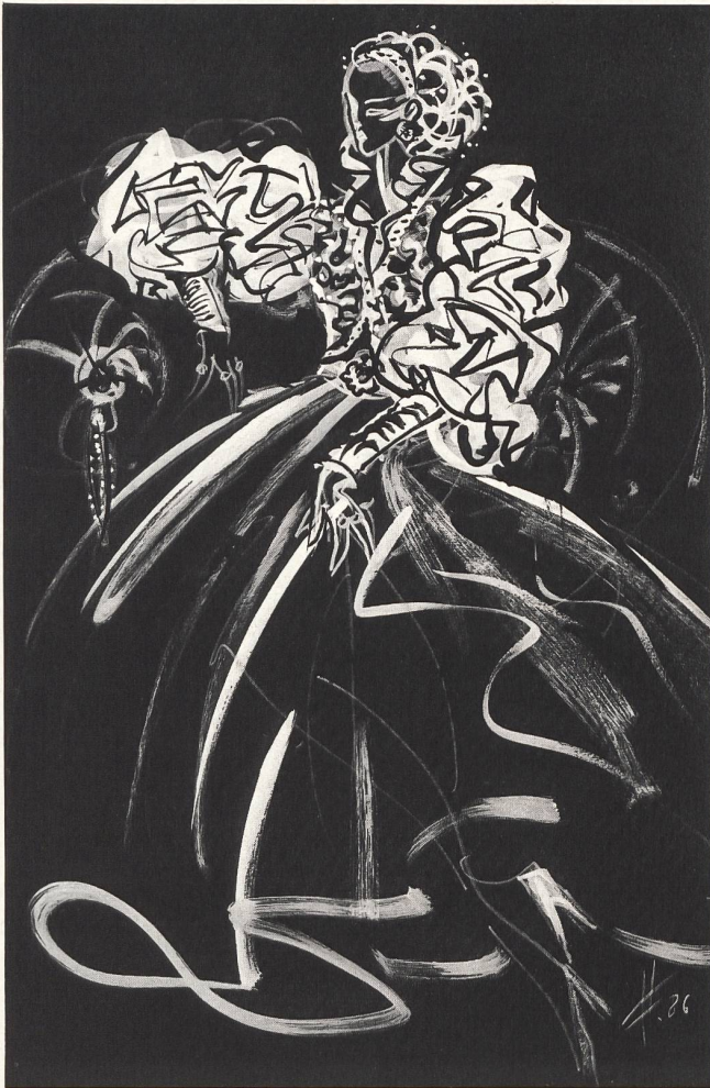
S C H E R R E R