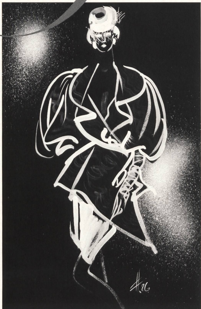
U N G A R O