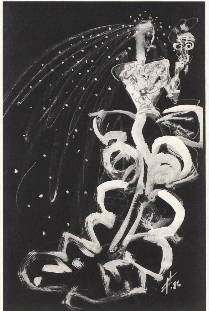
C A R D I N

Nostalgie et glorieuses époques de l'histoire sont les sources d'inspiration de Jean-Louis Scherrer. La Russie des tsars revit dans ses manteaux de boyards garnis de fourrure et les pantalons de kirghiz qui les accompagnent, ses redingotes aux chevilles à capeline de cocher, ses gilets ajustés et ses spencers de fourrure, ses vestes de cosaques brodées et surmontées d'immenses toques de fourrure. La Renaissance vénitienne lui inspire des vêtements de doge en taffetas rebrodé d'or et de pierreries ou en précieux patchwork, d'immenses manches bouffantes donnent un caractère théâtral à ses fourreaux de velours noir. Inspiration d'un genre particulier, caractéristique de l'hiver 86/87: les «Femmes-oiseaux», en flatteuses robes de mousseline agrémentées de cols, de manchettes, de boas et de chapeaux en plumes de coq, d'autruche, de perroquets et d'oiseaux de Paradis!