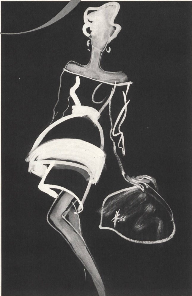
P A T O U