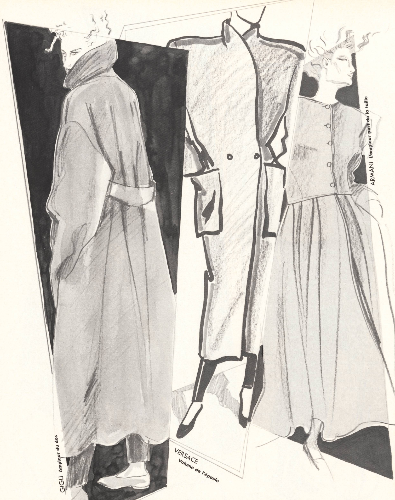
GIGLI Ampleur du dos