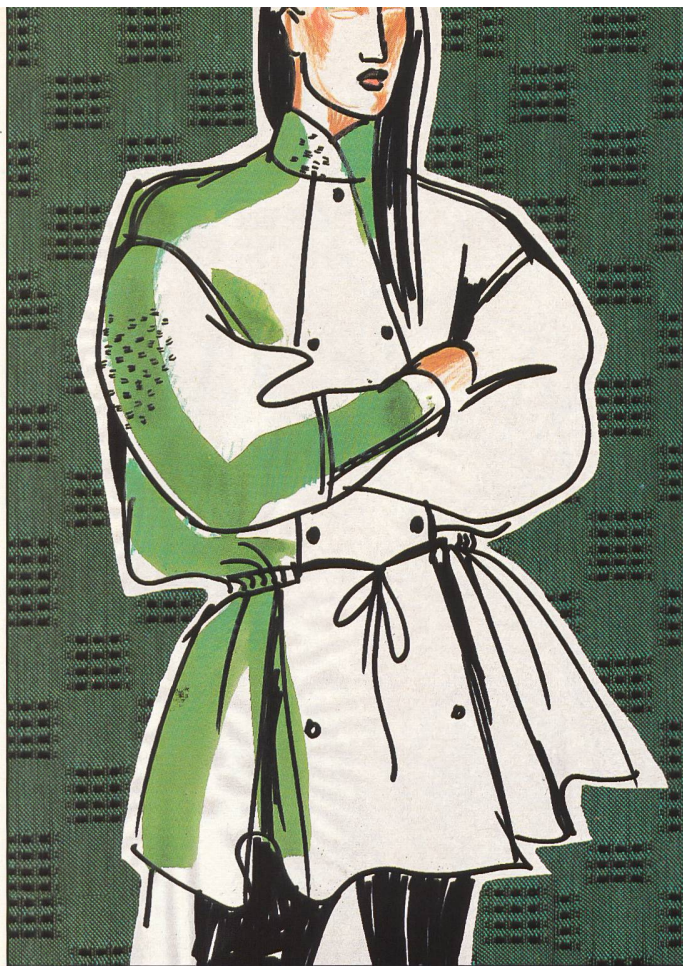
Imprägnierte Webqualität aus 45% Tersuisse/ 65% CO. Textilwerke Ganahl