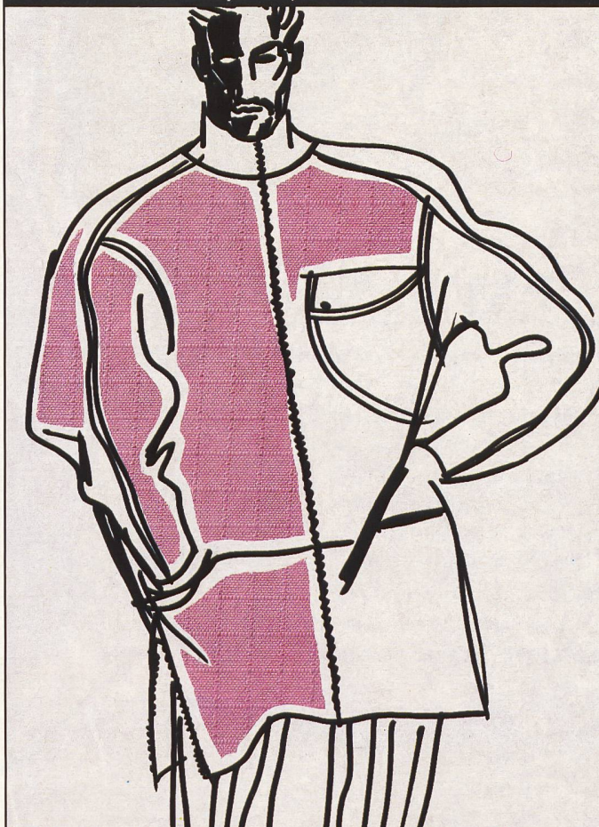
Imprägnierte Webware mit Karoeffekt aus 35% Nylsuisse/65% CO. Rotofil AG, Zürich