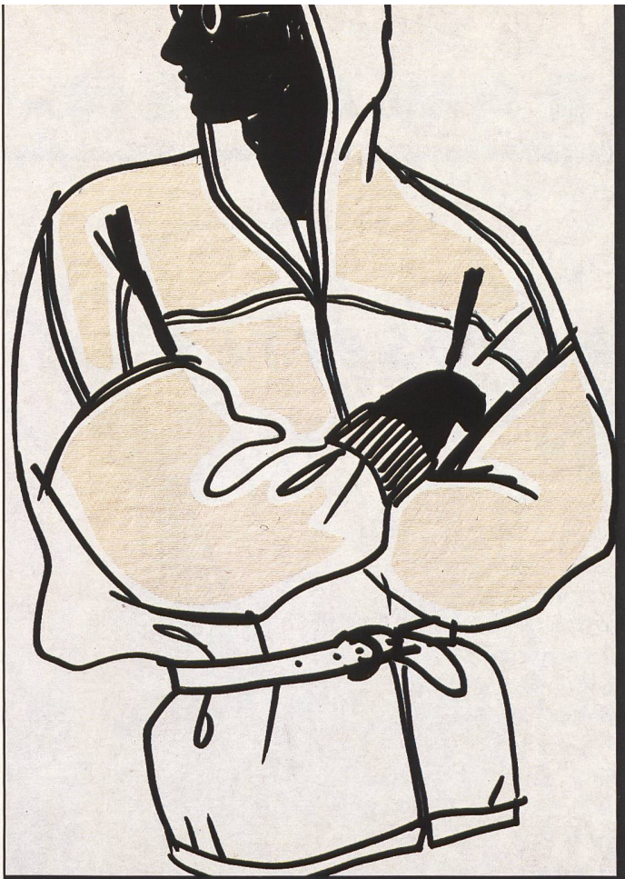
Imprägnierte Crinkleware aus Nylsuisse. Finlayson AG