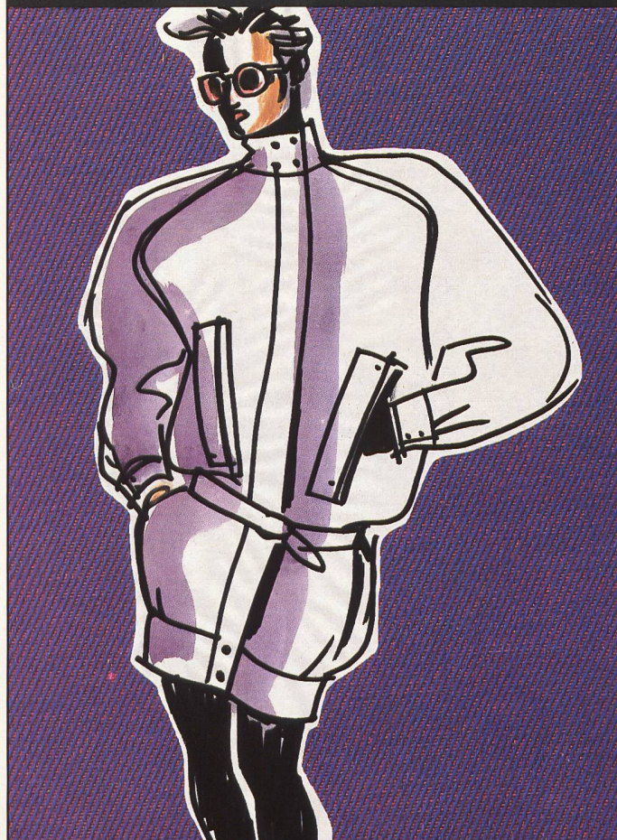
Webqualität aus 48% Nylsuisse/52% CV. Pottendorfer Textilwerke