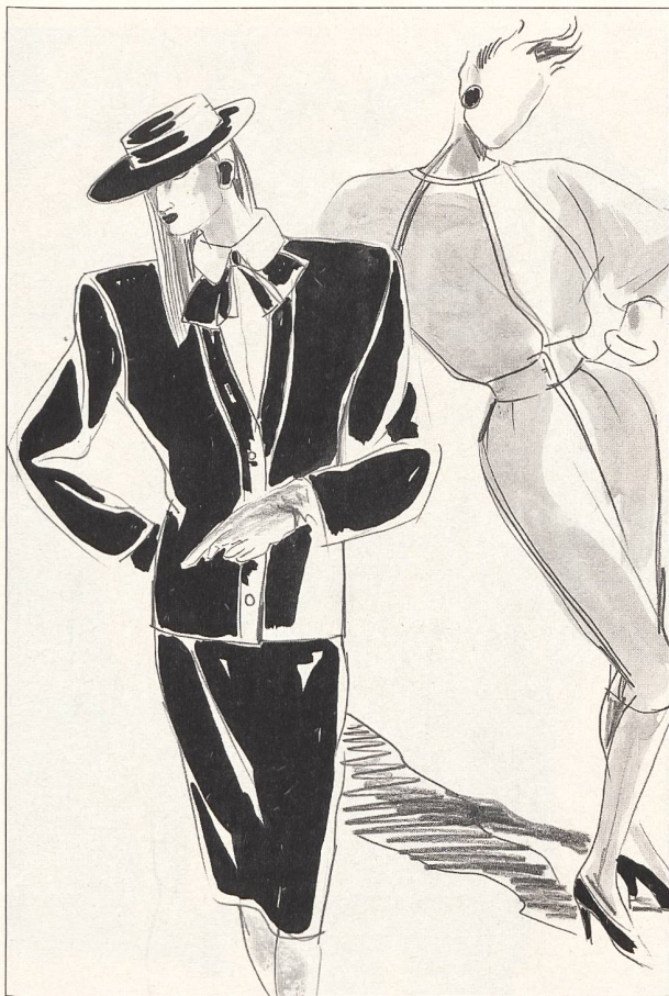
S A I N T L A U R E N T