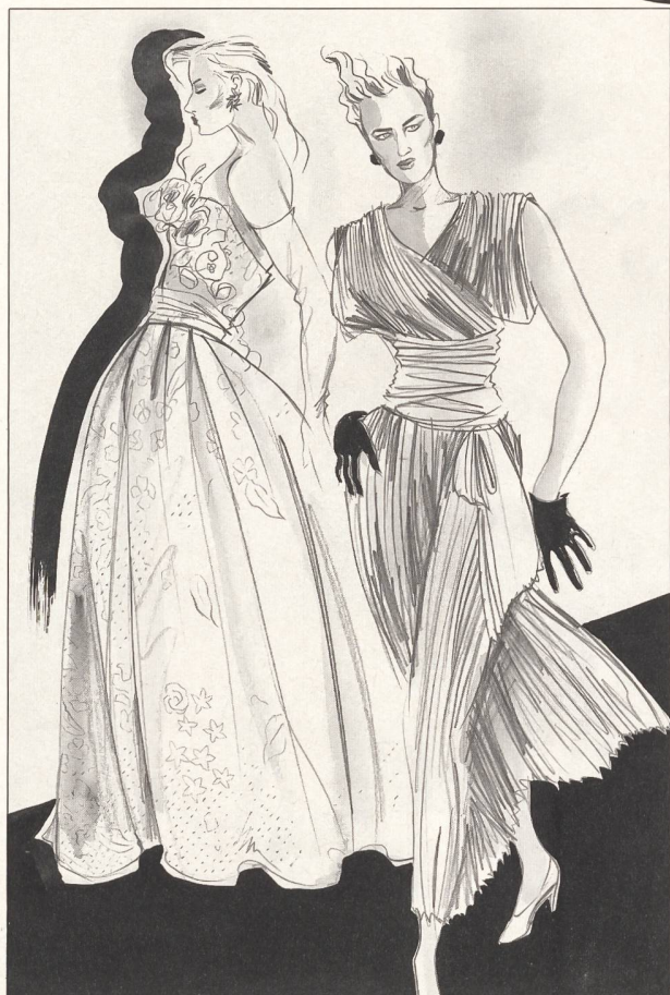
N I N A R I C C I