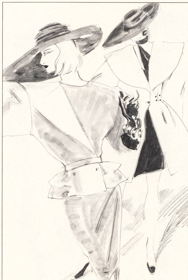
U N G A R O

Pôle d'attraction, chez YSL, le tailleur parfait. Les vestes tailleur classiques à revers allongés se ferment par un bouton. Epaules élargies, dos droit et taille froncée pour la jupe courte – au genou – et étroite. Des chemisiers avec un grand nœud à l'encolure ou des T-shirts accompagnent le tailleur. Teintes préférées: argent et gris perle. Les unis dominant et, parmi eux, les classiques pieds-de-poule très fins, Prince-de-Galles et chevrons jacquard. Le soir, c'est encore un understatement raffiné. Des fourreaux moulants surmontés de bustiers drapés, des étuis fermés haut et ceinturés à la Garbo, des boléros en peau de serpent et des cardigans scintillants brodés d'un dessin «crocodile».