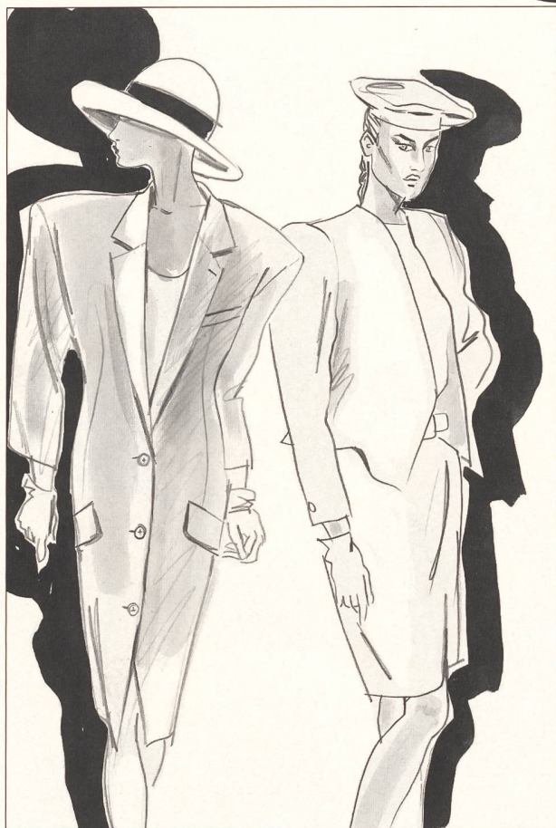
D I O R