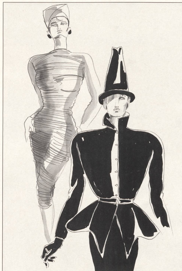
C A R D I N

Le thème essentiel de Gérard Pipart, 24 heures sur 24, se résume par tailleur et marine/blanc. La veste ajustée, très cintrée à la taille, se porte avec des jupes étroites ou d'amples jupes plissées – courtes le jour, à mi-mollet le soir; des bustiers scintillants les complètent. Les ensembles pantalons s'accompagnent également de bustiers habillés. Des shorts amples et confortables se portent avec des brassières drapées et de vastes manteaux flottants. Les tuniques luxueuses, les fourreaux, les manteaux maxi en taffetas rebrodé, les petticoats vaporeux surmontés de corsages brodés et de longs manteaux réalisés dans les créations de M me Brossens de Méré habillent les belles soirées.