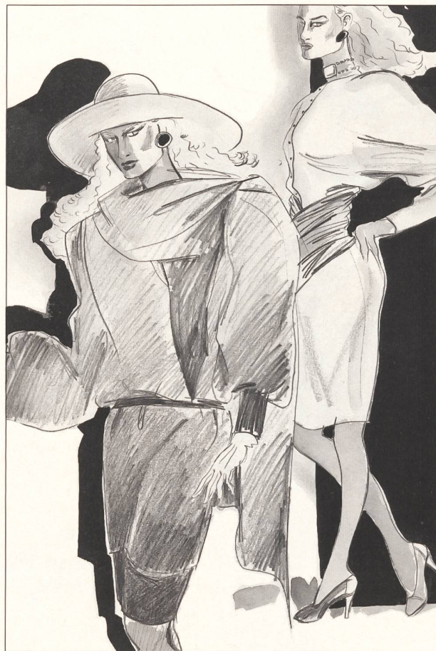
S C H E R R E R

Seules concessions: dentelles, broderies, débardeurs scintillants et tissus précieux. La collection est féminine avant tout et, dans son ensemble, très élégante et totalement Haute Couture!