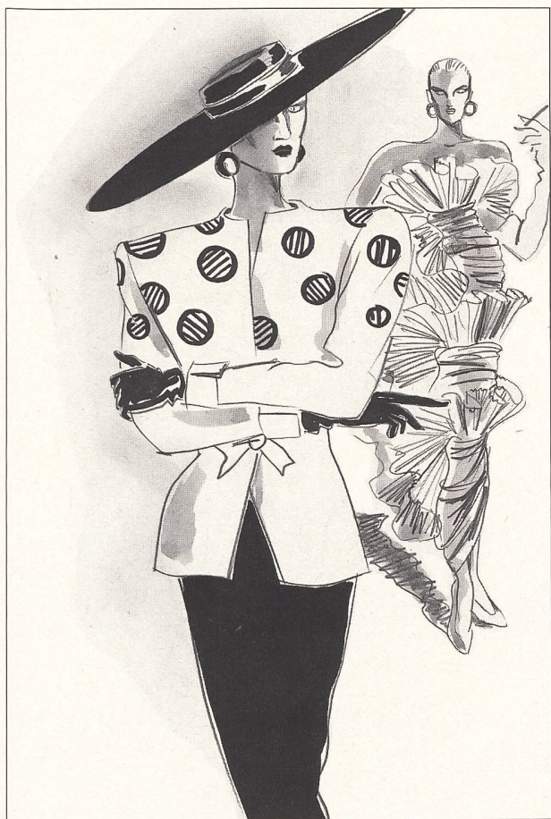
B A L M A I N