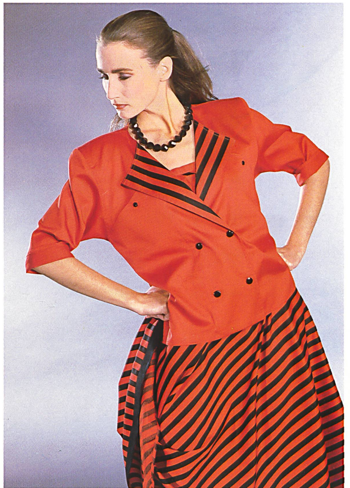
FILTEX AG, ST. GALLEN «MELODY» BAUMWOLLSATIN BEDRUCKT ZU ASSORTIERTER UNIQUALITÄT / SATIN DE COTON IMPRIMÉ ET TISSU UNI ASSORTI / PRINTED COTTON SATIN WITH MATCHING PLAIN-COLOURED QUALITY. MOD. HANS ERRAS, MÜNCHEN