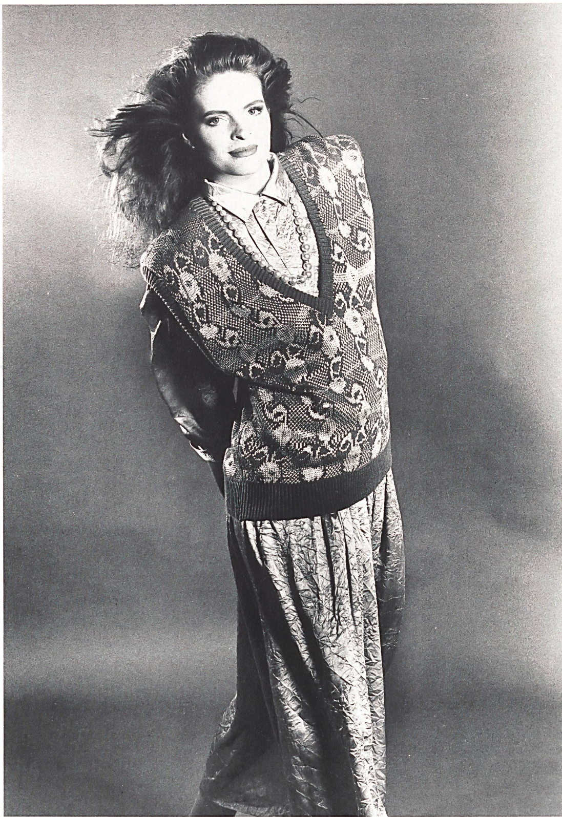
E. SCHUBIGER + CIE AG, UZNACH KLEID AUS REINSEIDEN-CRÊPE SATIN / ROBE EN CRÊPE SATIN PURE SOIE / DRESS IN PURE SILK CRÊPE SATIN. MOD. UTA RAASCH, DÜSSELDORF