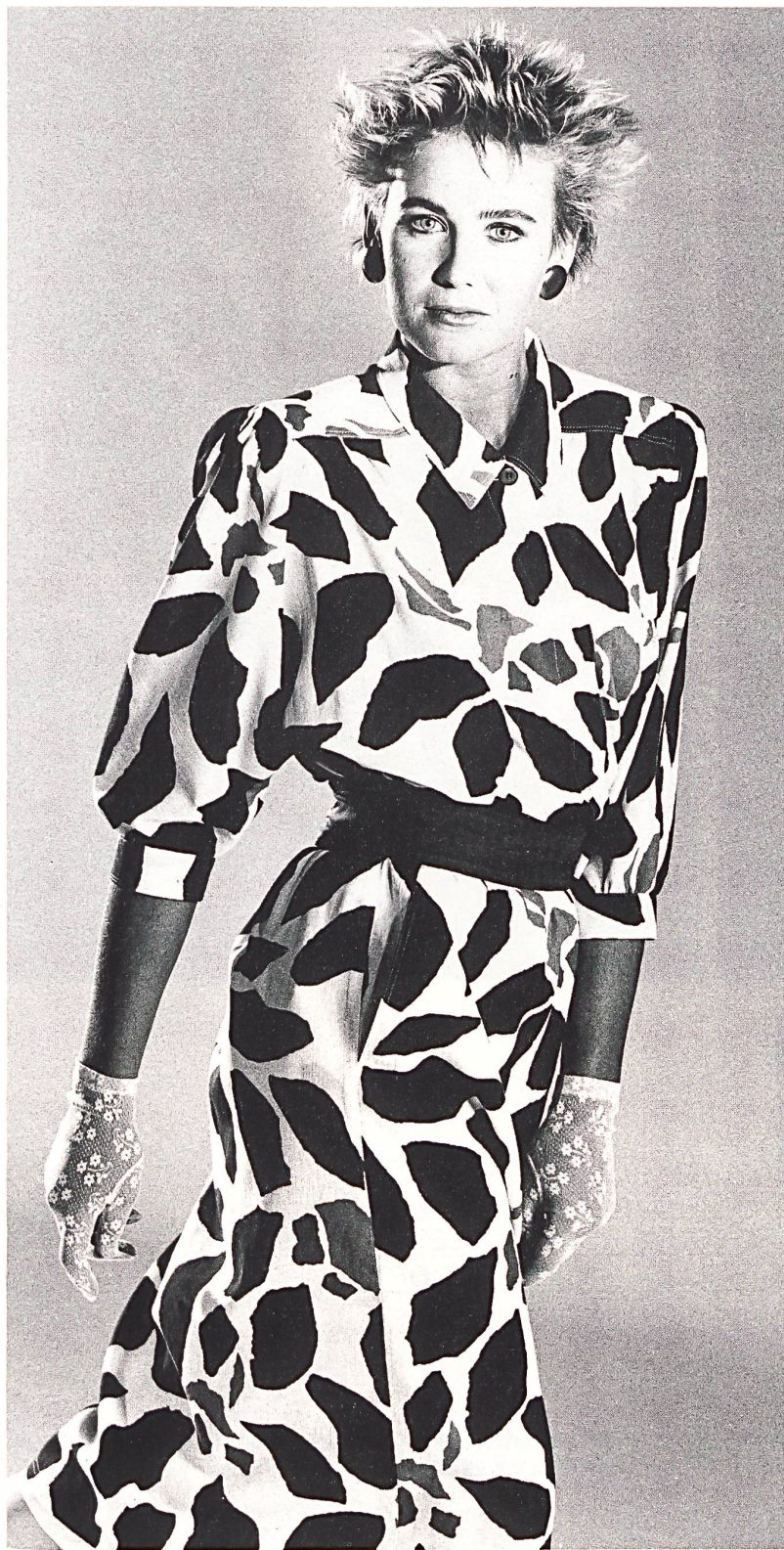
METTLER + CO. AG, ST. GALLEN «SAHARA» BAUMWOLLGEWEBE BEDRUCKT / TISSU COTON IMPRIMÉ / COTTON PRINT. MOD. MISS ANTONETTE, MÜNCHEN