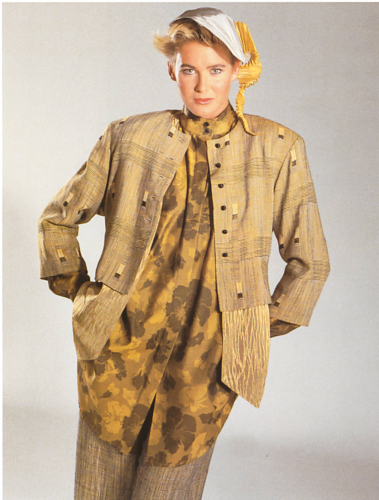
TACO AG, GLATTBRUGG «NEW YORK» MISCHGEWEBE BAUMWOLLE/VISCOSE/LEINEN / TISSU MIXTE COTON/VISCOSE/LIN / COTTON/VISCOSE/LINEN BLENDED FABRIC. MOD. BARBARA DIETRICH, BERLIN