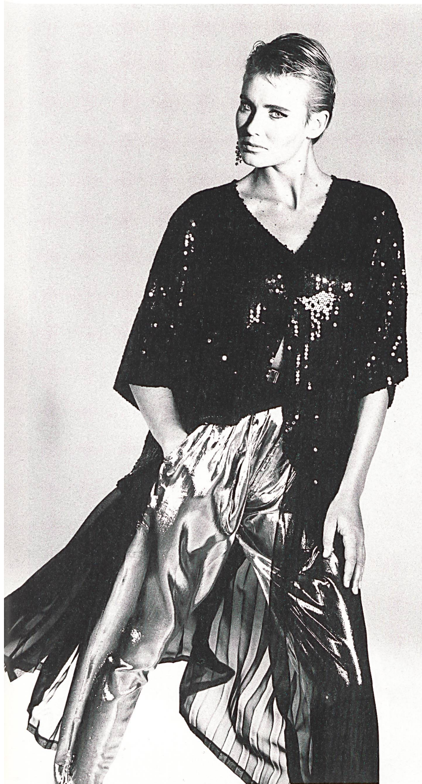
JAKOB SCHLAEPFER + CO. AG, ST. GALLEN SCHWARZE PAILLETENSTICKEREI AUF «DINA» / BRODERIE EN PAILLETES NOIRES SUR «DINA» / BLACK PAILLETTE EMBROIDERY ON «DINA». MOD. REIMER CLAUSSEN, BERLIN