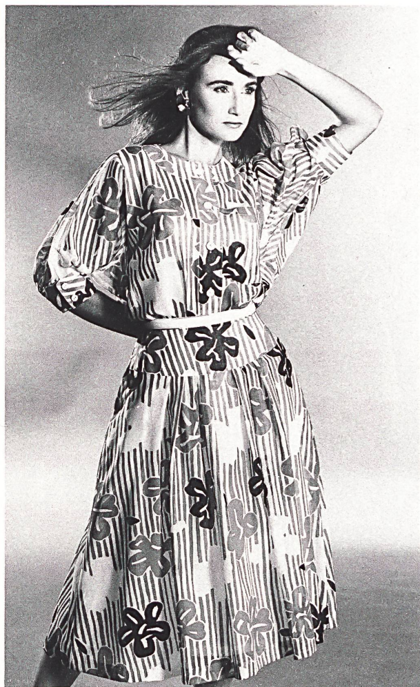
H. GUT + CO. AG, ZÜRICH «SIRACUSA» BAUMWOLL- GEWEBE BEDRUCKT / COTON IMPRIMÉ / COTTON PRINT. MOD. STUDIO PARIS, KREFELD