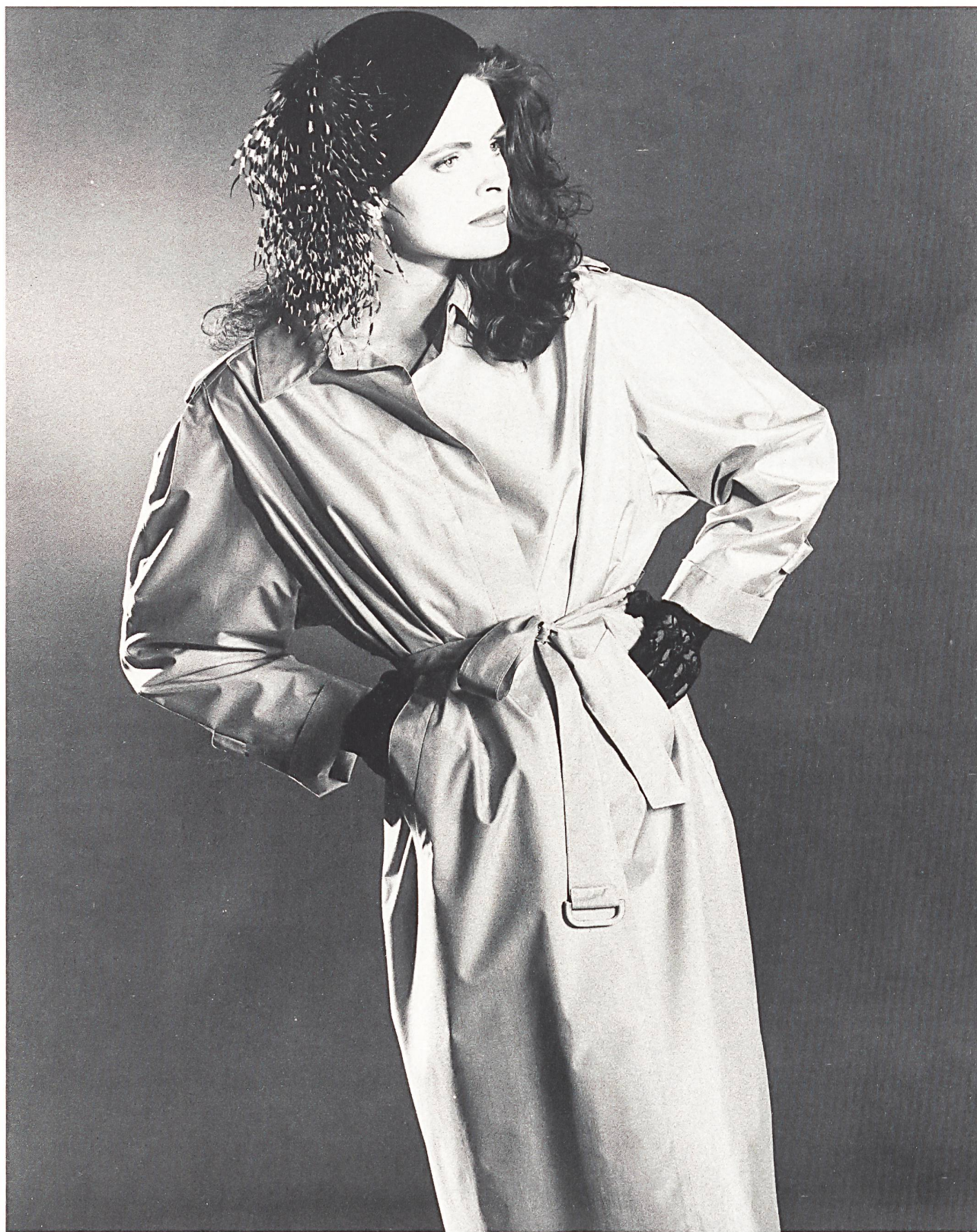
E. SCHUBIGER + CIE AG, UZNACH «FURIOSO» REGENMANTELTOILE, REINE SEIDE / TOILE PURE SOIE POUR MANTEAUX DE PLUIE / PURE SILK RAINCOAT TOILE. MOD. WALTER MODELLE, BAD AIBLING