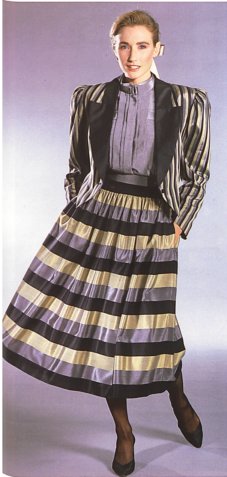
STEHLI SEIDEN AG, OBFELDEN «DYNASTY» GLÄNZENDES MISCHGEWEBE BAUMWOLLE/VISCOSE / MÉLANGE COTON/VISCOSE BRILLANT / SHINY COTTON/VISCOSE BLENDED FABRIC. MOD. LUCIE LINDEN, DEGGENDORF