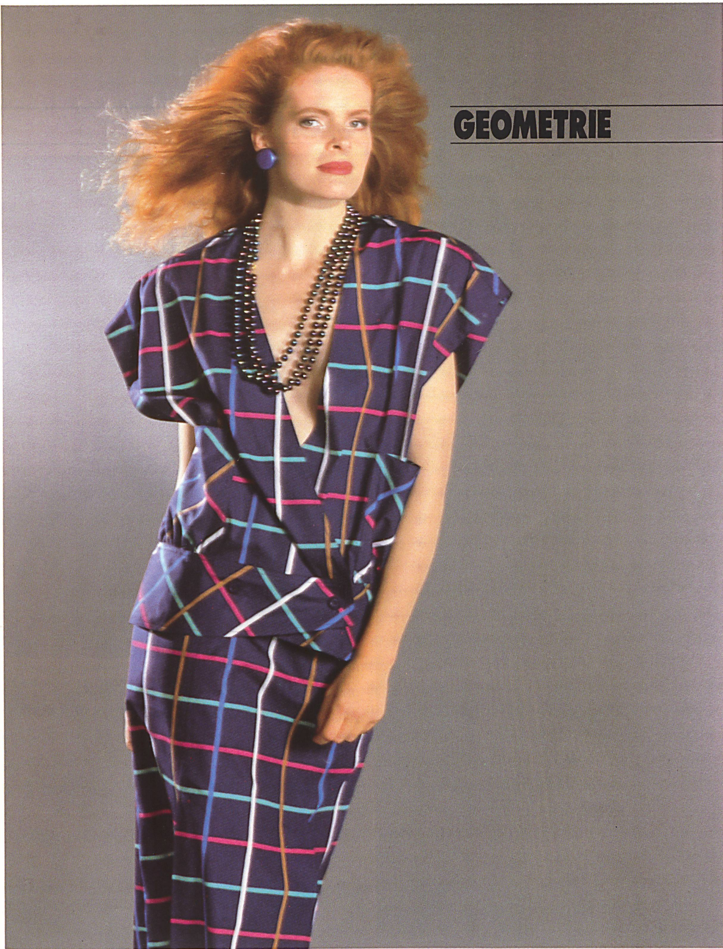
HAUSAMMANN + MOOS AG, WEISSLINGEN «SMERALDA» BAUMWOLL-POPELINE BEDRUCKT / POPELINE DE COTON IMPRIMÉ / COTTON POPLIN PRINT. MOD. AVANTGARDE, BIELEFELD