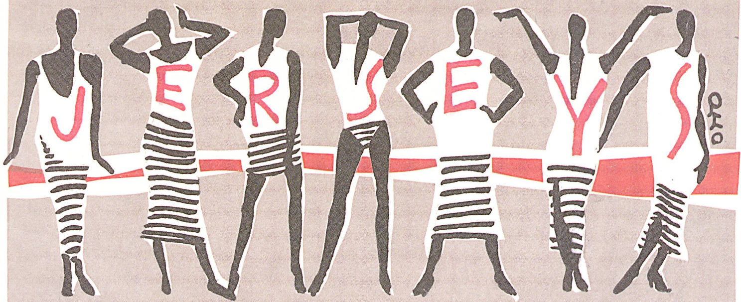
FORSTER WILLI ST-GALL