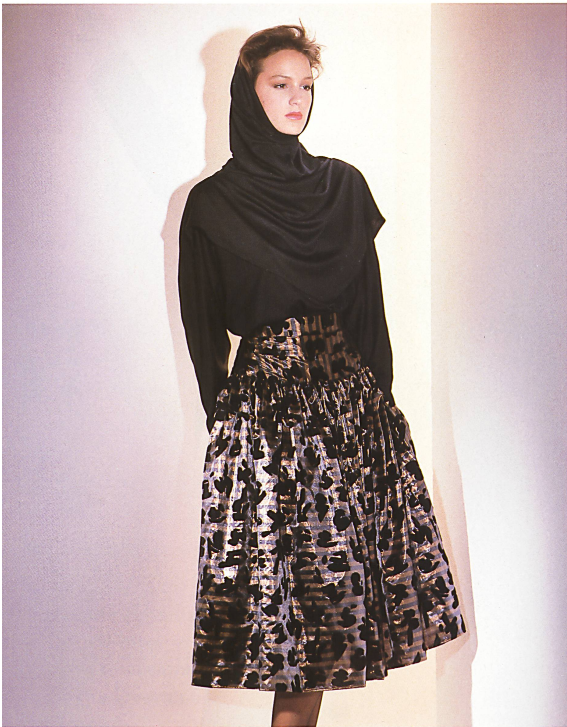
STEHLI SEIDEN AG, OBFELDEN — Taffetas Lurex rayé avec un flock-print très actuel / Gestreifter Lurex Taffetas mit modischem Flockprint / Striped lurex taffetas with stylish flock print. Mod. Christian Aujard, Paris