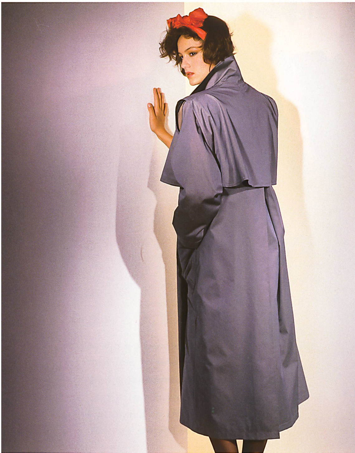
HAUSAMMANN + MOOS AG, WEISSLINGEN — Imperméable avec le dos genre cape en gabardine de coton changeant / Imperméable mit capeartiger Rückenpartie aus Changeant-Baumwollgabardine / Raincoat with back bodice cape in shot cotton gabardine. Mod. Ted Lapidus