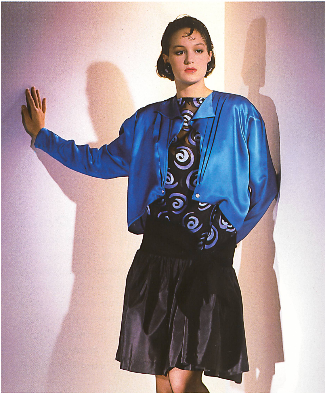
SCHUBIGER + CIE AG, UZNACH — Blouse pour le soir en soie/viscose à effets de carbonisation «Setubal» / Abendbluse aus Seide/Viscose-Ausbrenner «Setubal» / Evening blouse in silk/viscose burnt-out «Setubal». Mod. Créations Jobard, Paris