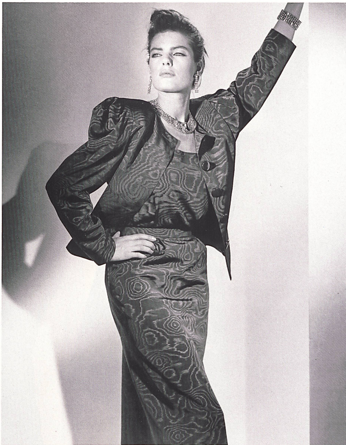
WEISBROD-ZÜRRER AG, HAUSEN AM ALBIS — Ensemble robe et veste en moiré lustré acétate/viscose «Galoche» / Kleid/Jackenensemble aus schimmerndem Moiré-Acetat/Viscose «Galoche» / Dress/jacket ensemble in shimmering moiré acetate/viscose «Galoche». Mod. Weinberg Dept. Pierre Balmain, Paris