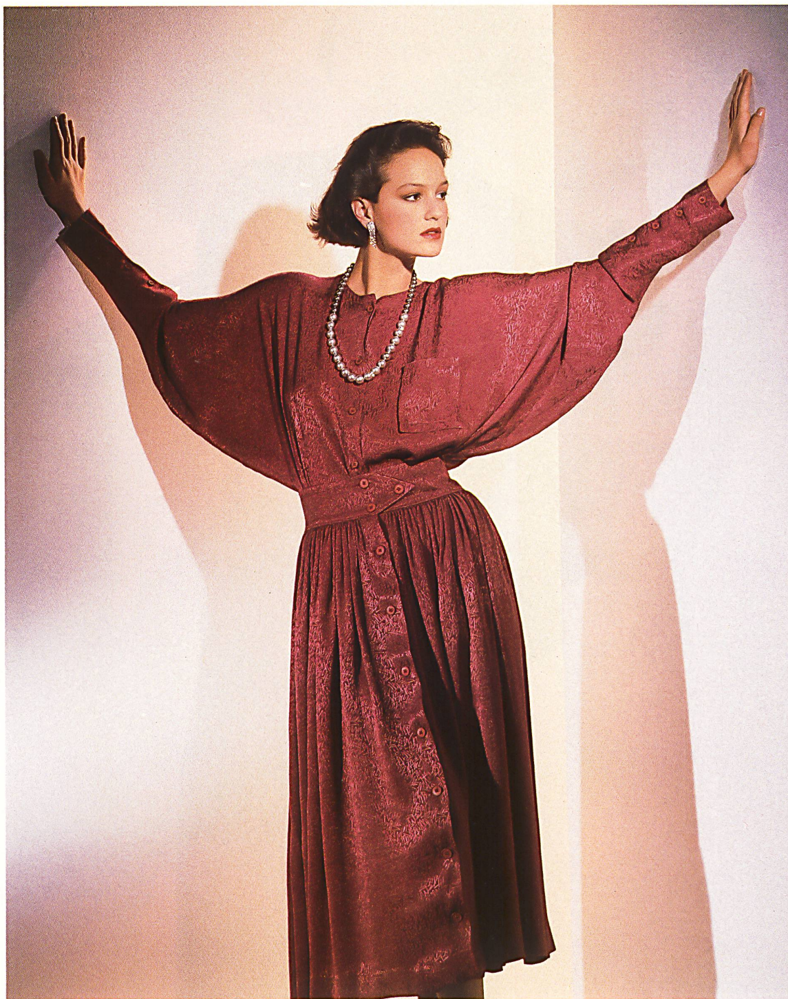
STEHLI SEIDEN AG, OBFELDEN — Modèle habillé à manches chauve-souris flatteuses, taille doucement marquée, dans un jacquard viscose fluide / Elegantes Modell mit schmeichelnden Fledermausärmeln und sanft markierter Taille aus fließendem Viscose-Jacquard / Elegant model with flattering batwing sleeves and softly defined waistline in flowing viscose jacquard. Mod. Christian Aujard, Paris