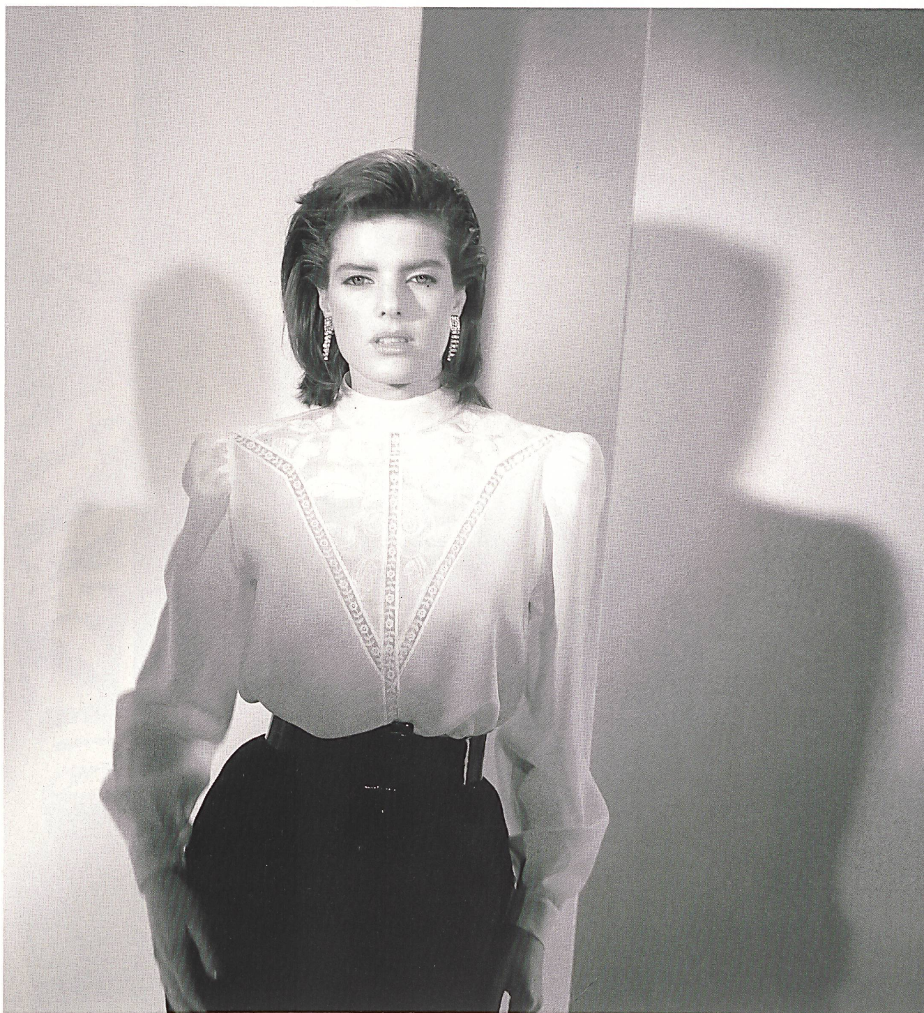
BISCHOFF TEXTIL AG, ST. GALLEN — Importante broderie rayonne sur empiècement à motif, bordure chimique, en crêpe polyester / Grossflächige Kunstseidenstickerei auf Motiveinsatz mit Ätzabschluss, Polyester-Crêpe / Rich rayon embroidery on motif insert with burnt-out edging, polyester crêpe. Mod. Muriel Céalac, Paris