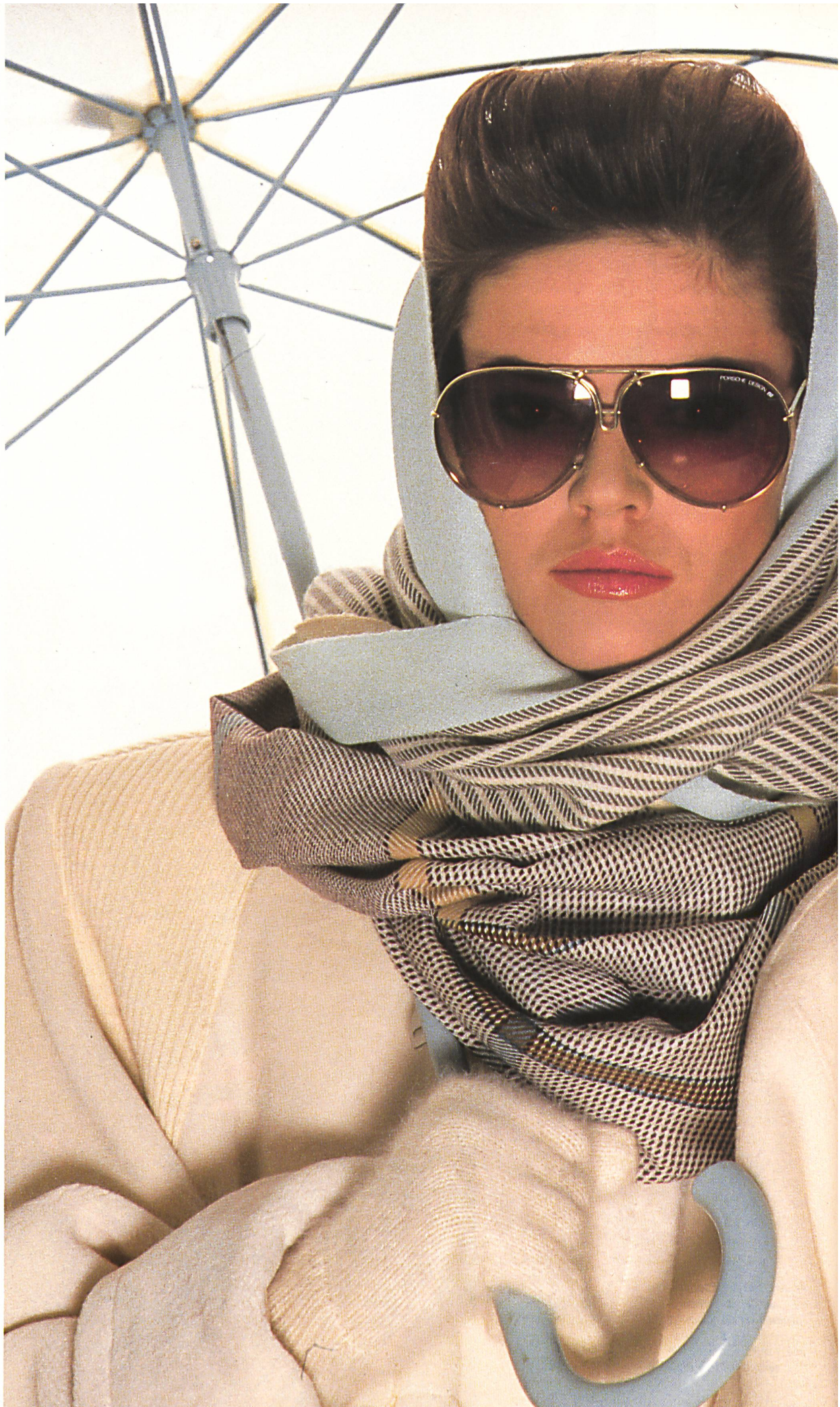
Bunt- und Jacquard- gewebte Woll- Echarpen / Echarpes tissées jacquard en laine multicolores / Colour- and jacquard- woven woolen neck- scarves (37 × 180 cm / 30 × 150 cm).