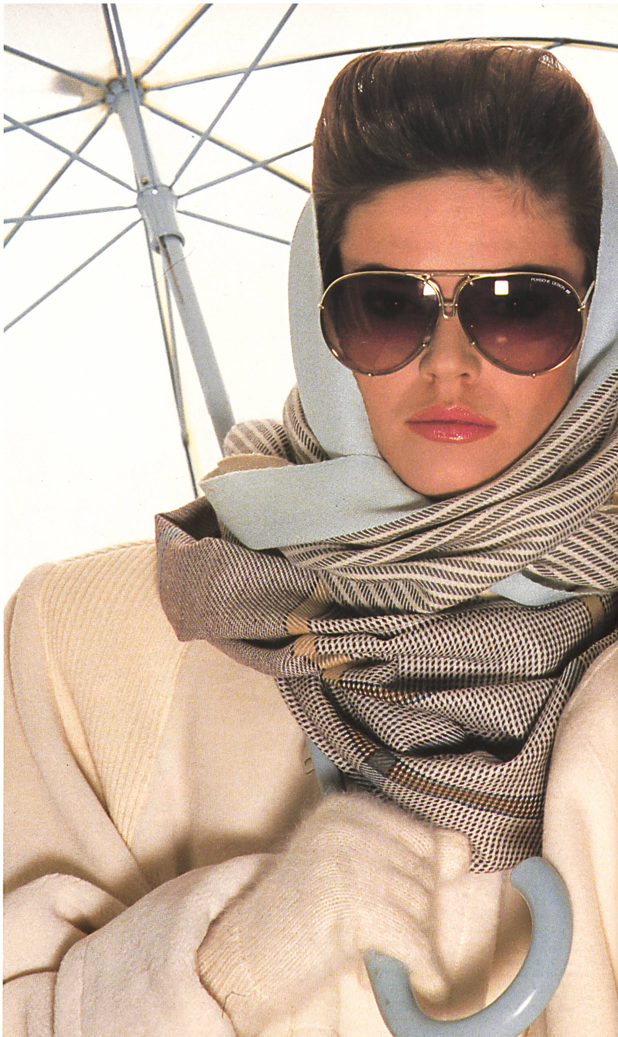
Bunt- und Jacquard- gewebte Woll- Echarpen / Echarpes tissées jacquard en laine multicolores / Colour- and jacquard- woven woolen neck- scarves (37 × 180 cm / 30 × 150 cm).