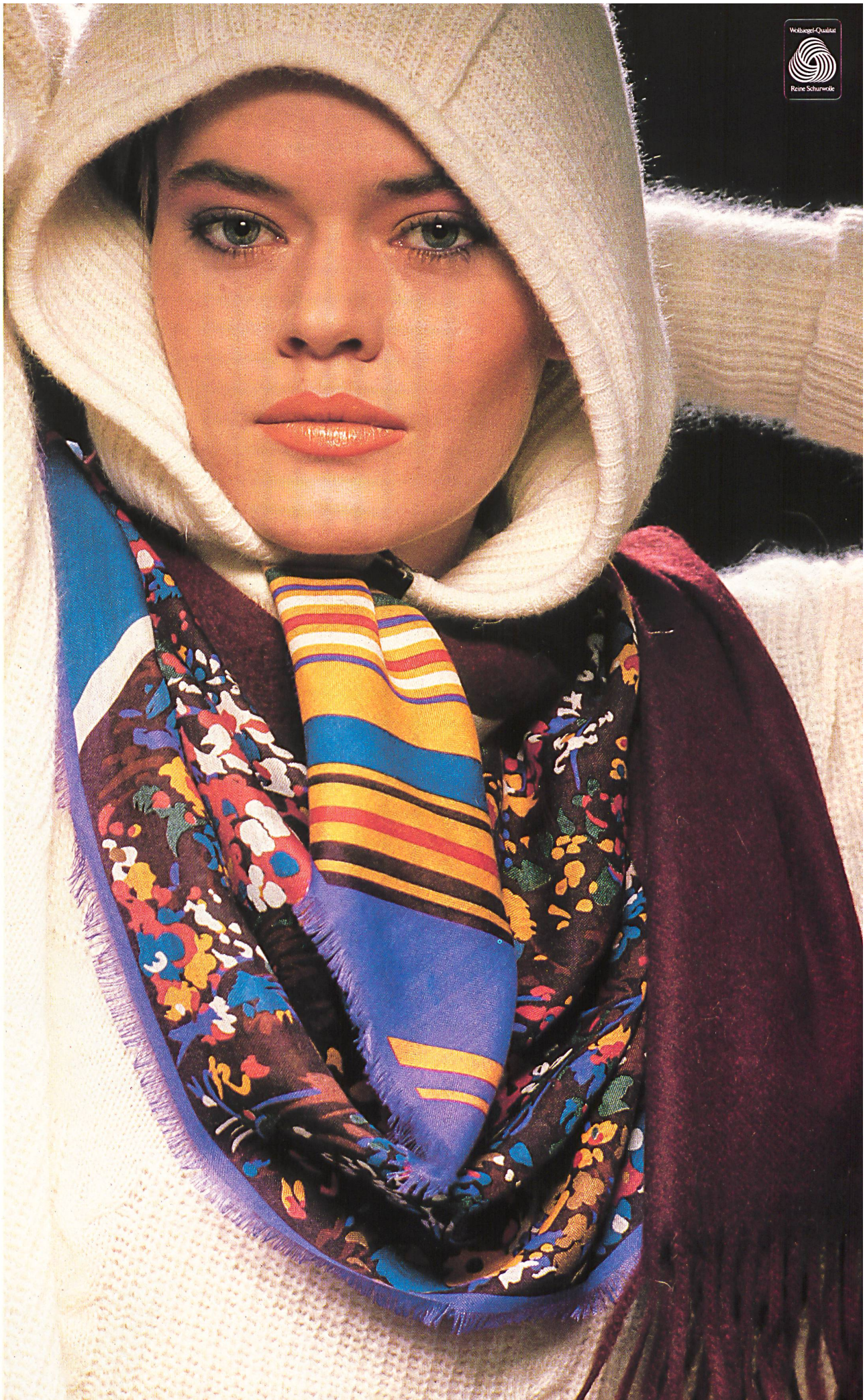
Foulard aus Kaschmir, Seide und Wolle / Foulard en cachemire, soie et laine / Head- scarf in cashmere, silk and wool (90 cm).