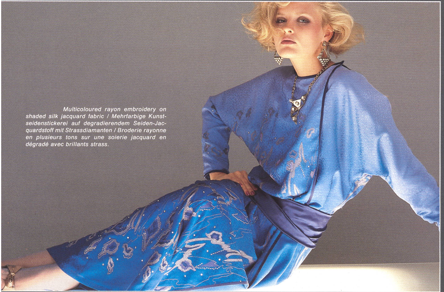
Multicoloured rayon embroidery on shaded silk jacquard fabric / Mehrfarbige Kunstseidenstickerei auf degradierendem Seiden-Jacquardstoff mit Strassdiamanten / Broderie rayonne en plusieurs tons sur une soierie jacquard en dégradé avec brillants strass.