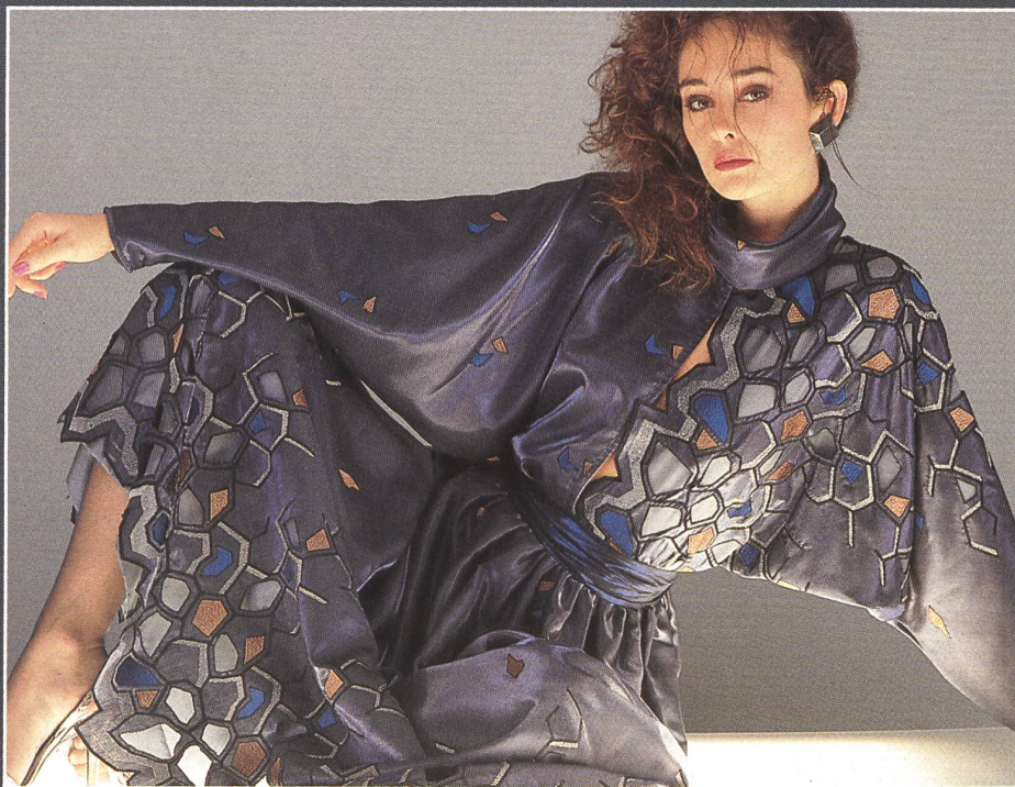
Cut-out edgings in multicoloured embroidery on Satin Royal / Gespachtelte Bordüre, mehrfarbig bestickt, auf Satin Royal / Bordure découpée et rebrodée en plusieurs tons sur du satin royal.

Jacob Rohner Ltd, Rebstein, whose embroidery collection seems to reach new heights of perfection each season, offers stylists of Prêt-à-Porter and the better ready-to-wear collections for the autumn/winter 1984/85 a particularly attractive range of fashionable new embroideries, satisfying the highest demands of quality and exclusivity.