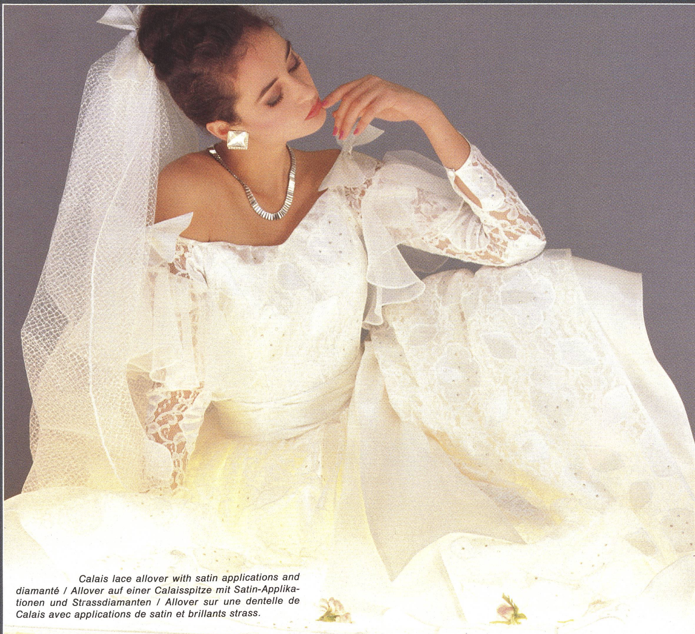
Calais lace allover with satin applications and diamanté / Allover auf einer Calais Spitze mit Satin-Applikationen und Strassdiamanten / Allover sur une dentelle de Calais avec applications de satin et brillants strass.

Die Jacob Rohner AG, Rebstein, deren Stickerei-Kollektion von Saison zu Saison auf ein höheres Niveau gebracht wird, präsentiert verwöhnten Stylisten des Prêt-à-Porter und der gehobenen Konfektion für Herbst/Winter 1984/85 ein modisch besonders ansprechendes Sortiment an Stickerei-Nouveautés, das selbst hohen Anforderungen an Qualität und Exklusivität gerecht wird. Schon die Stickfonds sind bemerkenswert, oft Eigenentwicklungen, in Zusammenarbeit mit leistungsfähigen Webern entstanden. Stoffe aus reiner Seide, Crêpes de Chine mit Chenillegarn strukturiert, Satins, Façonnés, Dégradés und interessante Mischgewebe mit farblosen, schimmernden Lamégarnen sind nur einige davon, die zur Auswahl stehen. Die Farbpalette ist zurückhaltend gedämpft, mit viel Schwarz, Grau, Braun und Blau in allen Nuancen, aufgehellt mit Effektkoloriten.