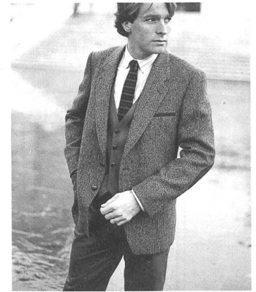
Unter dem Motto «oversized» der superweiche «Pulloverveston» aus locker gewobener Schurwolle, dazu Baumwoll-Hose und Gilet. (Truns Tuch- und Kleiderfabrik)

«Stürmisch und turbulent» ging es nach Aussage von I.G.-Herrenmodepräsident Hans C. Eggenberger am ersten Tag der schweizerischen HAKA-Messe im TMC zu und her. In grosser Zahl waren die Fachbesucher erschienen, um sich auf den Ständen der 60 Aussteller über die Herrenmode Herbst/Winter 1983/84 zu orientieren. Erstmals vermittelte auch eine gut besuchte Video-Show im Foyer des TMC Trendinformationen in Wort und Bild. Danach wird der modische Mann im nächsten Winter viel Leder und Lederapplikationen tragen; er wird Wollsakos zu Baumwollhosen kombinieren und sich öfters als bislang einen Hut aufsetzen. Materialmix, Farbmix und Accessoires sind wichtige Elemente der neuen HAKA-Mode. Die Schweizer Aussteller haben sich auf den modebewussteren Konsumenten eingestellt mit komfortabel geschnittener Citybekleidung in «Hunting»-Farben und fantasievoller Sportswear in Nebeltönen. Bleibt zu hoffen, dass die Anstrengungen in der Stoffkreation und im Stylingdesign dem HAKA-Markt neuen Auftrieb geben. Er hat es bitter nötig, denn im vergangenen Jahr hat sich der Verdrängungswettbewerb noch verschärft. 1982 sind die schweizerischen HAKA-Einfuhren um 7,8% (aus der BRD um 10%) gestiegen, die schweizerischen HAKA-Ausfuhren um 18,5% (nach der BRD um 23,8%) gesunken. Mit einem Anteil von 31% bleibt die Bundesrepublik