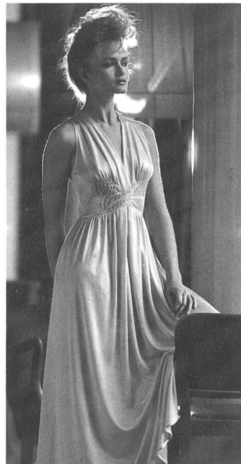
Elegantes, langes Nachthemd aus feinstem Seiden-Jersey im «Marilyn-Monroe-Stil», mit einer Masche aus St. Galler-Stikerei Ton in Ton. (Hanro Lingerie)

Und was für die Dessous der Frau gilt, lässt sich natürlich für die Tagwäsche der anspruchsvollen Männer anwenden: gute Passformen, anatomisch richtige Schnitte und Naturfasern –