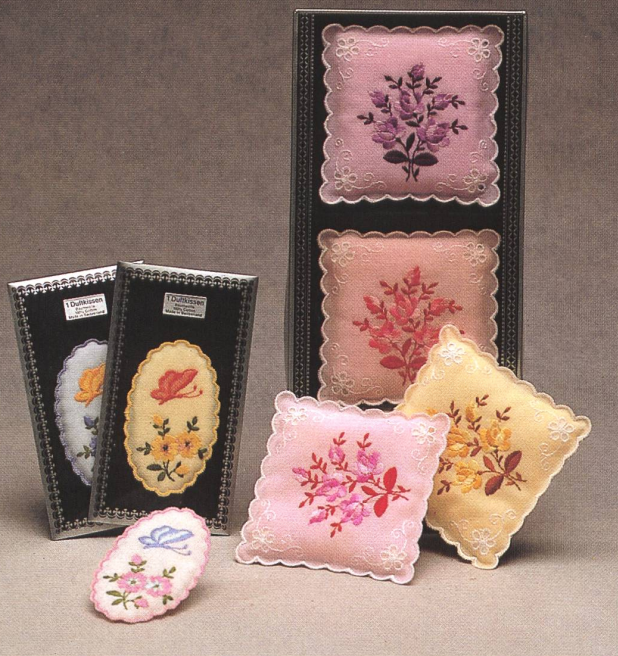
JACOB ROHNER of Switzerland

– small in size, varied in shape, and beautifully embroidered – are very popular with discriminating women of fashion for the discreet perfume they give off in handbags, linen chests or on clothes hangers. Who could resist them?